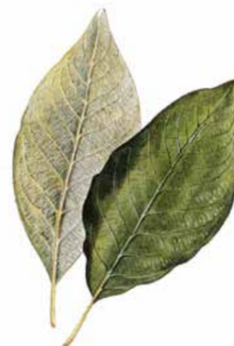
Sälg Salix caprea