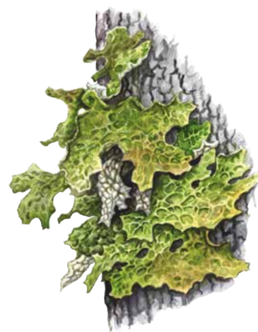
Lunglav Lobaria pulmonaria

I reservatet är det bara någon enstaka brandskadad tall och svartotig stubbe som minner om eldens framfart. Efter den stora branden fick aspar, sälgar, rönnar och björkar chans att gro på Täxbergets sluttningar och sedan dess är lövträden ett av bergets främsta kännetecken. Men det var länge sedan skogen brann och barrträden börjar sakta men säkert ta över. För att gynna lövträden och de arter som är beroende av dem, kommer därför granar att avverkas och ringbarkas. På sikt kommer skogen också att naturvårdsbrännas så att nya lövträd åter kan spira.