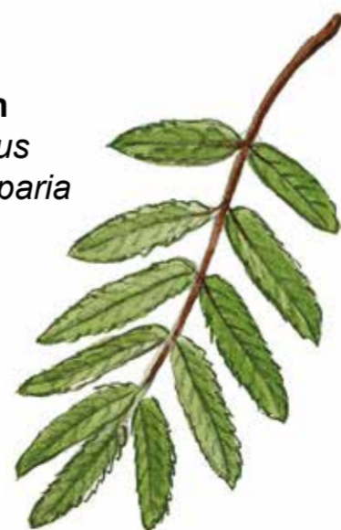
Rönn Sorbus aucuparia