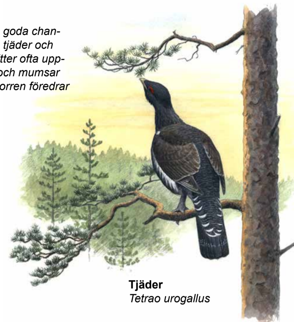
Tjäder Tetrao urogallus

På berget finns goda chanser att träffa på tjäder och orre. Tjädern sitter ofta uppflygen i en tall och mumsar tallbarr medan orren föredrar björkknoppar.