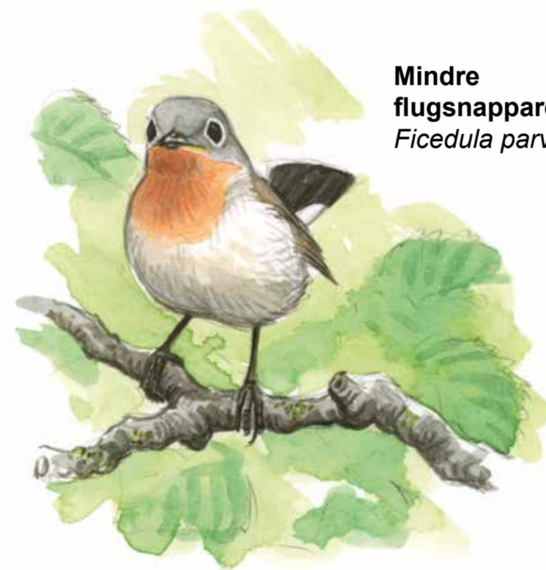
Mindre flugsnappare Ficedula parva

Brandpräglade skogar är ofta ljusöppna och luckiga med gott om ljusålskande lövträd. Men om branden uteblir tättnar skogen. Granen tar över och lövträden dukar under i kampen om ljus, näring och utrymme tills det brinner på nytt och nya lövträd kan spira.