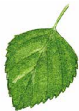
Glasbjörk Betula pubescens