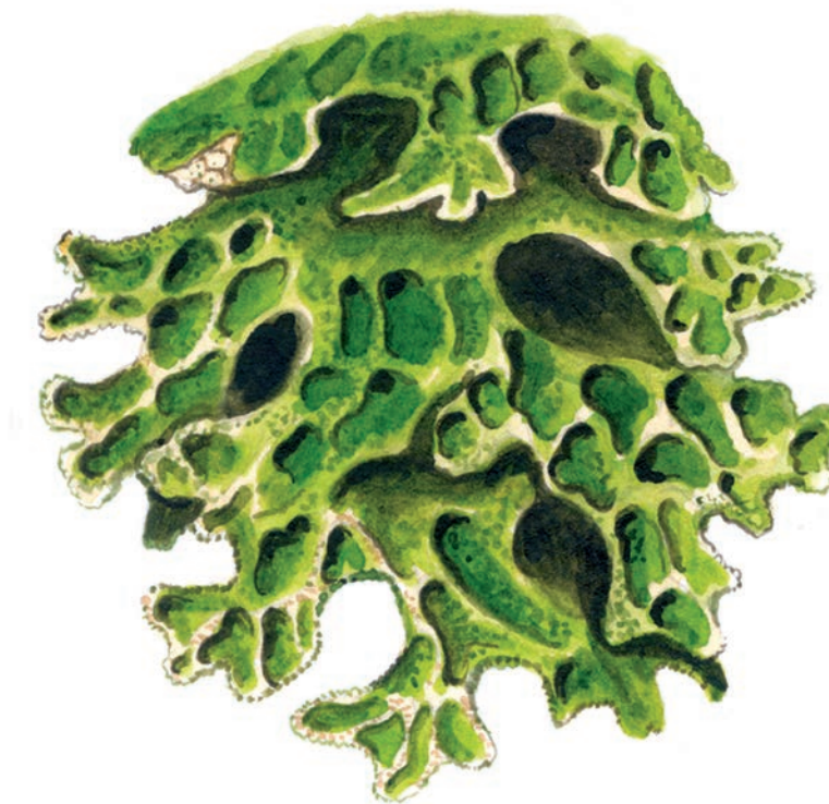
Lunglav Lobaria pulmonaria

Lunglav är en av de största lavar i Sverige. I gynnsamma lägen blir den flera decimeter i diameter. Vid regn eller hög luftfuktighet är laven vackert mörkgrön.