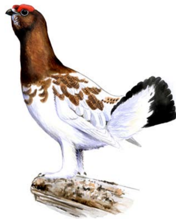
Dalripa ♂ Lagopus lagopus

Våmhuskölen skyddades år 1987 som naturreservat, Anjosvarden och Stopån år 1991. Reservaten ingår numera även i EU:s nätverk av skyddad natur, Natura 2000. Naturreservatet förvaltas av Länsstyrelsen.