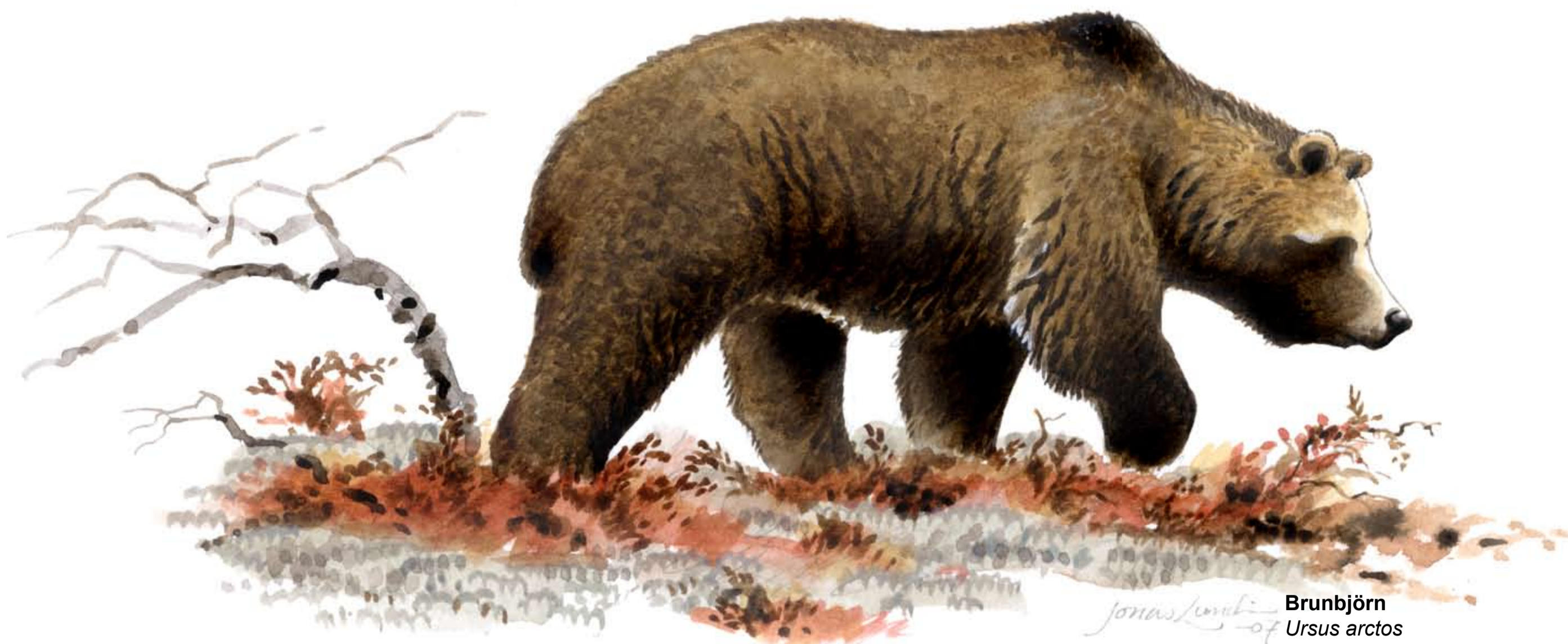
Brunbjörn Ursus arctos

Anjosvarden är krypljungens sydligaste växtplats i Sverige. Varmare klimat och avsaknad av bränder gör att fjällarter som den här har svårt att klara sig kvar.