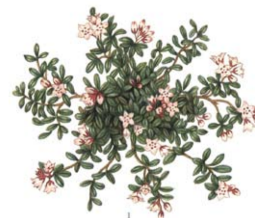
Krypljung Loiseleuria procumbens

I området finns flera sällsynta och ofta rödlistade arter bl.a. varglaven. Att en art är rödlistad betyder att dess framtida överlevnad är osäker.