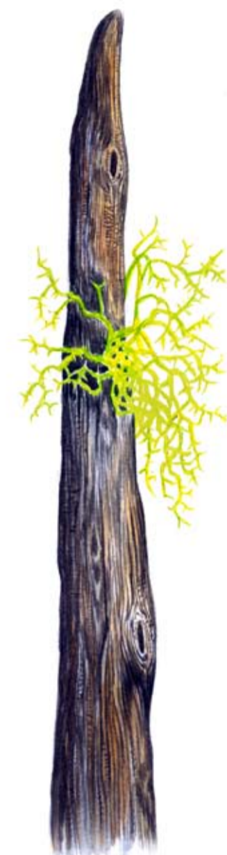
Varglav Letharia vulpina

Dalripa påträffas i den glesa, åldriga höjdlägesskogen.