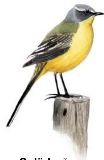
Gulärla ♂ Motacilla flava Gulärlan sjunger "tsieh" på områdets myrmarker.

De tre naturreservaten på totalt 6050 ha utgör ett vidsträckt och väglöst vildmarksområde väl värt att skydda. Här finns vackra vattenfall, åar, sjöar, myrar, gammelskog och varder. Syftet med naturreservaten är att bevara områdets orörda karaktär och skydda de arter som finns här.