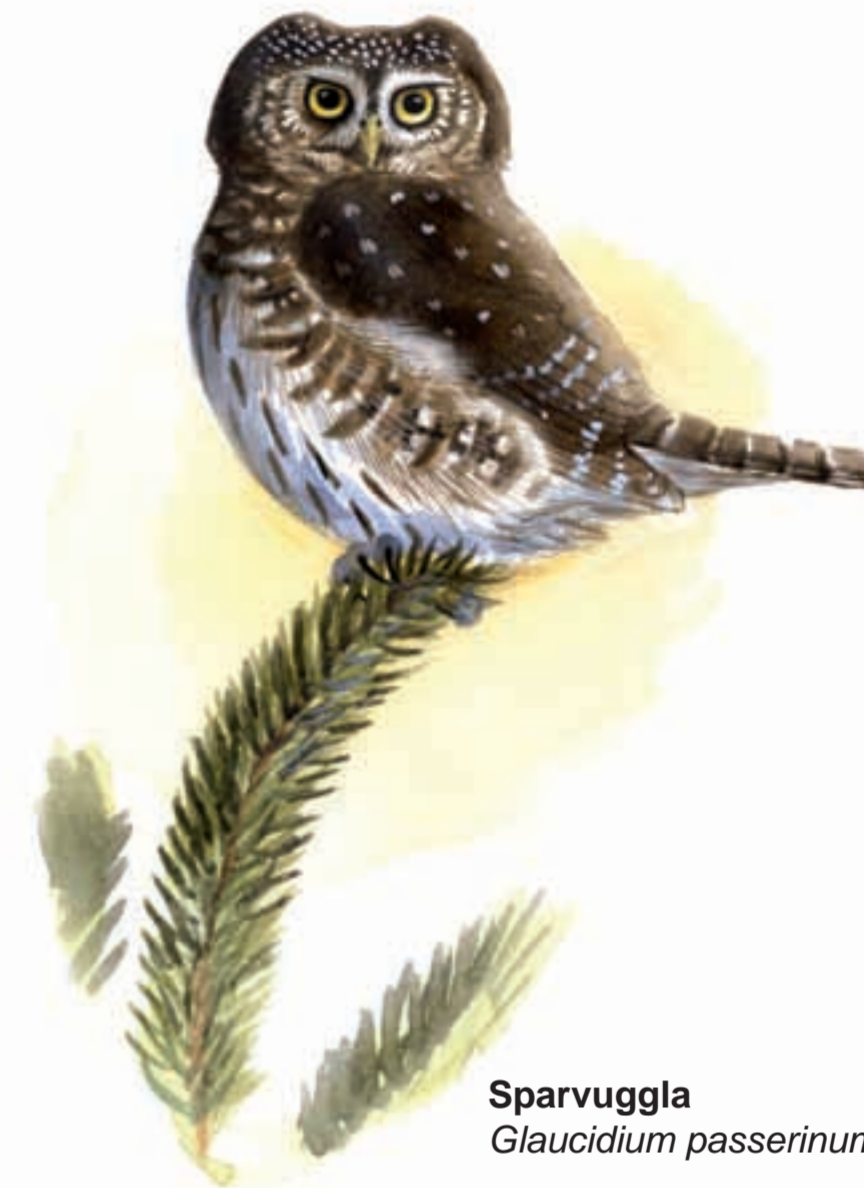
Sparvuggla Glaucidium passerinum