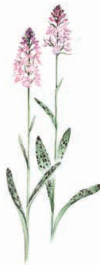
Fläckigt nyckelblomster Dactylorhiza maculata

I Vägskälet ska du spetsa öronen extra mycket. Har du tur så kan du få höra många spännande fåglar, bl.a. hackspettens vildsinta trummande. Sparvugglans mjuka visslande hör man bäst i gryning eller skymning i början på året.