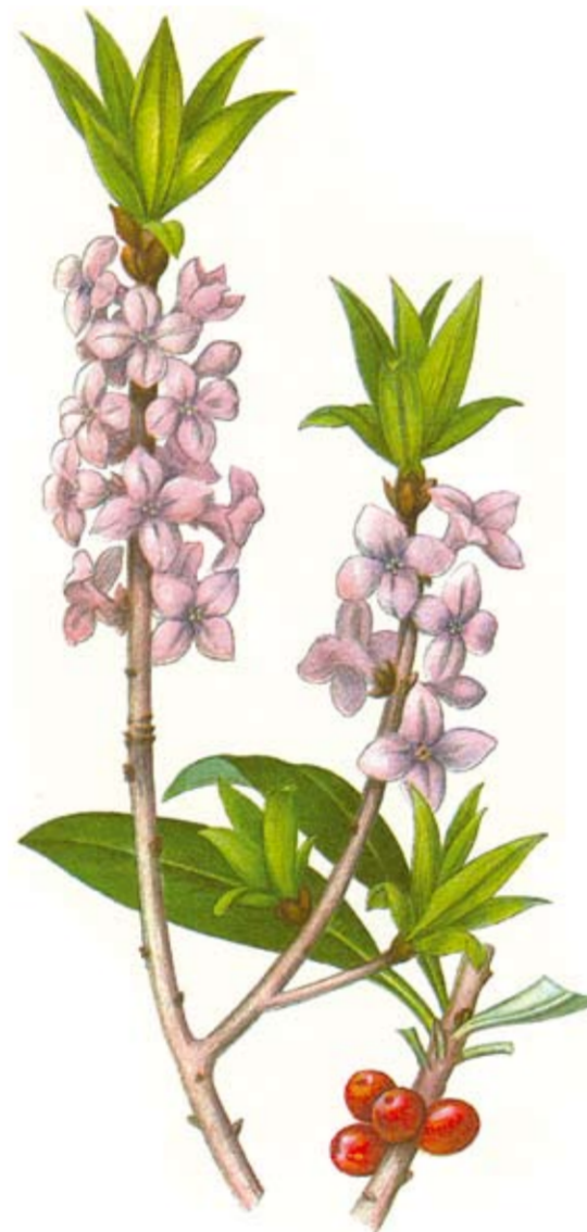
Tibast, Daphne mezereum Tibasten blommar tidigt på våren på bar kvist. Blommorna har en behaglig vaniljliknande doft. Hela växten är mycket giftig

Vid sjöns norra ände finns en badplats. Därifrån når man flera olika stigar i området.