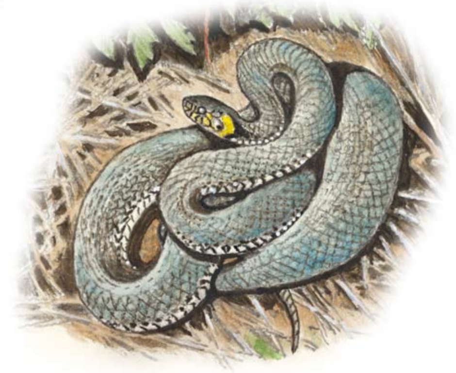
Snok, Natrix natrix

Förr var skogsduvan Sveriges vanligaste duva, men har minskat i antal p.g.a. brist på lämpliga miljöer. Fågeln föredrar skogar med gamla lövträd.