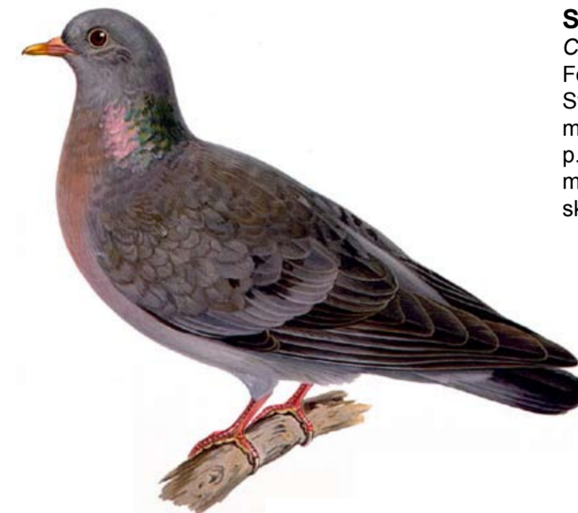
Skogsduva Columba oenas

Förr var skogsduvan Sveriges vanligaste duva, men har minskat i antal p.g.a. brist på lämpliga miljöer. Fågeln föredrar skogar med gamla lövträd.