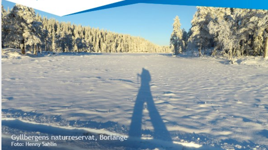
Gyllbergens naturreservat, Borlänge