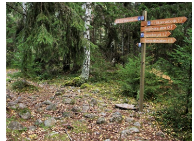
Klappersten i stigen

En relativt lättgången stig med inslag av storblockig och kuperad terräng. Du passerar den lilla vattensamlingen Galtapussen med vindskydd och grillplats. I stigen ser du här spår efter den forna strandlinjen i form av rundslipade stenar. Vid Södra utsikten (ca. 135 meter över havet) har du god utsikt över Närke-slätten, ända bort till Frövifors! Vid Yoldiaområdet sluter sig skogen tätare kring stora bergsbranter. Hittar du in i Bergakungens sal? I norr löper stigen genom öppna hållmarker med flera riktigt gamla tallar och tydliga förkastningsbranter. På din väg till och från entrén passerar du även Lilla rundan (se ovan).