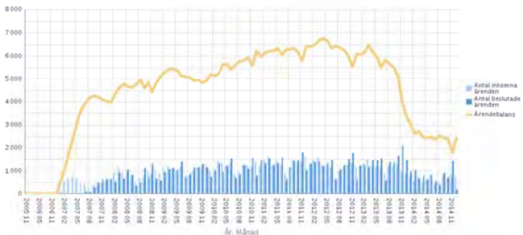
Fig. 1. Ärendebalans programperioden 2007-2014 för Uppsala län. Källa: DAWA, Jordbruksverket.

Handläggningsgruppen har under året arbetat ned en stor balans av ärenden som fanns vid årets början, se figur 1, särskilt för företagstöd. Då många äldre ärenden har slutförts under året medför det en negativ påverkan på statistiken över andelen utbetalningsärenden handlagda inom 90 dagar.