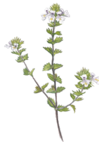
Stor ögontröst Euphrasia officinalis Large-flowered sticky eyebright