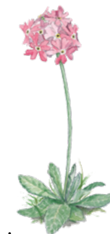
Majviva Primula farinosa Bird's eye primrose