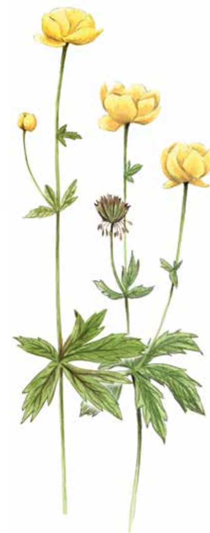
Smörbollar Trollius europaeus Globeflower