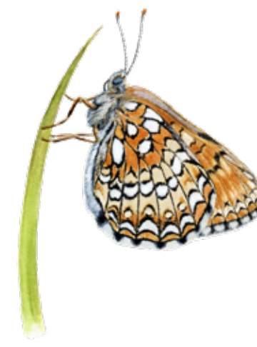
Sotnätfjäril Melitaea diamina False heath fritillary