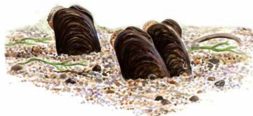
Flodpärlmussla Margaritifera margaritifera Freshwater pearl mussel

Tänk på att flodpärlmusslan är en helt fredad art. Du får därmed inte lyfta upp den ur vattnet eller flytta på den.