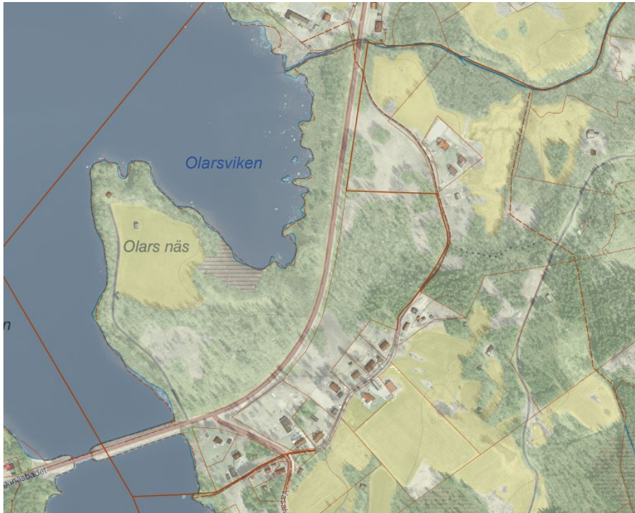
Figur 3. Topografiska kartan med underliggande ortofoto från 2020 visar att den stora åkern på uddens norra del har fortsatt att brukas under årens lopp. Av övriga tidigare slätter-, betes- och åkermarker märks endast en större sammanhängande yta idag (ljusare ytan söder om åkerytan). Den har framträtt tydligare efter att bete i området har återupptagits och utförd gallring. Fler och mindre rester från tidigare brukade ytor framträder på plats.

Enligt SMHI:s rapport Sänkta och torrlagda sjöar (1995) sänktes Svärdsjöns vattenyta 1844, vilket innebar att näsets yta blev större. Till exempel innebar det att ytan med strandäng vid Olarsviken ökade och under 1930-talet ersattes byvägen genom Vasalund (öster om Olars näs) med väg 850 som utgör reservatets östra gräns, på delar av den nybildade marken efter avsänkningen.