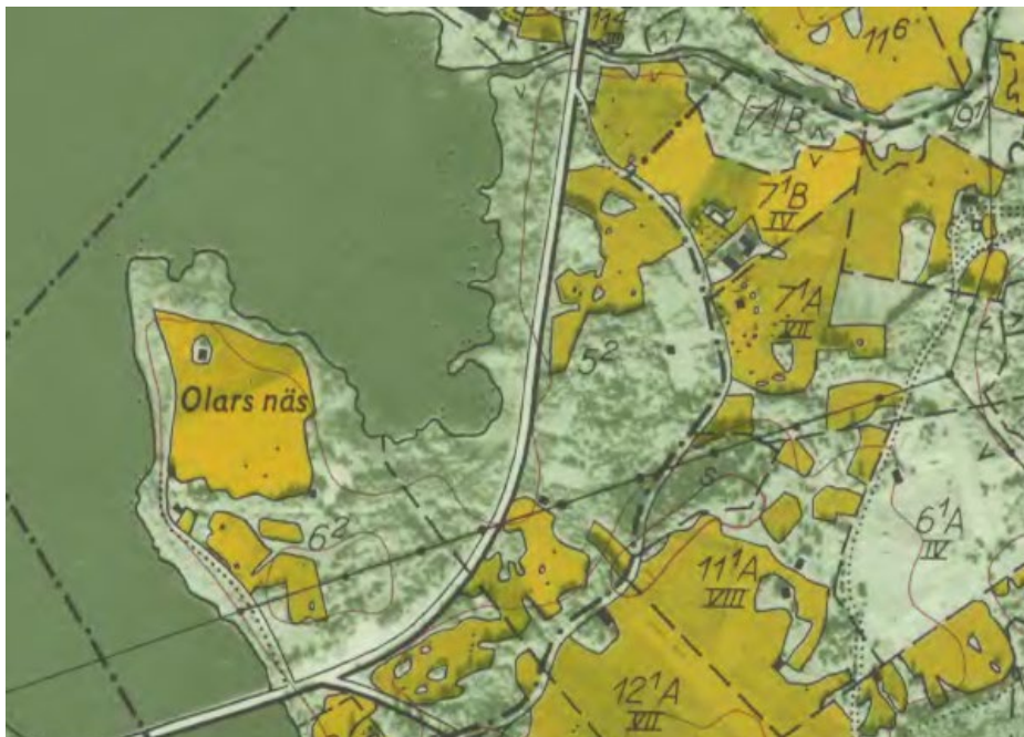
Figur 2. Den ekonomiska kartan från 1967 visar att de brukade markerna minskat betydligt och att de flesta av ladorna försvunnit jämfört med 1800-talets karta.