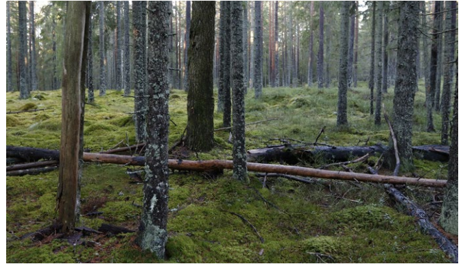
Asp med aspegelälv i Björkbergsbacken.

Skogen i reservaten kommer till stora delar att få utvecklas fritt till en naturskog. En gammal skog som får sköta sig själv rymmer en stor variation. Gamla och unga träd blandas med döende och multnande träd. Vilket i sin tur skapar öppna och slutna miljöer om vart annat. Den döda och döende veden lockar till sig många olika arter. De liggande döda träden (lågor) och stående torrträden är mycket viktiga för många av skogens sällsynta och hotade växt- och djurarter. Här finns exempelvis sällsynta svampar som ullticka, vedticka, tallticka, och rävticka. Liksom lavrariteter som aspegelav lunglav, kattfotslav och gammelgranslav. En rad olika insekter är beroende av död ved, många skalbaggar spenderar sitt larvstadium inuti döda trädstammar.