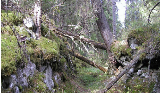
Ingång till dagbrott i Limberget.

Naturreservaten Björkbergsbacken och Limberget utgörs av en nord-sydlig bergrygg med en brant västerslutning. Här växer en variationsrik gammelskog med många sällsynta arter.