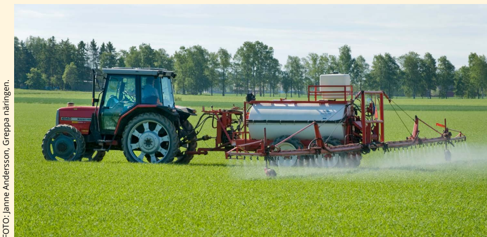
Gröppa näringen.