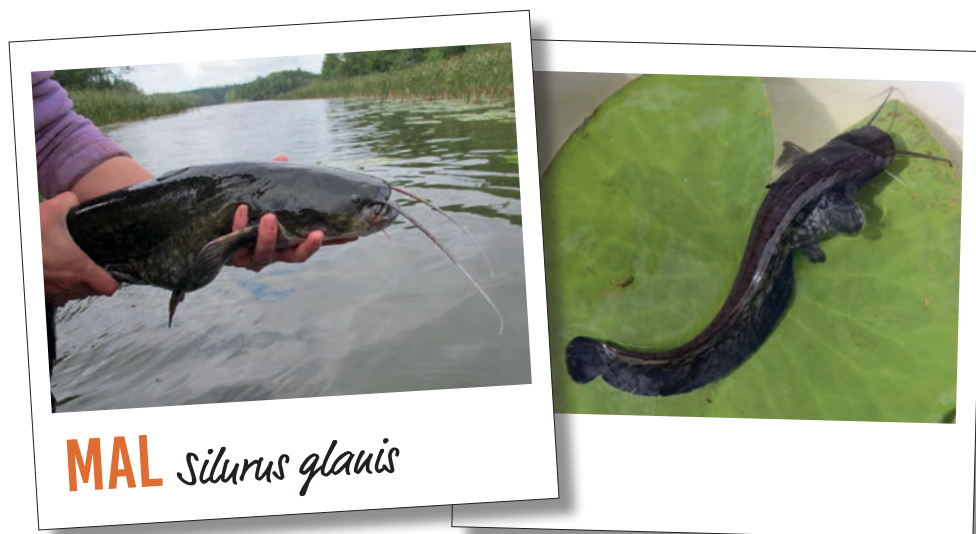
MAL Silurus glanis

med stjärten så att äggen kan fästa vid rötterna. Parningen kan pågå i flera timmar. Hanen stannar kvar och viftar syrerikt vatten över äggen tills de kläckts. För att ynglen ska överleva och växa behöver vattnet vara varmt, helst över 22 grader. Det betyder att malens yngel inte överlever alla år.