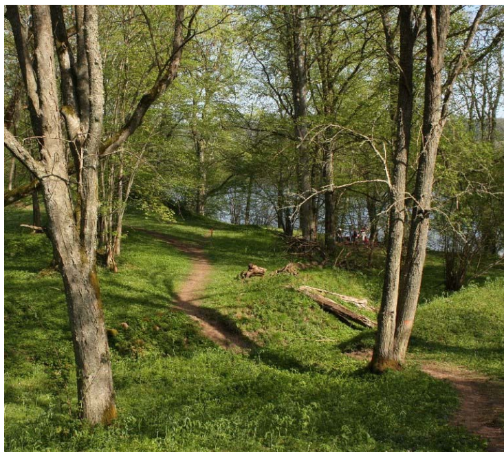
Vackert promenadstråk.

Eahagen-Öglunda ängar är ett underbart vackert strövområde. Följ gärna en av de många stigar som går genom naturreservatets beteshagar och lövskogar. Vid Flämslätt finns en badplats med bryggor.