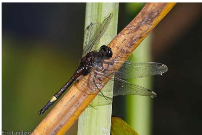
Citronfläckad kärrtrollslända, en fridlyst art som har observerats i reservatet.

Naturen i Vallebygden är starkt präglad av människan. Jordbruk började bedrivas här för mer än 5 000 år sedan. I reservatsområdet finns spår i form av äldre odlingsrösen, husgrunder, åkerterrasser samt gravar från järnåldern och framåt. Stora delar av reservatet har en gång brukats som åker, äng eller betesmark. Många äldre lövträd bär på spår efter hamling, d.v.s. lövtäkt för att få vinterfoder till djuren. I naturbetesmarkerna finns en flora som gynnas av att markerna hålls öppna av betande djur. Här kan du hitta brudbröd, gullviva, gökärt och liten blåklocka.