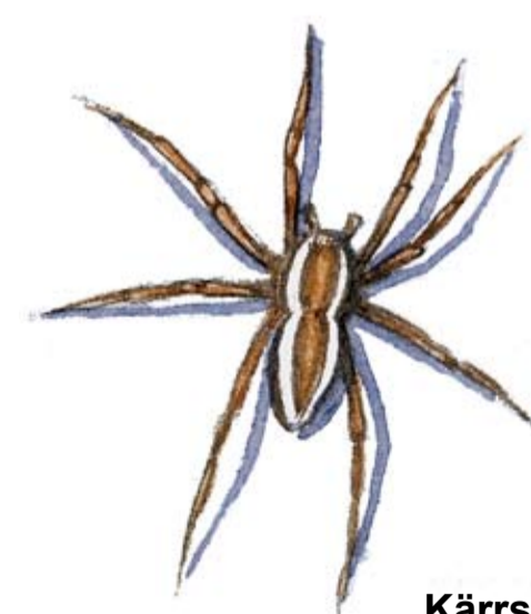
Kärrspindel Dolomedes fimbriatus

Observera att vissa skidleder inte är spårade varje år. Sommartid rekommenderas vandringslederna eftersom de är spångade över våtmarkerna.