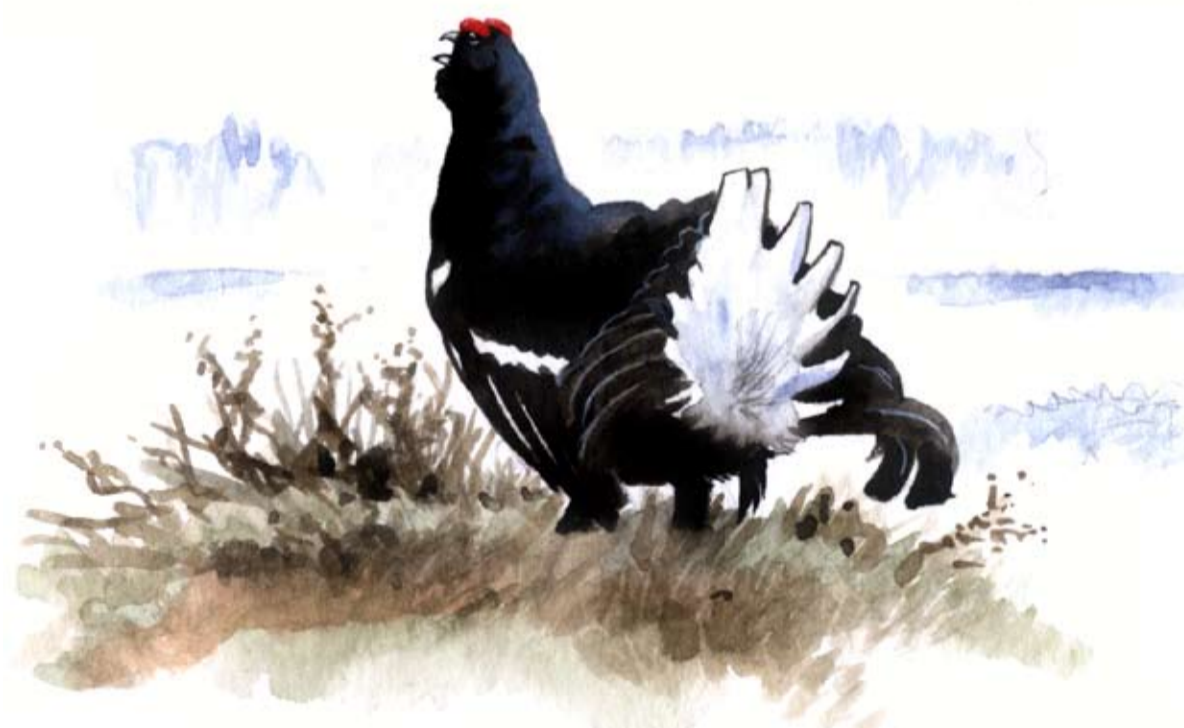
Orrtupp Tetrao tetrix

År 1983 avsattes 1000 ha mark till naturreservat, med delad finansiering mellan Borlänge kommun och staten. Under år 2007 utökades naturreservatet till 1706 ha. Syftet med reservatet är att skydda skogarna, myrarna, floran och faunan samtidigt som friluftslivet främjas. Naturreservatet förvaltas av Länsstyrelsen tillsammans med Borlänge kommun som sköter friluftsanläggningarna.