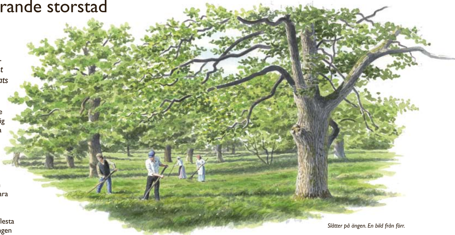
Slätter på ängen. En bild från förr.