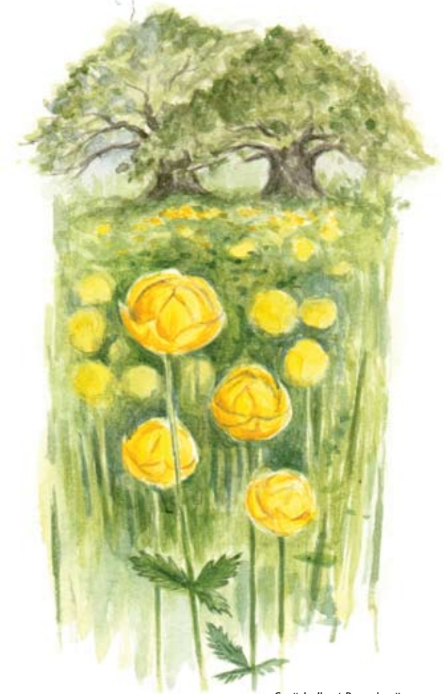
Smörbollar i Brunsbo äng.

PRODUKTION Länsstyrelsen i Västra Götalands län 2009 | TEXT Jan Mogel ILLUSTRATIONER Niklas Johansson och Göran Boström | LAYOUT Tone Lund