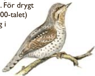
Göktytan trivs vid Brunsbo.

Vi vill inte på något vis förstöra din dag med dystra besked, men vill ändå påminna om att det gamla svenska landskapet – som många av oss matats med i Astrid Lindgrens böcker om Emil i Lönneberga och Barnen i Bullerbyn – är på väg att försvinna. Kanske för gott.