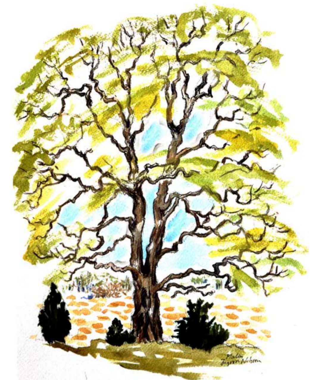
Det öppna landskapet i Fullsta inbjuder till trevliga promenader. Här finns en hel del gamla ekar och aspar som är hem åt många intressanta växt- och djurarter.