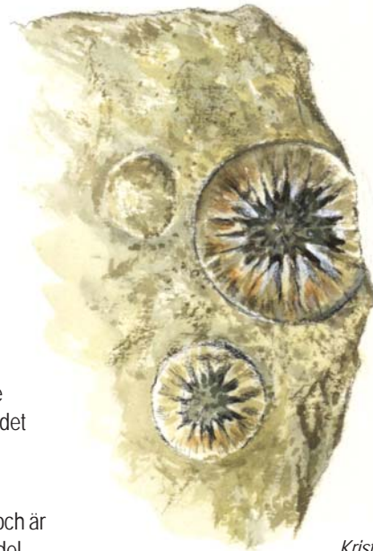
Kristalläpplena är fossil efter en grupp tagghudingar, inuti kroppshålan har kalcit bildat vackra kristaller.

I kalkstenen finner man också ett nästan runt litet fossil som Linné benämnde "kristalläpplen". Fossiliet representerar en utdöd grupp tagghudingar, dvs den är en avlägsen släkting till våra nutida sjöborrar. På trasiga exemplar kan man ofta se att hålrummet inuti fossiliet, dvs det som en gång var djurets kroppshåla, är mer eller mindre fyllt med små glittrande kalcitkristaller. Utöver dessa finner man naturligtvis också andra fossilgrupper. Fossila snäckor, musslor och armfotingar är inte helt ovanliga och inte heller spåren av små, kolonibildande havsdjur, graptoliter.