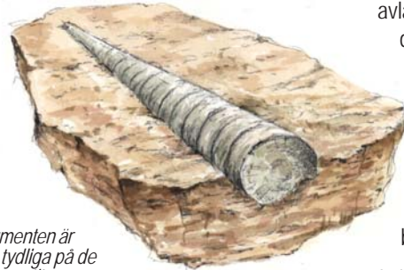
Segmenten är ofta tydliga på de ortoceratiter man hittar på Öland.