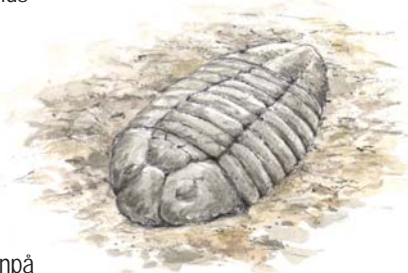
Det är sällan man hittar skalresterna efter en hel trilobit, däremot finns det gott om skalfragment i den öländska kalkstenen.

Så här ser en schematisk genomskärningsbild av Ölands berggrund ut.