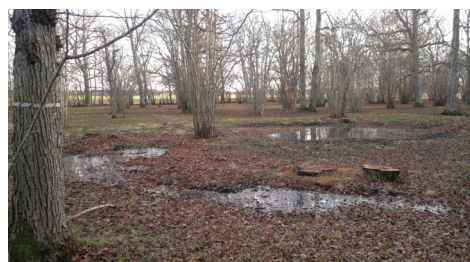
Nedtagna sjuka almar i Allekvie samt inventerad alm.