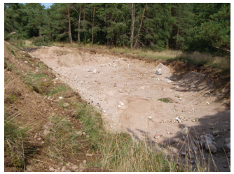
Husbehovstäkt – för att få ta grus till husbehov måste en anmälan för samråd göras.