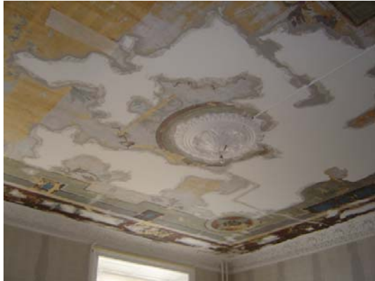
Tak mot sydväst