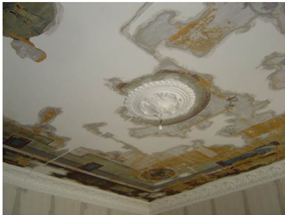
Tak mot nordost