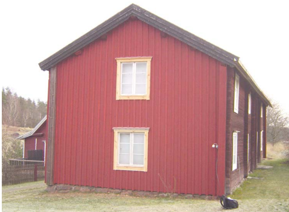
Bilden visar norra bostadslängans nordvästra gavel efter panelningen. Antikvarisk kontroll