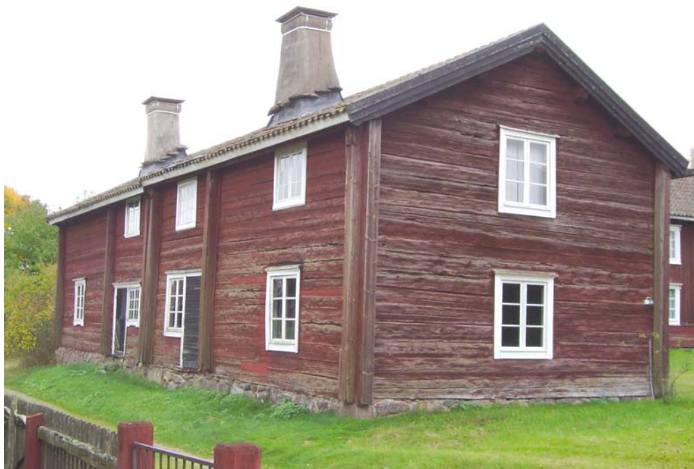
Bilden visar norra bostadslängans nordvästra gavel före panelningen.

Länsstyrelsen anser att den utförda och kompletteringen med fasadpanel på byggnadsminnet är väl motiverade för att interiördetaljerna skall bevaras till kommande generationer.