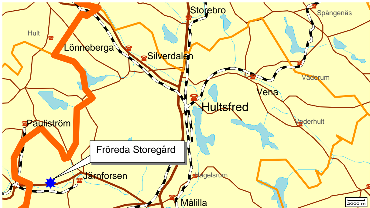
Norra halvan av Hultsfreds kommun