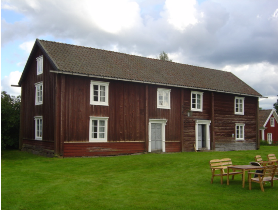
Bilden visar södra bostadslängan.

Vid färgundersökning av södra längans dörrblad hittades inga spår av äldre färgsättningar. Länsstyrelsen ansåg därmed att Hembygdsföreningens önskemål kunde bifallas, tillstånd om ändring av färgsättning krävdes därmed inte heller.