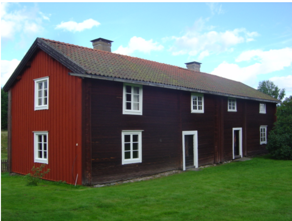
Bilden visar norra bostadslängan.