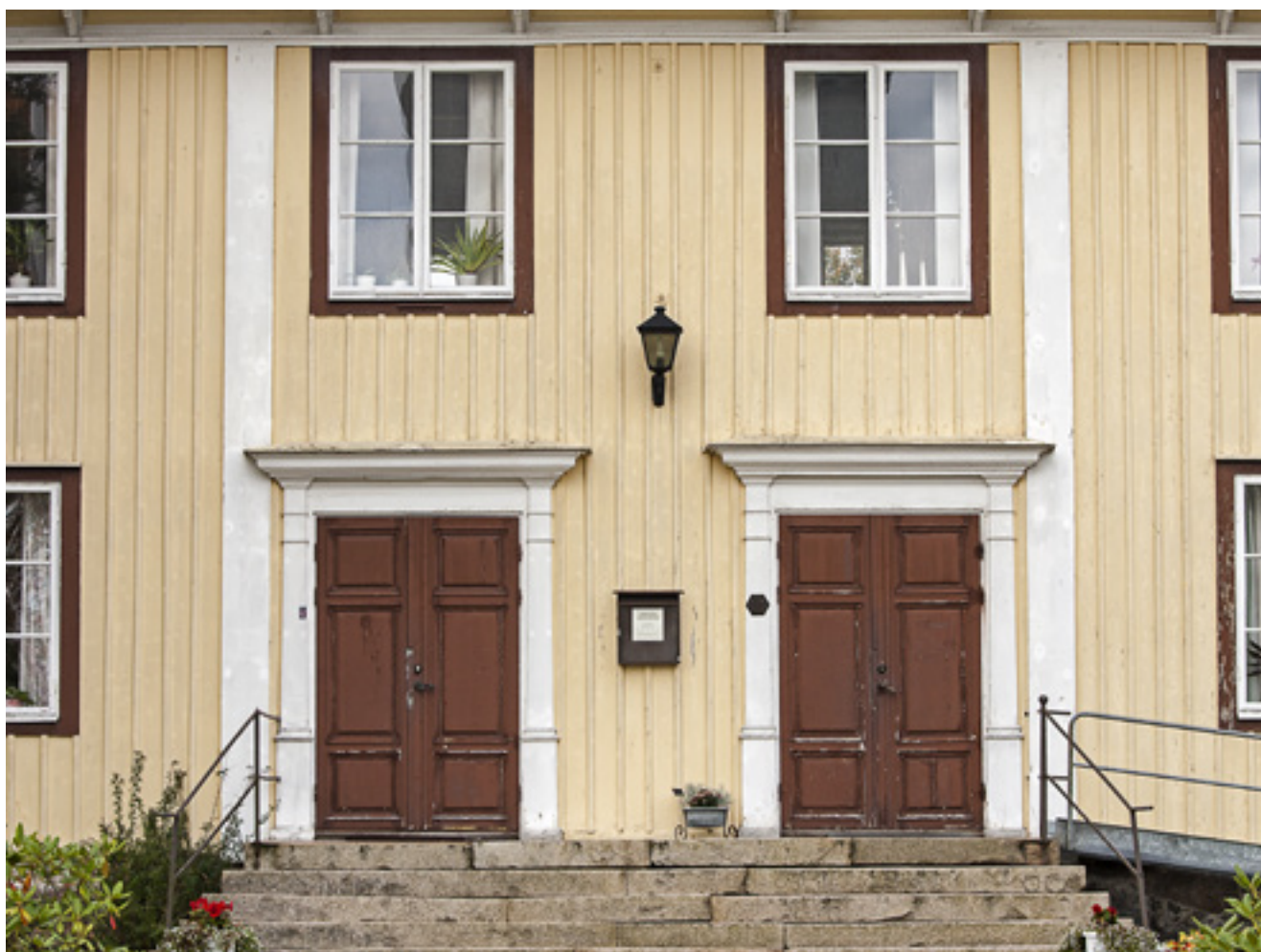
Sockenstugan byggdes 1864 och det sägs att två stora oxar från Lessebo fick dra stentrappen på plats när den skulle anläggas.