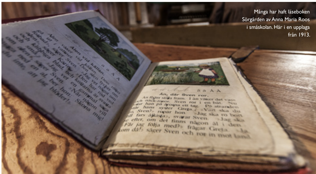
Många har haft läseboken Sörgården av Anna Maria Roos i småskolan. Här i en upplaga från 1913.