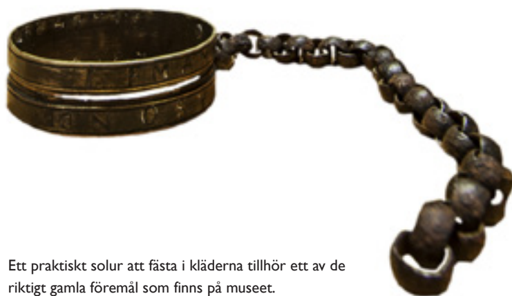
Ett praktiskt solur att fästa i kläderna tillhör ett av de riktigt gamla föremål som finns på museet.