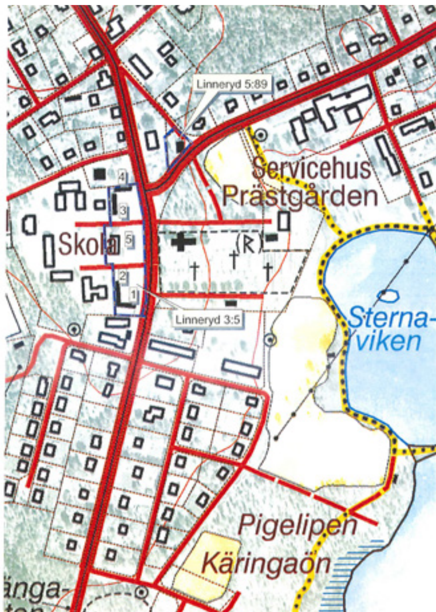
Karta till byggnadsminnesförklaring av Linneryds kyrkstallar och sockenstuga på fastigheten Linneryd 3:5, Linneryds socken, Tingsryds kommun Dnr 432-9205-02 - Beslut 2008-05-15