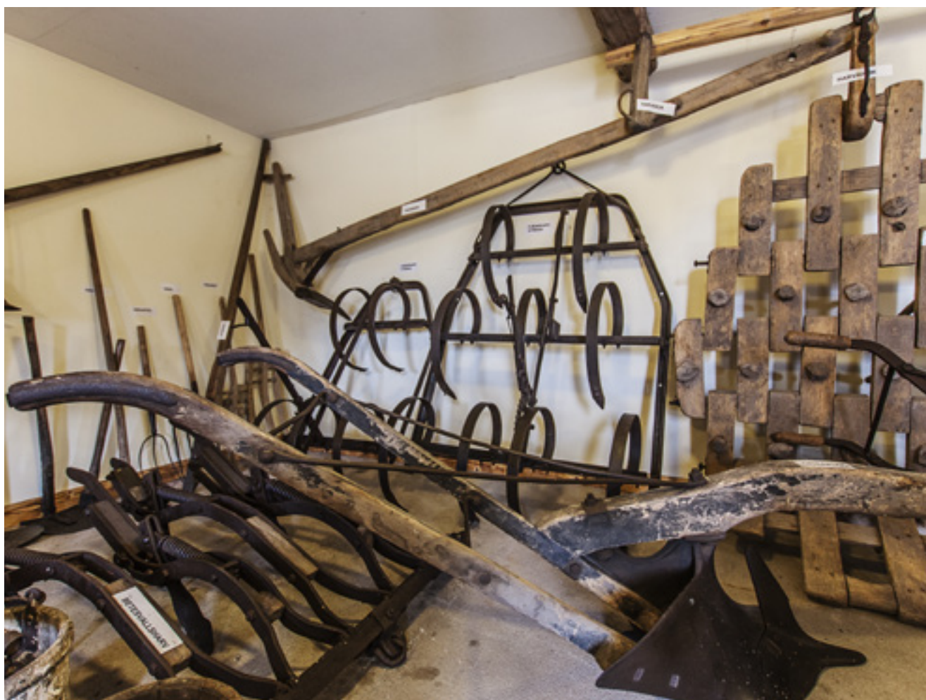
Äldre redskap och verktyg som använts av bönderna i Linneryd.