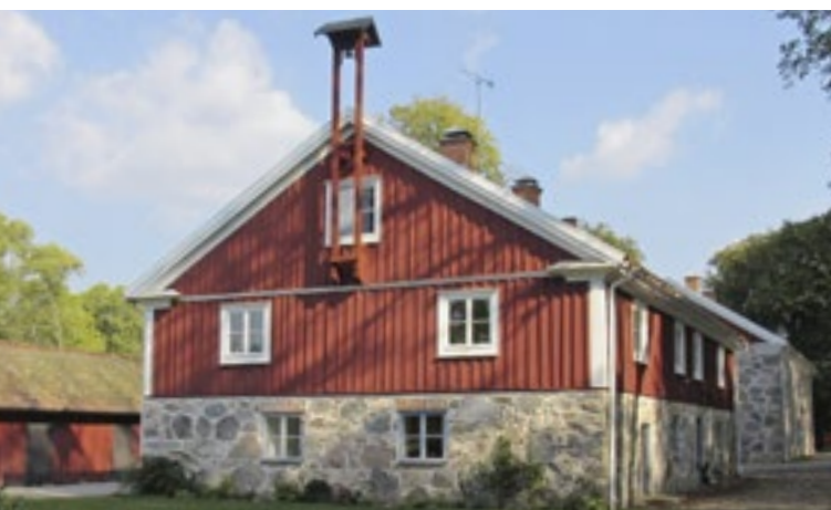
På dagsverksstugans gavel sitter ännu vällingklockan kvar.