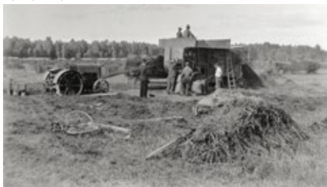
Tröskverket i full gång ute på vetefälte, hösten 1932.