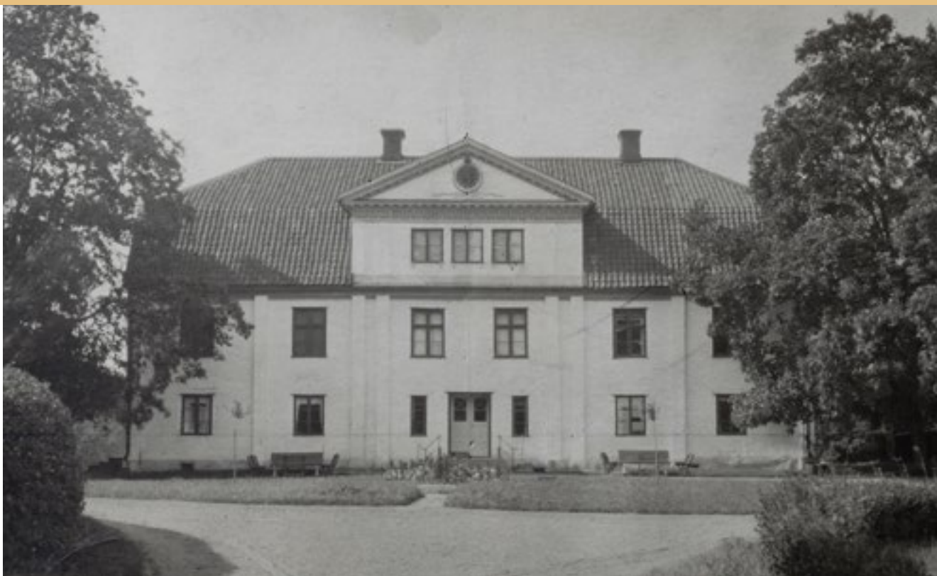
Lidhems corps de logi 1917, fotograferat efter att verandan tagits bort.

klassicerande stil, som tydligt markerade husets mittparti och entré. Den kompletterades med en enklare förstukvist: