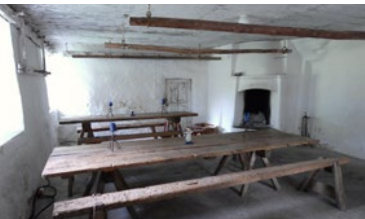
Stugan där arbetarna samlades och åt sina medhavda måltider är bevarad.

bryggshus och två höns hus. Uppe under det spåntäckta taket fanns torkvind.