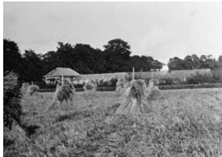
Växthusanläggningen bakom mangårdsbyggnaden, 1 september 1931.