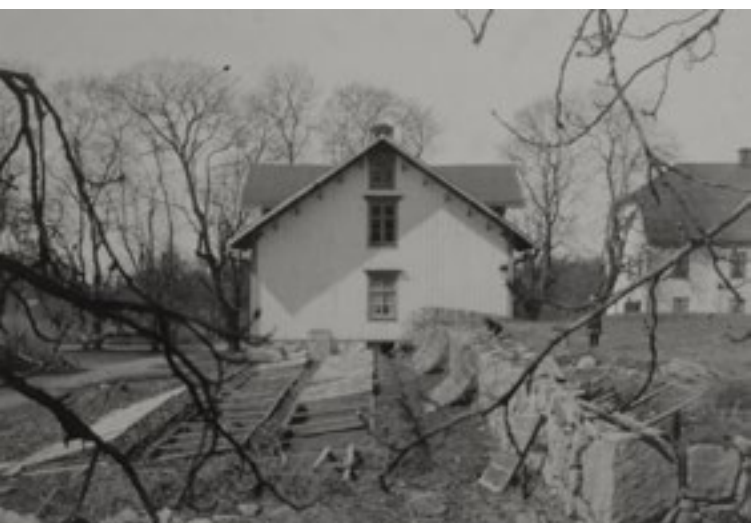
Södra flygeln, där trädgårdsmästaren bodde, sedd från öster år 1930.

gångar med deri inredde kontor . Andra våningen inreddes med en lägenhet om två rum och på varje gavel ett rum och två kontor. I köket fanns bakugn och köksspis, och i de övriga rummen kakelugnar och kaminer.