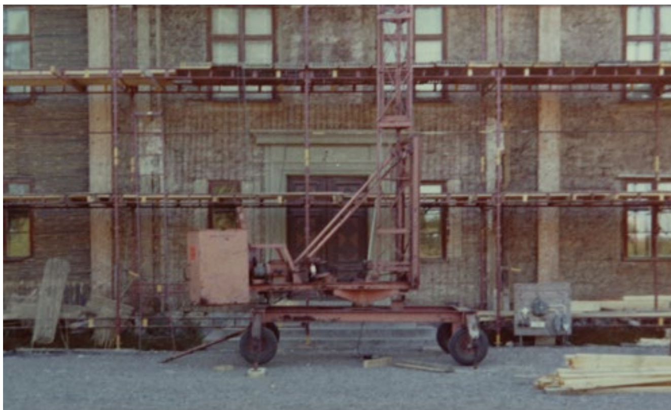
Sommaren 1974 knäckades mangårdsfasadens puts ner och ersattes med ny.

placerades symmetriskt i förhållande till de tidigare.