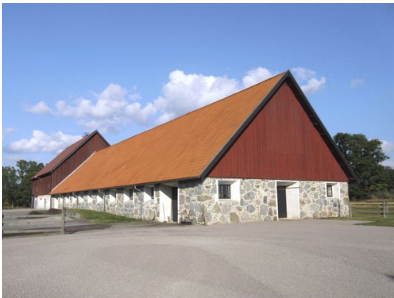
Stenladugården, med 1940-talets tillbyggnad i bortre änden.