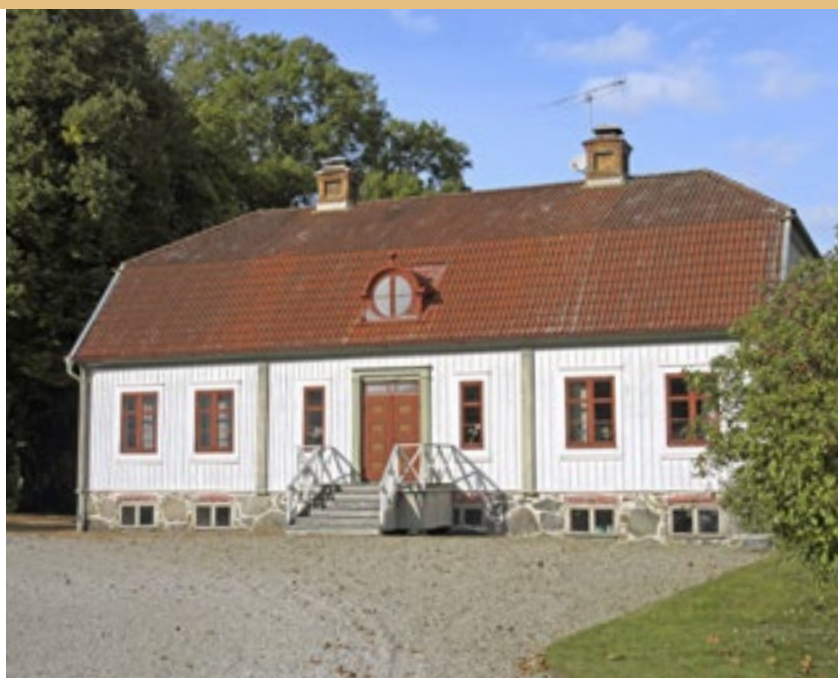
Norra flygeln.

Till vänster: Den södra flygeln var trädgårdsmästarens bostad.