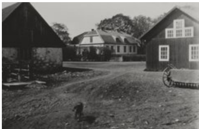
På 1930-talet var vagnslidret rödfärgat med vitmålade snickerier.