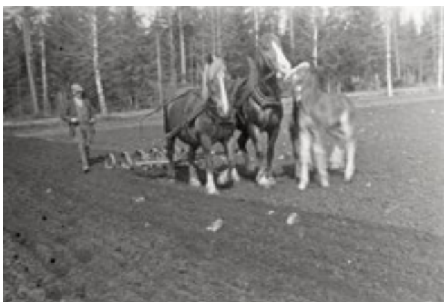
Vårbruk på Madträdan 1932.

Idag kan man mitt inne i skogen ännu hitta rester av stenvägg som tidigare hägnade in åkrar och betesmarker i ett tidigare öppet landskap.