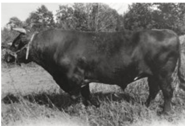
Avelstjuren Igelsta Hero 87, fotograferad 1928.

I början av 1990-talet introducerades istället en helt ny näringsgren när markerna österut, mellan gården och den nedlagda järnvägen, arrenderades ut till en 18-håls golfbana. En klubbstuga och restaurang uppfördes också i områdets norra del. Verksamheten drevs fram till 2008 och när den lades ner återgick markerna till säteriet och omvandlades till skog och åker. Byggnaderna revs och det finns idag knappt några synliga spår efter golfbanan. Men det var inte första gången Lidhems ägare provat att gå utanför lantbrukets ramar. Någon gång under slutet av 1800-talet startades en brunnsverksamhet vid den kvarn som tillhörde gården. Platsen invid Lidhemssjöns nordöstra strand kallades Paradiset och lockade under ett tiotal år välbeställda storstadsbor att komma dit och dricka brunn.