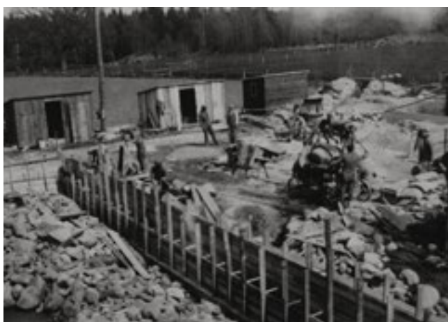
Ladugårdens foderlada uppförs, sommaren 1943.