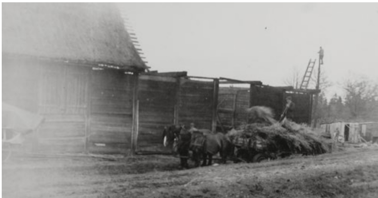
Under 1900-talets första hälft försvann de sista halmtaken och ersattes med tegelpannor. Här vid ombyggnad av logbyggnaden 1943.

Norr om tröskklogen fanns tidigare gårdens sågverk och ytterligare ekonomibygnader, alla nu rivna.