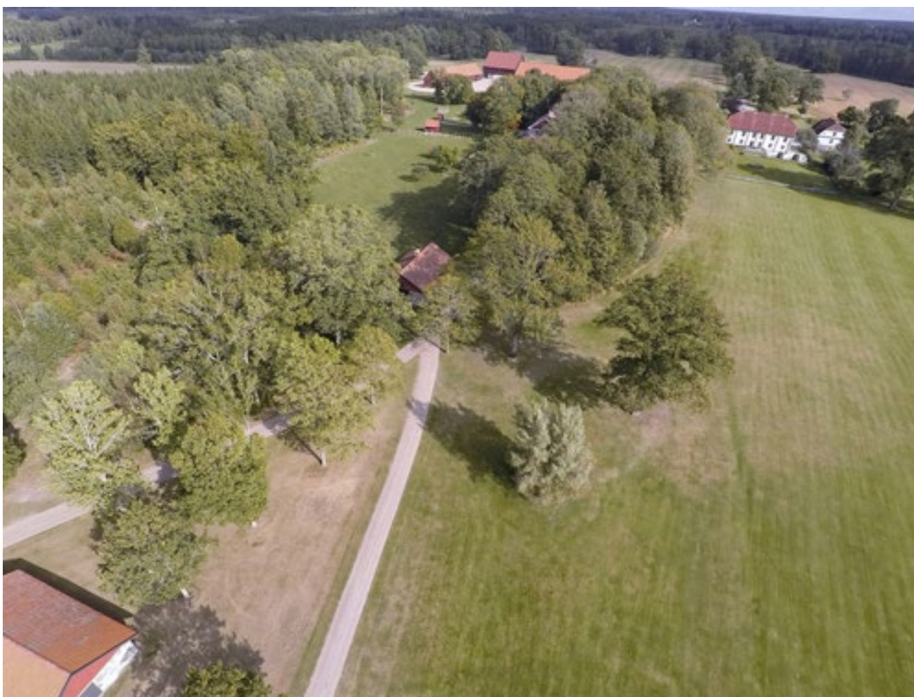
Det f d svinhuset, i förgrunden, är den byggnad inom byggnadsminnet som står längst bort från mangården.