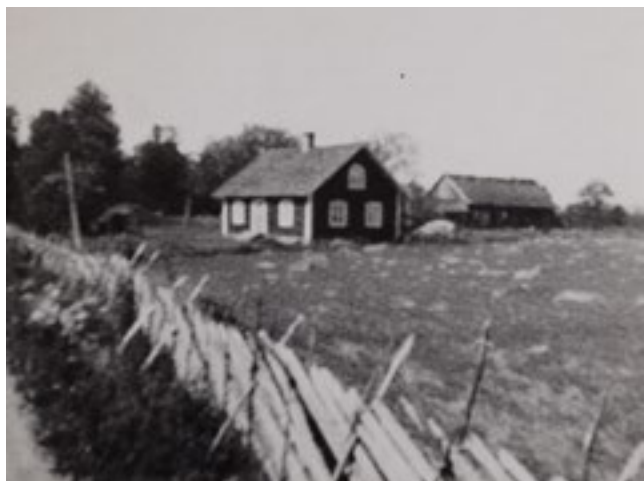
Stora Björsatorpet, fotograferat 1927.

Det är idag svårt att föreställa sig det liv och den rörelse som förr rådde på Lidhem. Ett stort antal personer skötte olika sysslor och mellan husen hördes ljuden av prat, skratt, hovar och vagnshjul. Kanske en och annan svordom och ett svagt bankande från den avlägsnet belägna smedjan. Många kvinnor och män rörde sig under dygnets ljusa timmar mellan byggnaderna och ute på åkrarna. Både djurhållning och jordbruk krävde stora och välorganiserade arbetsstyrkor, men också skötseln av hushållsträdgård och park intill mangården. Varje morgon kom de gående från sina hem på olika håll och samlades vid dagsverksstugan för att få dagens uppgifter fördelade mellan sig. En del var anställda statare som bodde i gårdens arbetarbostäder, men flertalet kom från de omgivande skogsmarkerna. De var torpare och arrendatorer som betalade