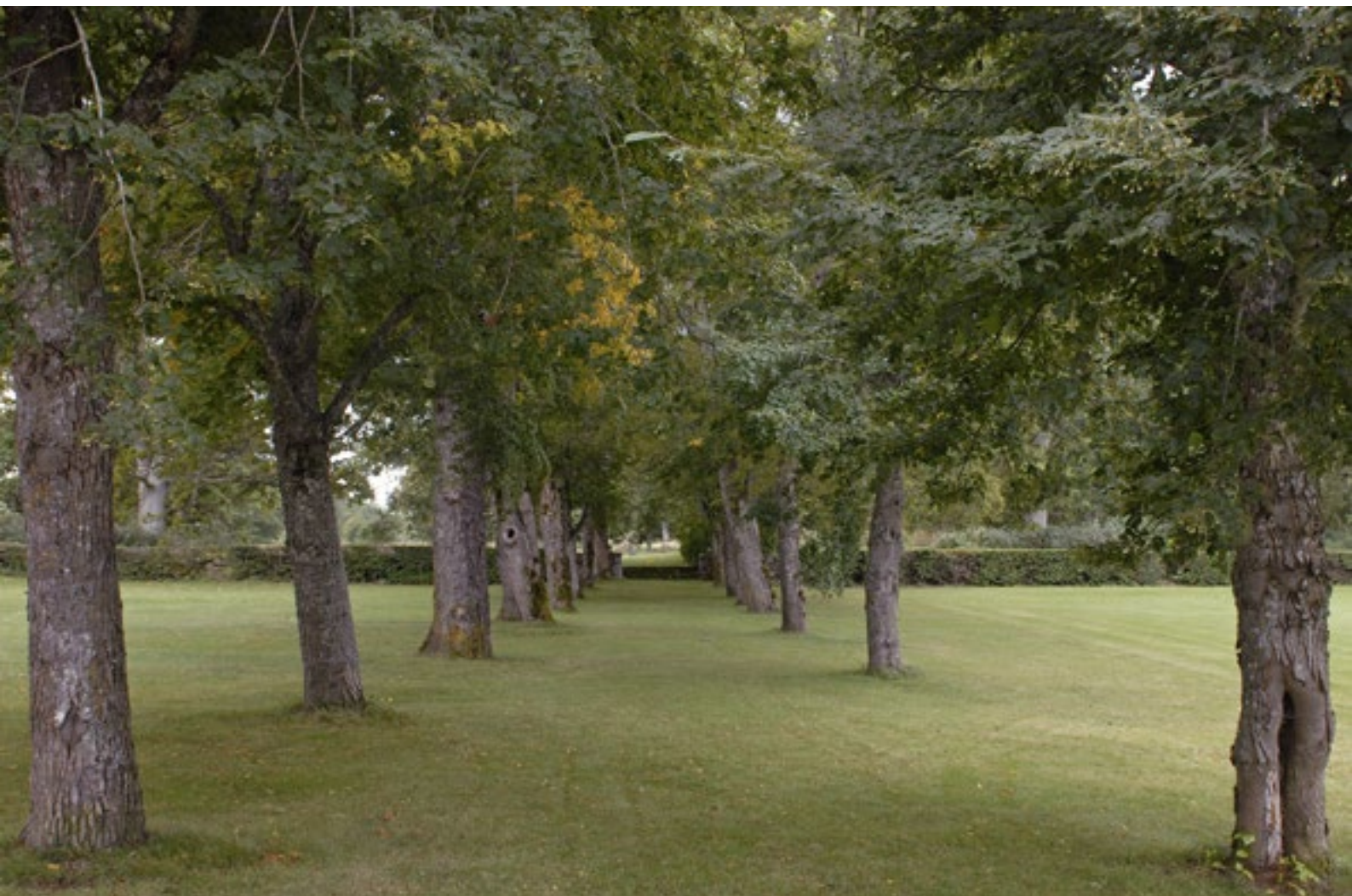
Parkens träd visar var de större grusgångarna tidigare gick.