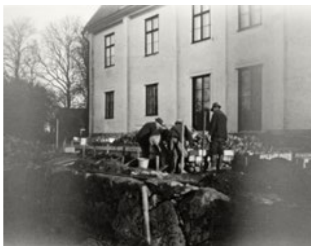
Arbete med terrassen närmast mangården, i november 1934.

I början av 1930-talet lät dåvarande ägaren Abraham Leijonhufvud göra stora nysatsningar. Då utfördes nyplanteringar i fruktträdgården, odlingarna utökades och längre ner mot sjön byggdes två stora växthus. Handelsträdgården som växte fram sysselsatte ett flertal personer och bidrog med sin försäljning till gårdens inkomster. Samtidigt togs odlingar och