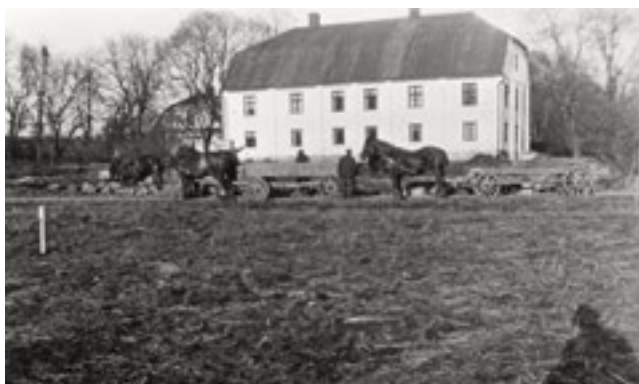
Under våren 1932 pågick arbetet med trädgårdens terrasser.