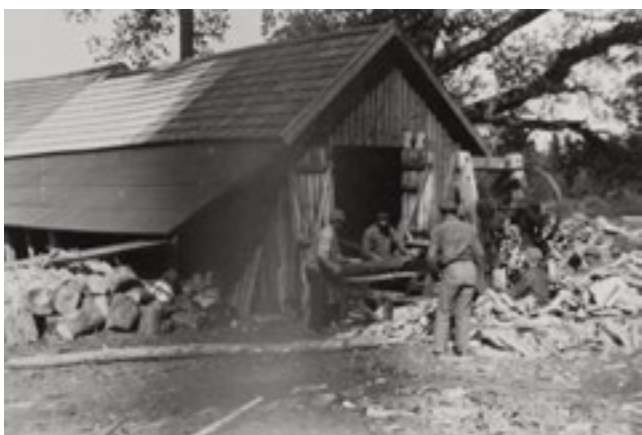
Vedkapning och klyvning kring midsommar 1935. Det gick åt mycket ved för att värma mangård och andra byggnader.

Arrende-betalningen var 3 dagsverken i veckan, samtliga veckor under året.