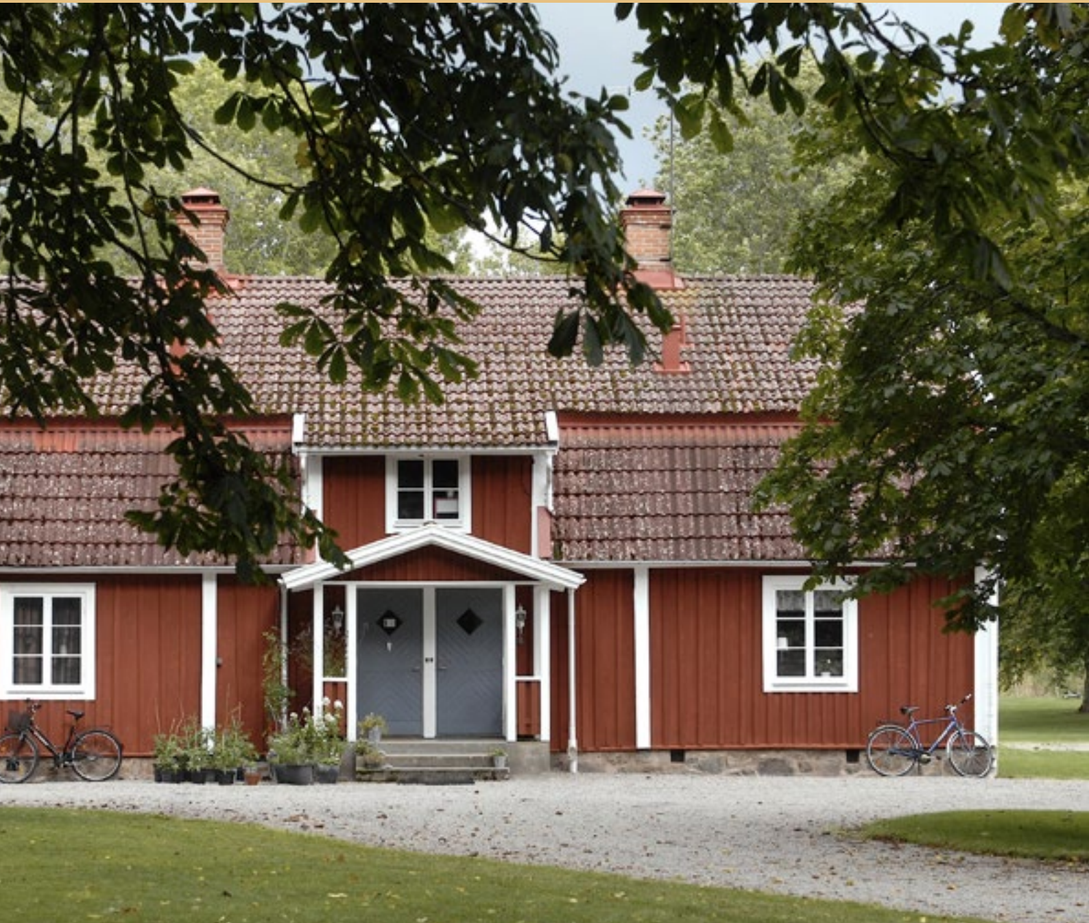
Kuskbostaden var tidigare hem åt gårdens inspektör.