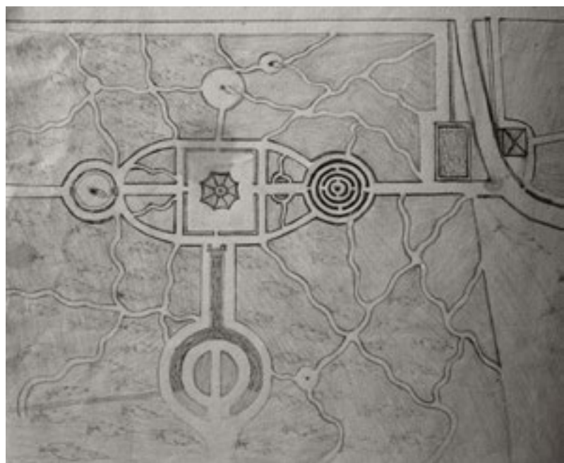
Skiss från 1850-talet över parken sydost om mangården.

Under 1800-talets senare del var exotiska växter på