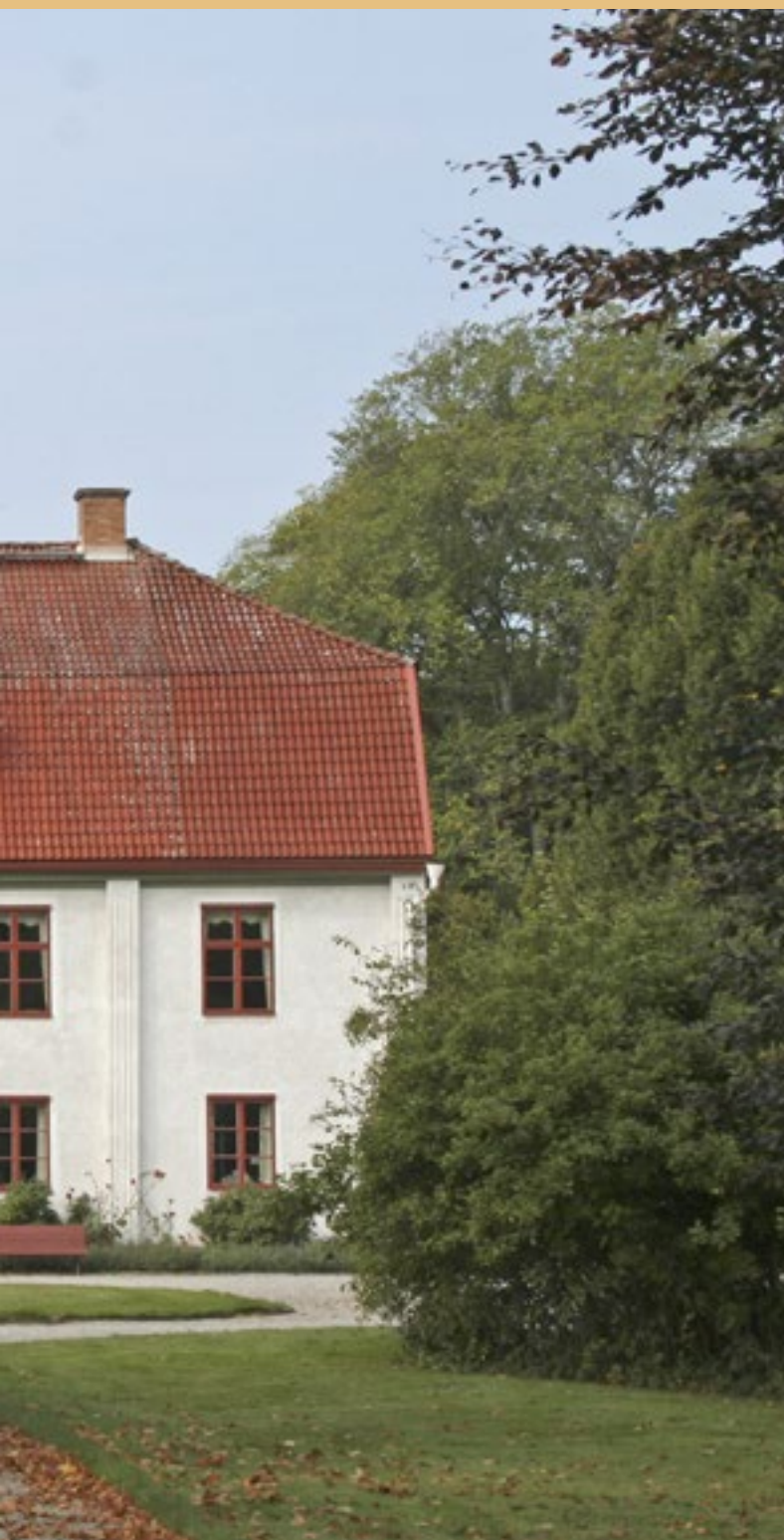
Lidhems corps de logi.

kammarspisar och en stor bakugn. De två byggnaderna verkar ha förblivit relativt oförändrade fram till de revs år 1867.