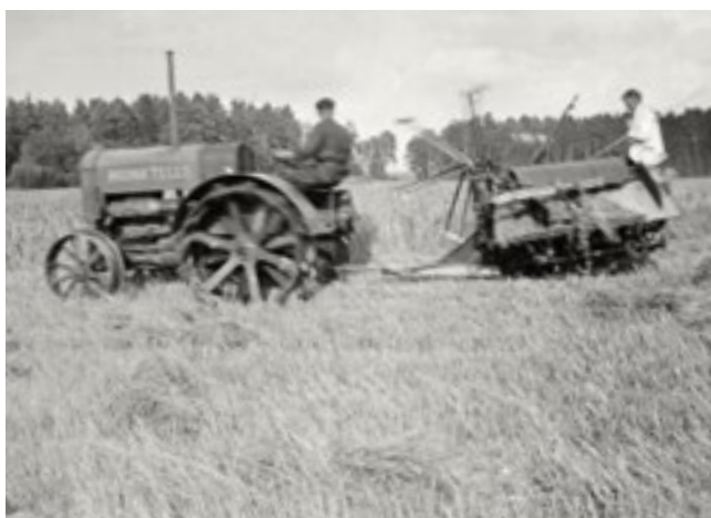
Skördearbete med traktor, hösten 1932.

lan. Många av de torp som gårdens arbetskraft var bosatta i revs under 1900-talet. Samtidigt som lantbruket avvecklades introducerades också nya näringsgrenar.