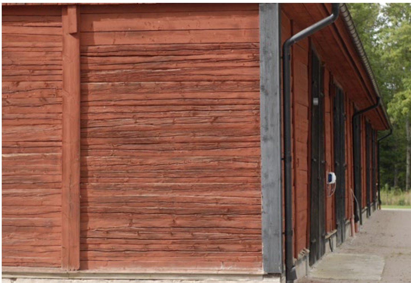
Logbyggnadens skiftesverk.