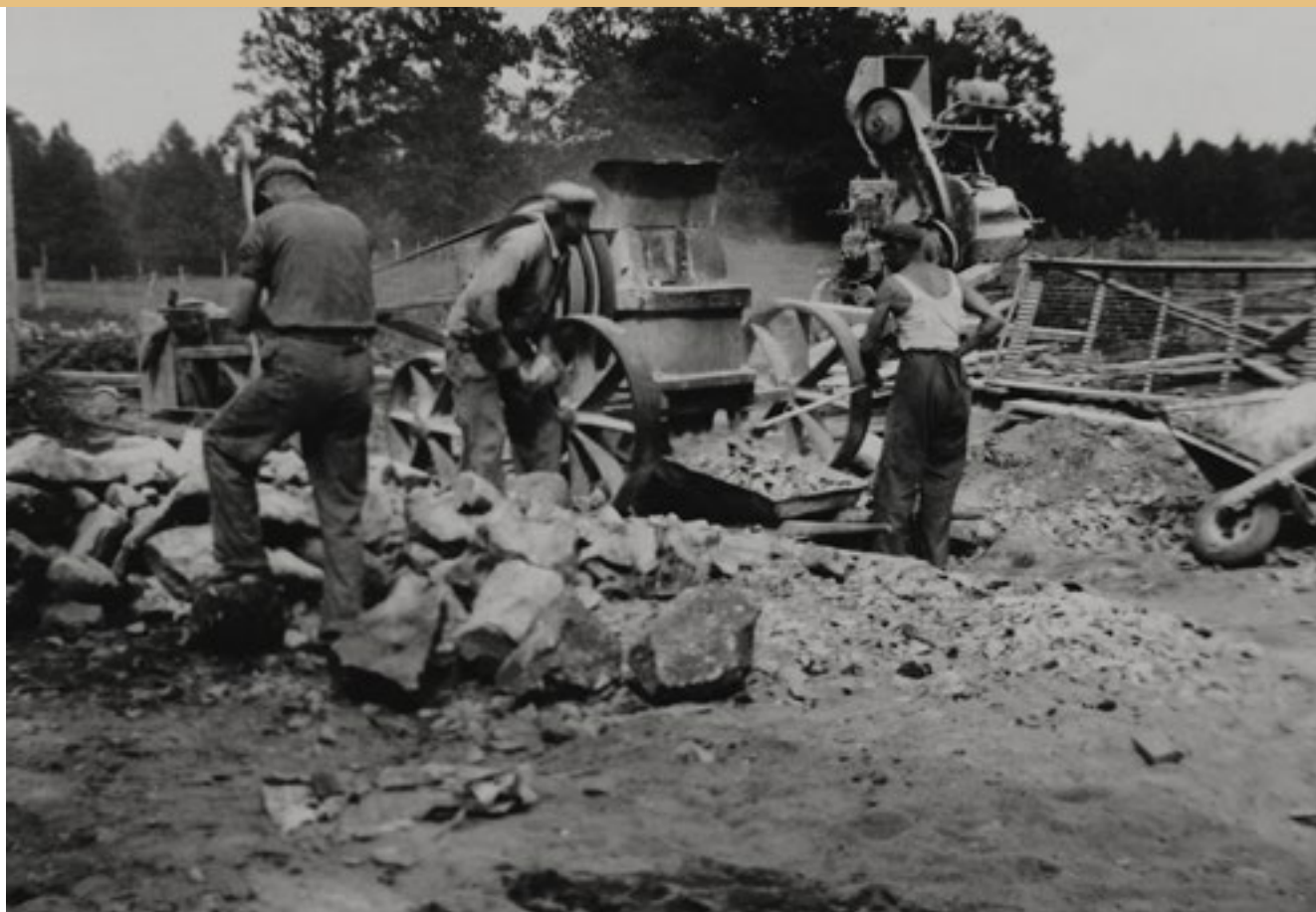
Vid tillbygget av ladugården, sommaren 1943, användes stenkross för att få fram byggmaterial.