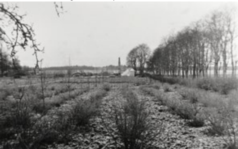
Växthus och trädgårdsanläggning på vårvintern 1936.