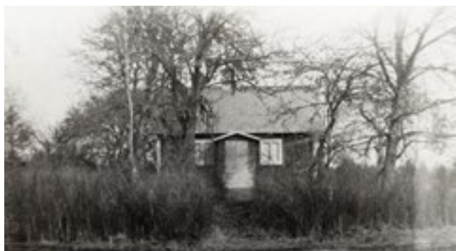
Nytorpet i april 1930.