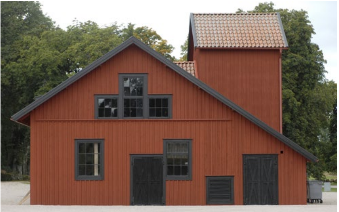
Vagnslidrets östra gavel.

rödfärgades. Den öppna delen i mitten användes redan från början som vagnsskjul. På den östra gavelns norrsida uppfördes i början av 1930-talet en spannmålstork, en modernitet som blivit prisvinnare på en samtida lantbruksutställning. 1939 kompletterades den med värmepanna och säden kunde