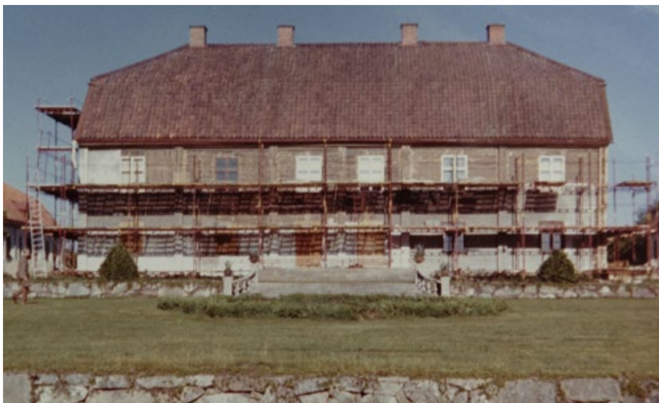
Fasadrenovering av mangården 1974.

första på platsen. De ramade in gårdsplanen på samma sätt som de senare och bidrog till säteriets karaktär av välbebyggd högreståndsmiljö. Av äldre protokoll framgår att de var uppförda i en våning med vind, och betydligt mindre till ytan än dagens fly-