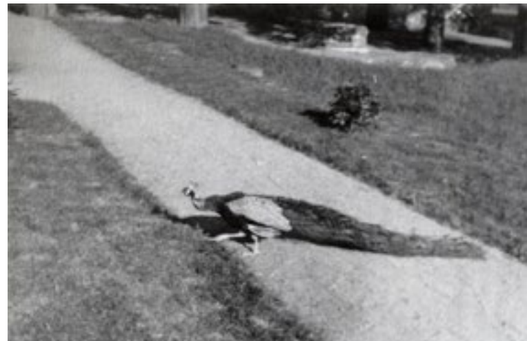
Kring 1940 fanns även påfåglar i parken.