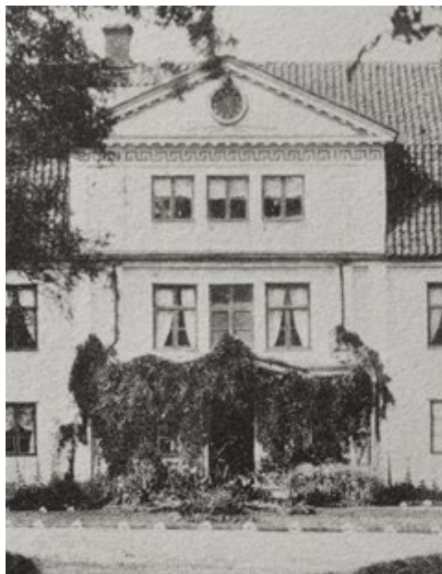
Den tidigare verandan var försedd med både snickarglädje och klätterväxter. Bilden är troligtvis tagen på 1910-talet, strax innan verandan revs.

1852 gjordes en ny värdering av huset på grund av den ombyggnad som just skett. Friherre Taube lät då modernisera exteriören genom att på gårdssidan tillskapa en frontespis i