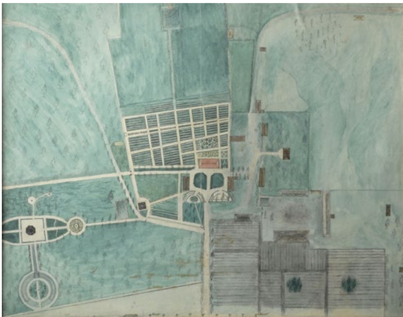
Ritning från 1850-talet över Lidhems park och trädgårdsanläggning.