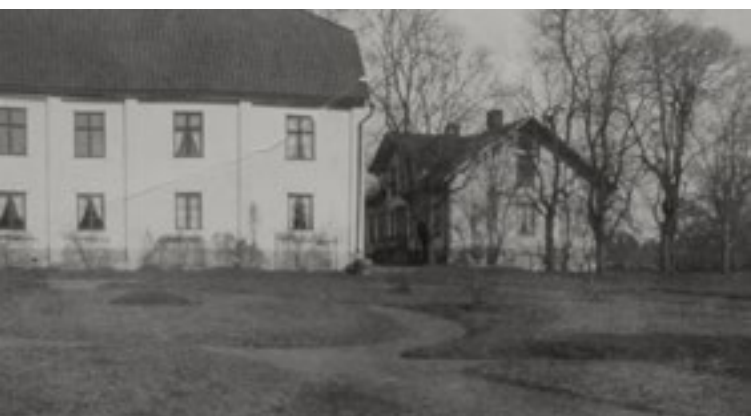
Våren 1930 hade flyglarna ännu sadeltak.