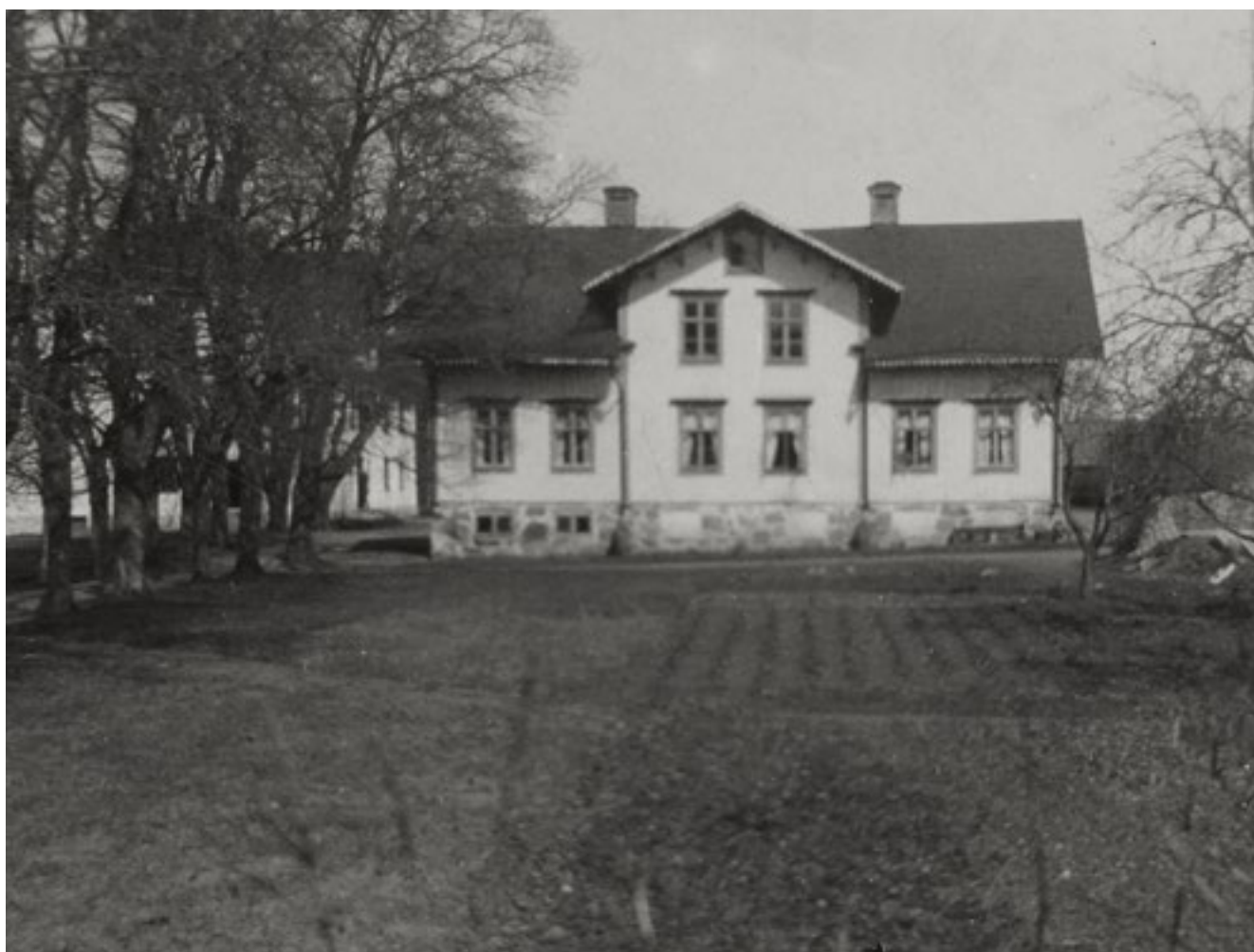
Flyglarnas branta sadeltak med kraftiga takutsprång var typiska för tiden kring byggåret 1867.