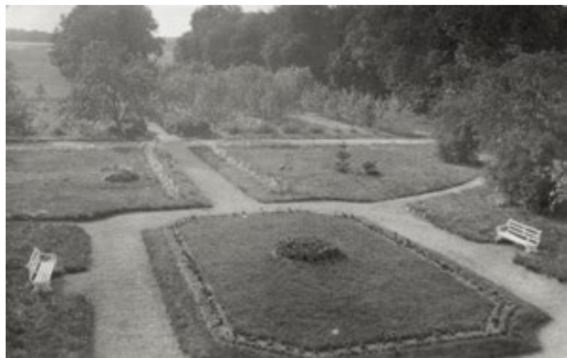
Trädgården precis bakom mangårdsbyggnaden, 1917.

Några av de riktigt gamla träden står kvar och antyder tidigare alléer och promenadvägar. Norr om gården har ett större område röjts från sly och därmed förlängt parkområdet ytterligare. Den långa allén längs infartsvägen är till stora delar intakt, bitvis nyplanterad, och närmast gården formar den ett sammanhängande grönt rum som omsluter bygatans byggnader. Bakom huvudbyggnaden öppnar sig landskapet och erbjuder en storslagen vy ut mot Lidhemssjön.