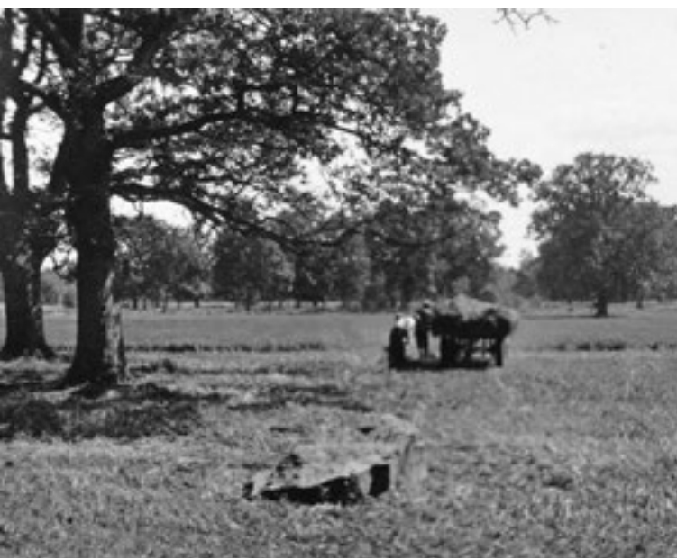
Linbärgning på Lustustrådan, sommaren 1942. I förgrunden syns stenfundamentet till en av parkens tidigare byggnader.

väster en grusgång till en ännu större rundel med någon slags cirkelformad anläggning. Den kan ha bestått av en låg stenmur men uppgifter om ett större lusthus finns också. Dessa platser sammanlänkades av raka grusgångar, symmetriska planteringar och rätvinkliga häckar. Det är oklart om hela anläggningen verkligen realiserats eller om kartan endast är en idéskiss. Spår efter det första lusthuset finns dock kvar i marken.