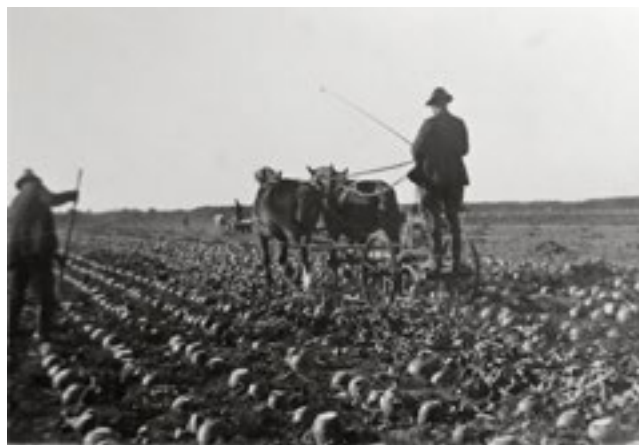
Upptagning av kålrötter på Mellanträdan, hösten 1929.

Under årens lopp har det funnits många backstugor, torp och arrendegårdar på Lidhems ägor. Idag är flertalet av dem rivna. Behovet av arbetskraft minskade när lantbruket mekaniserades under slutet av 1800-talet och när mer vikt därefter började läggas på skogen istället för jordbruket. De små åkerlyckor som fanns vid varje boställe, där torparna odlade en stor del av sin egen mat, planterades då igen.