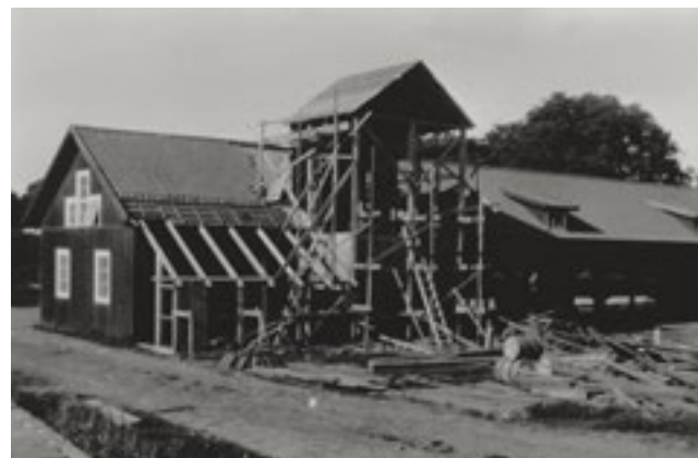
Det nya torkhuset uppförs 1934.