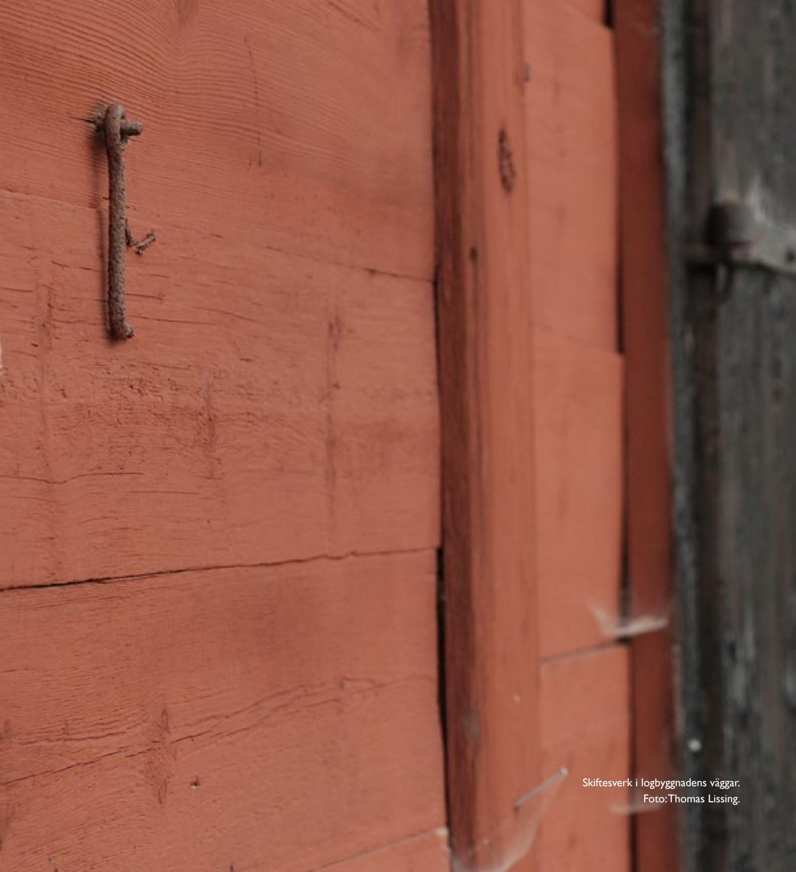
Skiftesverk i logbyggnadens väggar.