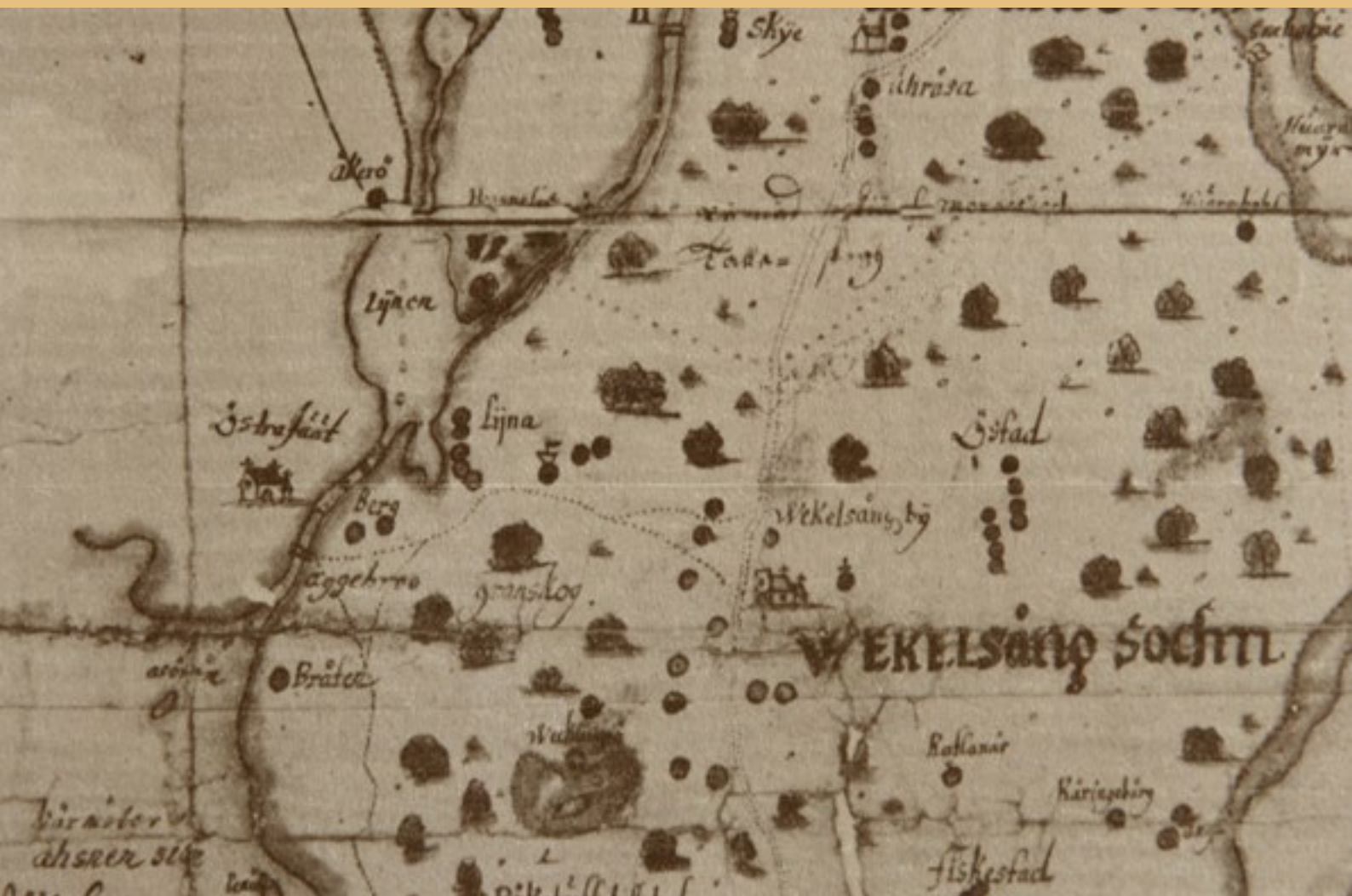
Utsnitt av lantmätare Ruuths karta år 1663, över Konga härad. Lidhem står som Lijna och Lidhemssjön kallas Lijnen.

därefter Lidhem fram till århundradets mitt. En tidsperiod i Lidhems historia som sannolikt inte innebar några större förändringar för gården.