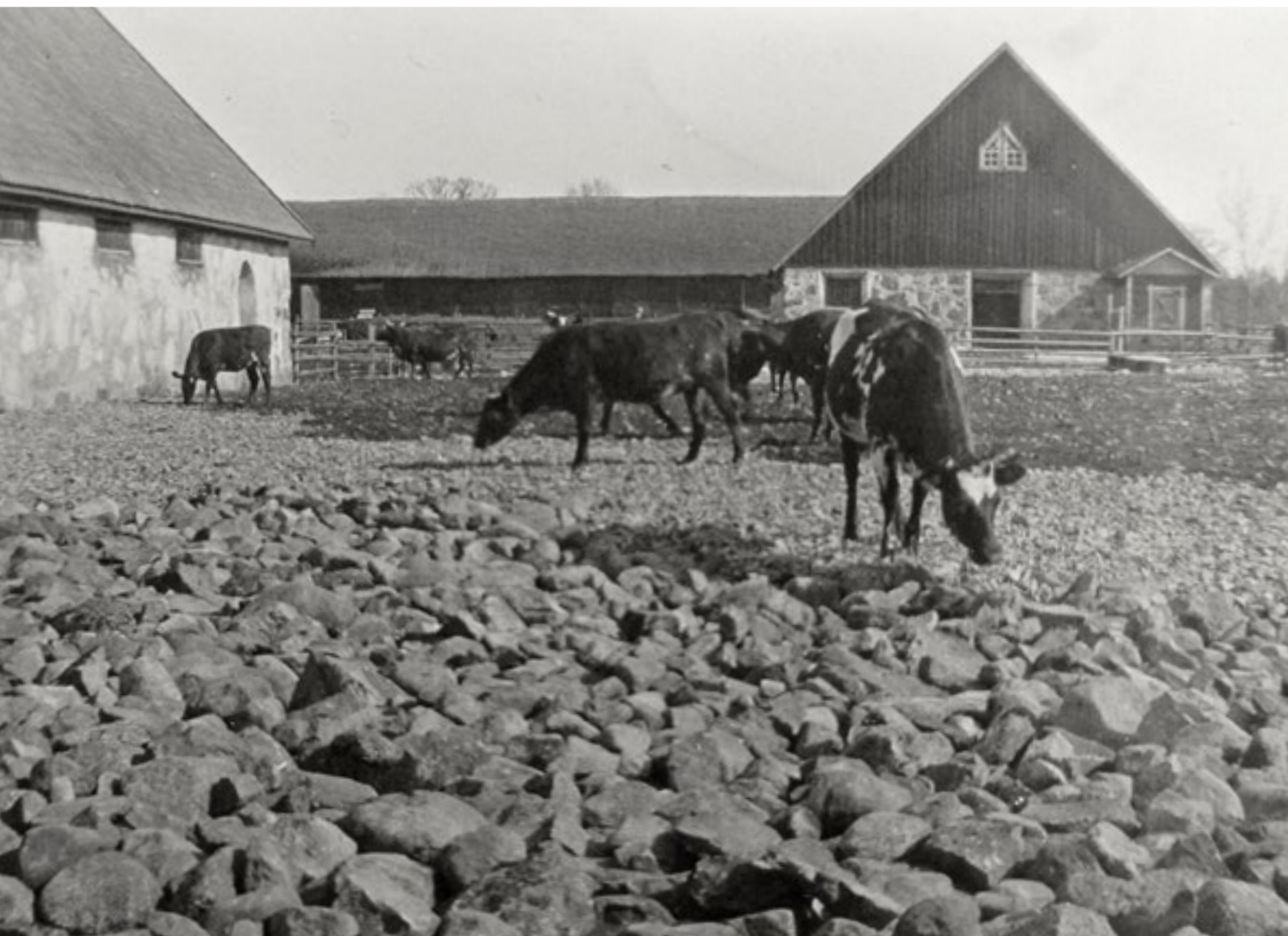
Kor utsläppta i den nya rastgården, i maj 1932.