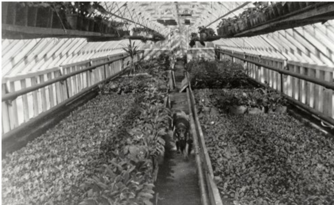
Interiör från växthus nummer 2, mars 1936.

och gårdens drift omkring trehundra personer vid förra sekel-skiftet. Idag finns det inga fast anställda kvar, arbetet sköts av ägarna och kontrakterade entreprenörer. Jordbruket arrenderas ut samtidigt som skogen utgör den största inkomstkäl-