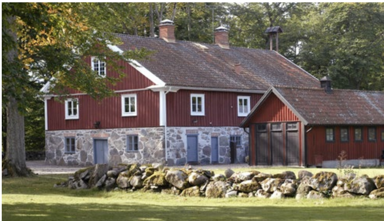
Dagsverksstugan och dess uthus.

Dagsverksstugan var navet i verksamheten på Lidhem. Här utanför samlades varje morgon gårdens arbetsstyrka för genomgång och fördelning av dagens uppgifter. I samlingsalen på bottenvåningen åt dagsverkarna sin medhavda matsäck. Rummet med långbord och bänkar finns kvar än idag