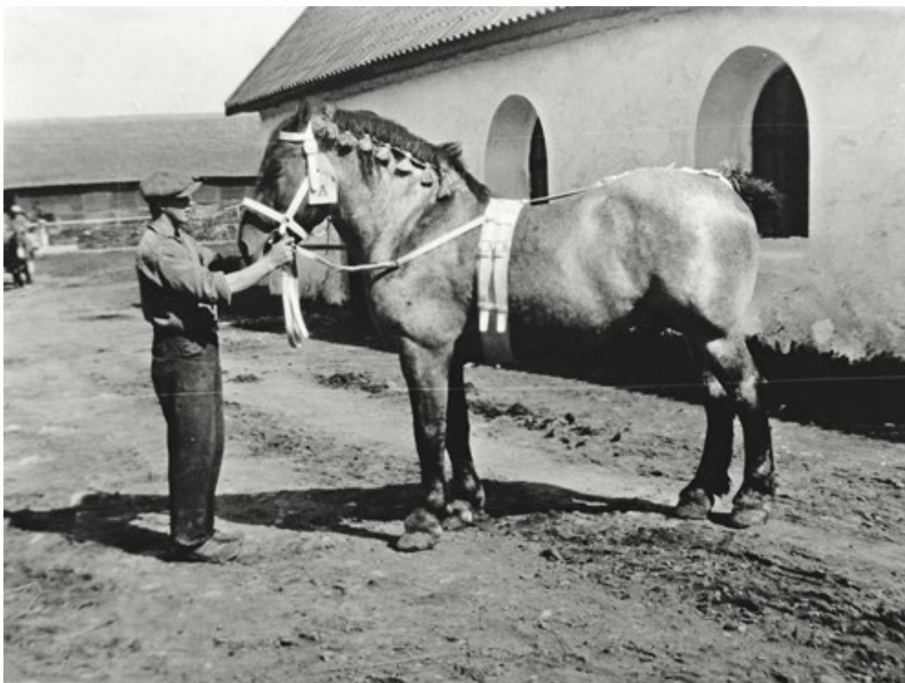
En av 1930-talets arbetshästar; Lurifax 4814.