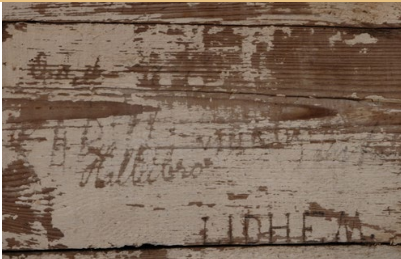
På dassets innerväggar finns spår efter tidigare besökare.