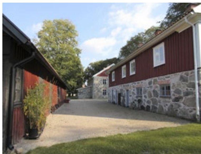
Dagsverksstugan med sina uthus, samt bakom dem mejeriet.