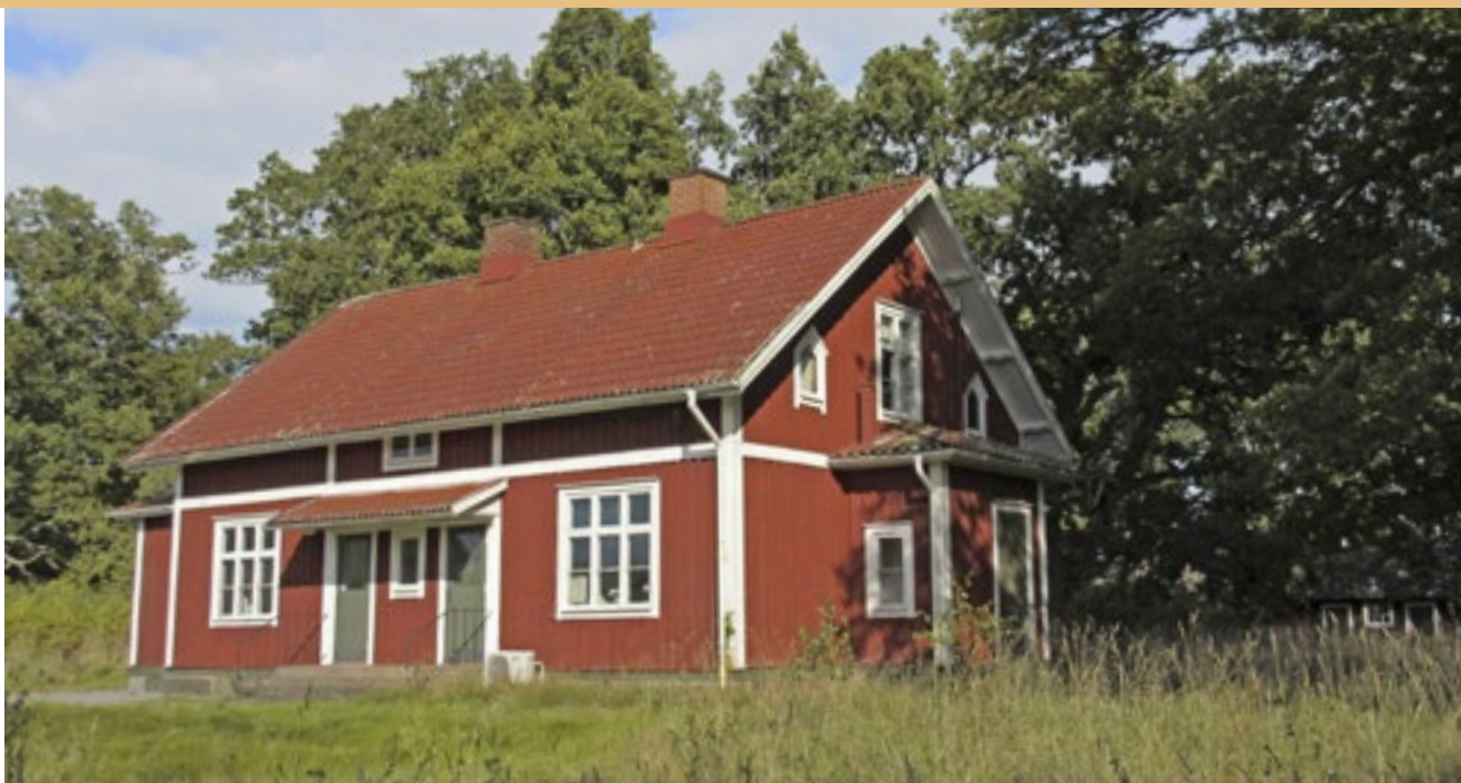
Före detta arbetarbostaden Britteberg står strax söder om gården.

se i mitt föräldrahems trädgård och sedan även i min egen. En del äppel torkades och kunde på så sätt förvaras till senvintern och framåt våren.