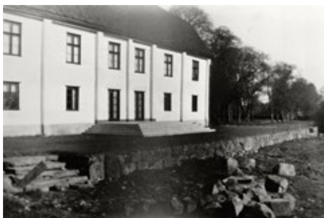
I juni 1935 började stensättningen vid mangården bli färdig.

hon visserligen ägnat sig åt hemmet och barnens vård, men även till en på den tiden ganska ovanlig grad åt deras gemensamma intellektuella intressen. Då hade yrkesutbildade trädgårdsmästare hållit trädgården putsad och fin. Men efter husfaderns död fanns det inte längre några pengar till sådant. Lantbruksdrängarna skötte om det tyngsta i köksträdgården och för resten fick allsammans växa som det kunde och ville.