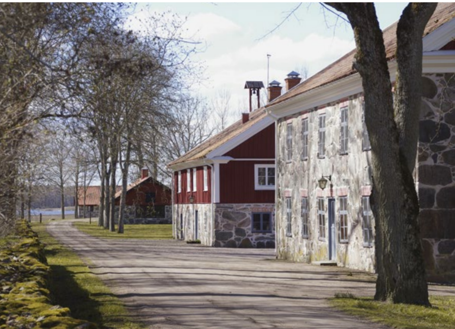
Byvågen med mejeriet i förgrunden. Mitt emot byggnaden står en av gårdens tidigare brunnar.