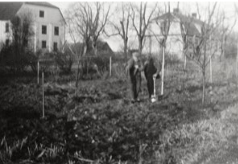
Plantering av fruktträd, april 1932.