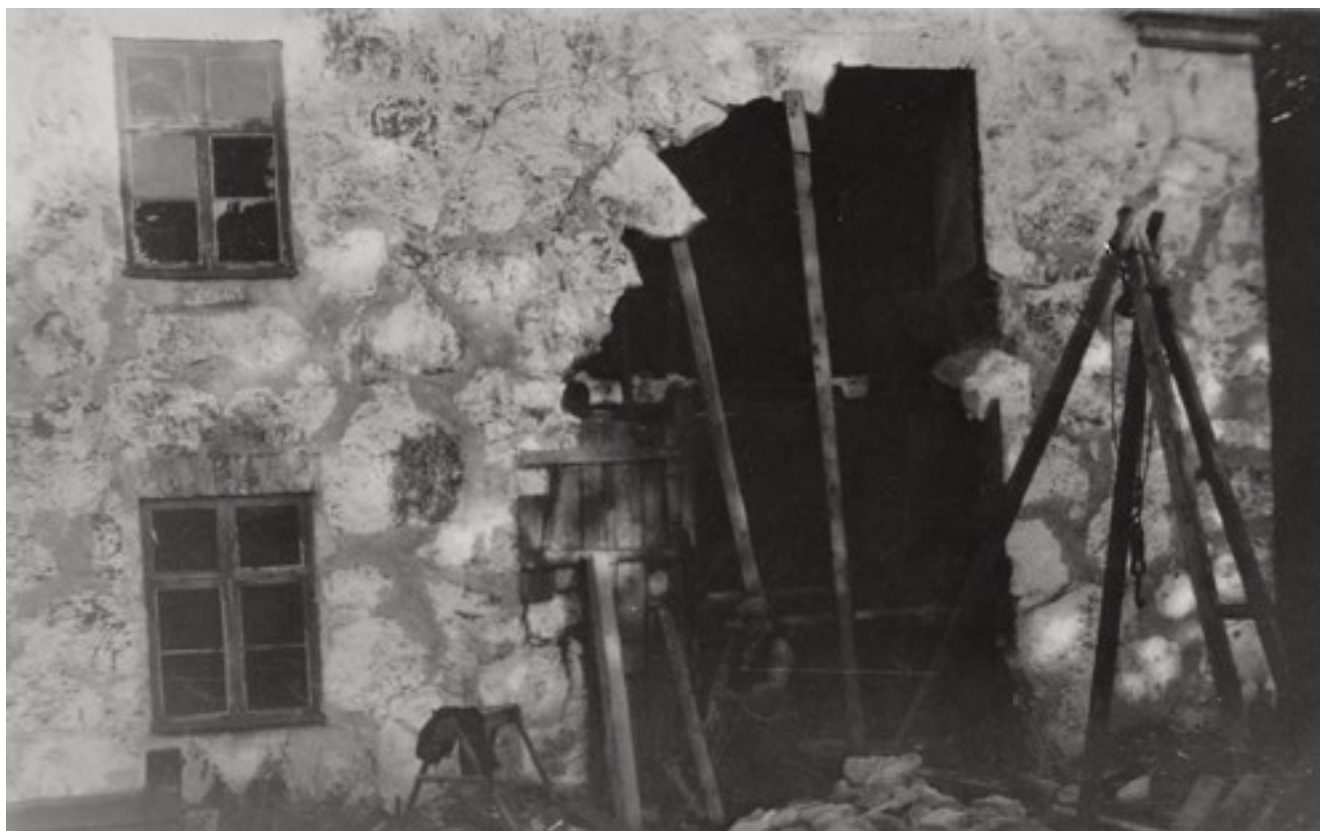
Delar av väggen rasade hösten 1932, när en öppning för garageport skulle tas upp.

Mejeriet har en skiftande historia. Det uppfördes i två våningar med väggar av gråsten med inläggningar i tegel, samt gavelspetsar i trä. De tidiga uppgifterna om byggnaden är knapphändiga. År 1899 beskrivs huset som före detta mejeri och dåvarande arbetarbostad. På bottenvåningen fanns då källare och tvättstuga med stengolv samt två boningsrum. I övervåningen fanns fem bostadsrum och över dem spannmålsvind. Sex av rummen var tapetserade och halmtaket hade vid den