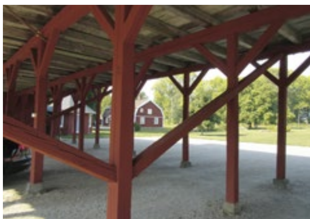
Vagnslidret, med dasset och kuskbostaden i bakgrunden.

Den nya byggnaden uppfördes av timmer och taket täcktes av papp. Både synliga bjälkar och gavlarnas brädväggar