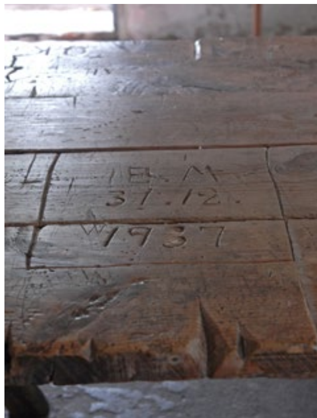
I dagsverksstugans rustika möblemang sitter många spår efter de människor som arbetat på gården.