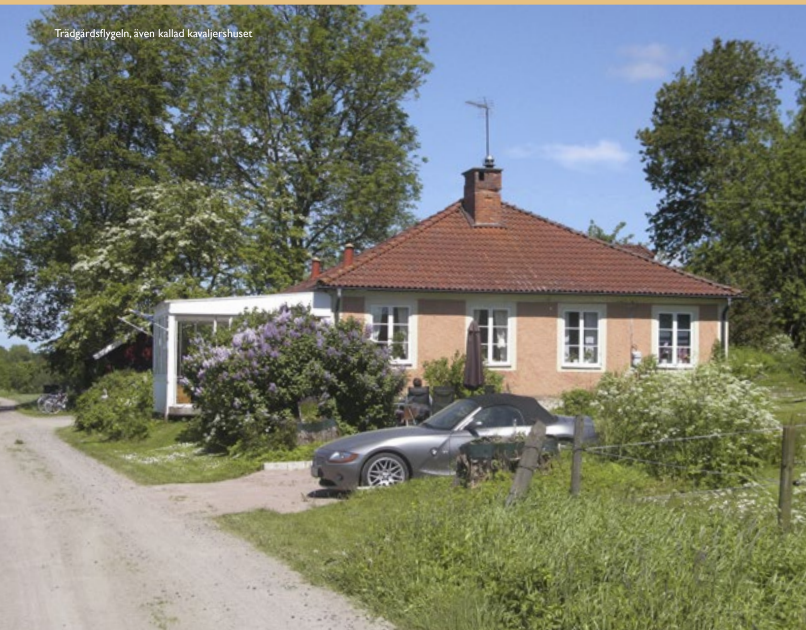
Trädgårdsflygeln, även kallad kavaljershuset