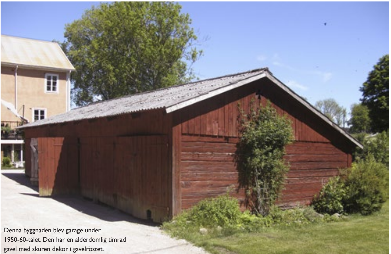
Denna byggnaden blev garage under 1950-60-talet. Den har en ålderdomlig timrad gavel med skuren dekor i gavelröset.

Byggnaden har alltså en äldre historia på gården men hur den använts eller när den byggdes är inte känt.