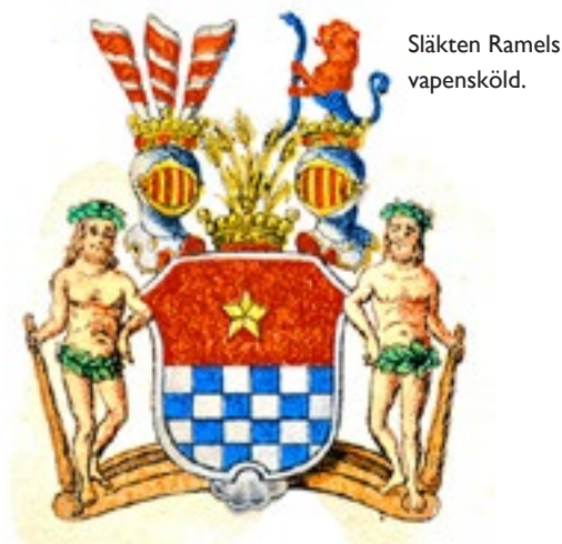
Slakten Ramels vapensköld.

dens mest gångbara produkter – brännvin. År 1850 stod ett nybyggt ångbränneri klart att tas i bruk på gården. Var på gården bränneriet låg har inte gått att fastställa. Det drevs med vattenkraft och hade pumpar och rännor som kunde leda vatten till alla delar av byggnaden. För den nya byggnaden tecknades en brandförsäkring i Länets Brandstodsbolag. I handlingen finns en beskrivning av byggnaden och inredningen som ligger till grund för försäkringens värdering. Byggnaden är 25 alnar lång, 18\frac{1}{4} alnar bred och 4\frac{1}{4} alnar hög vid ena gaveln och 6 alnar hög vid den andra. En svensk aln är knappt 0,6 meter, vilket i meter ger byggnaden måtten 15m, 11m, 2,5 m och 3,6 m. Den står på en hög sockel av gråsten och har väggar av furutimmer och tak av tegel. I den nedre stensatta delen av byggnaden fanns mäskkällare och brännvinsmagasin. I byggnadens östra del var ångbränneriet installerat. Det fanns också vindsutrymmen för malttorkning och potatiskokning. Hjärtat i anläggningen var en ångpanna av koppar, som värderades till 445 riksdaler banco, samt mäskpanna med hatt, mäskmästare af lika storlek, rektificator en aln hög och \frac{3}{4} i diameter, jemte 2ne bäcken med 3 bottnar hwardera 1 aln 10 tum i diameter samt 5 tum djupa, jemte