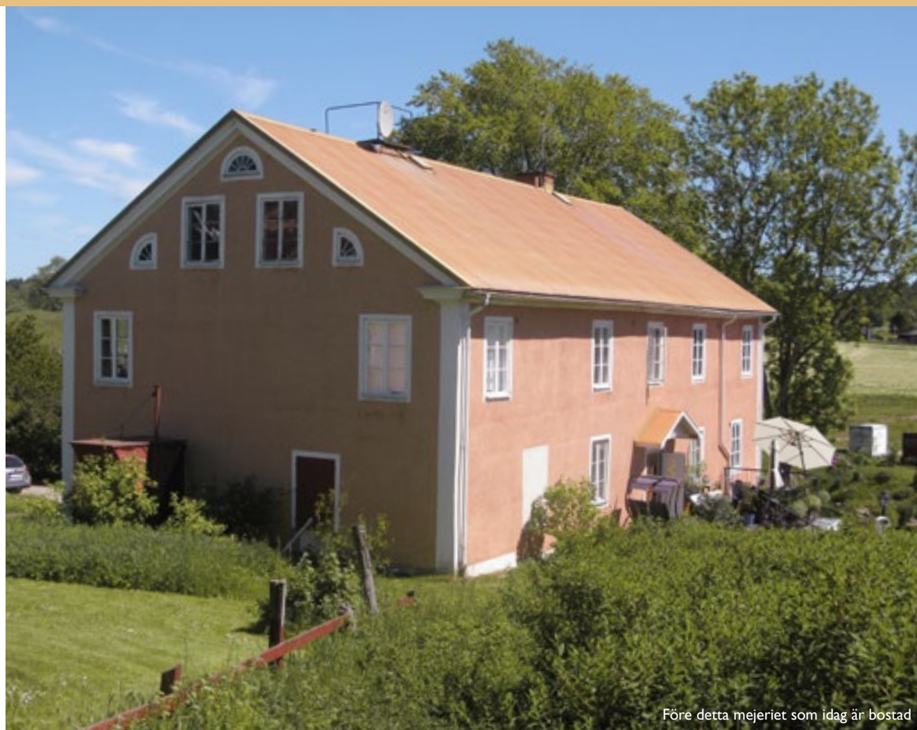
Före detta mejeriet som idag är bostad