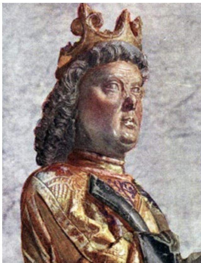
Den svenske kungen Karl Knutsson Bonde.