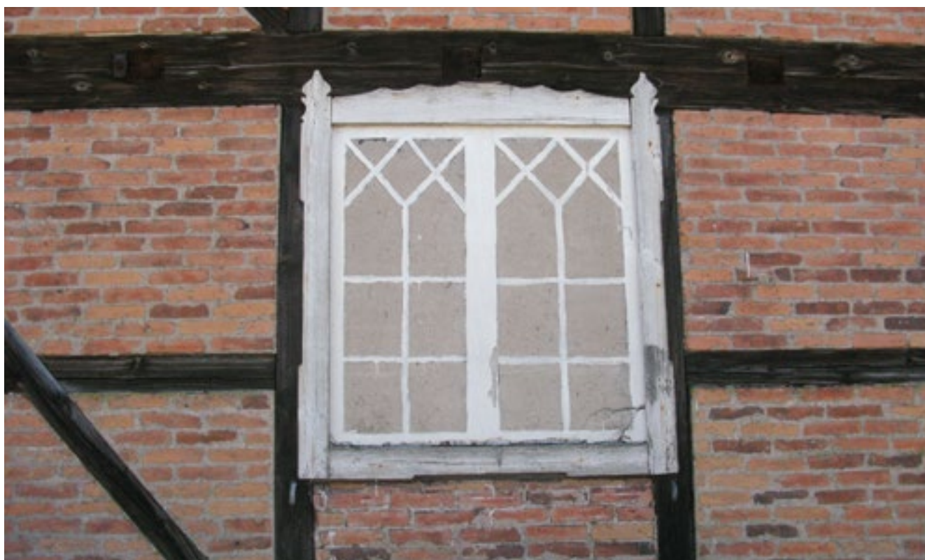
Fönster och korsvirkeskonstruktion i närbild.

utanför Kalmar. Sammantaget ger detta intrycket av en man som spelar högt i affärer och som vid den här tidpunkten, då han köper Gårdsby säteri, hade lyckan med sig. Till Gårdsby kommer han och familjen efter att en tid ha bott i Drothems socken i Östergötland.