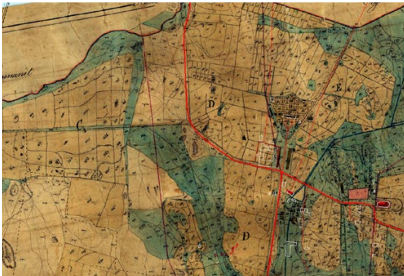
Del av laga skifteskartan för Gårdsby från 1862. Kartan har rektifierats och dagens byggnader är inlagda med vita linjer och dagens vägar med röda. De vita byggnadslinjerna visar att corps-de-logiet, trädgårdsmästarebostaden och Dusagården fanns vid den här tiden. Mejeriet är på lagaskifteskartan markerad med rött. Byggnaden var vid den här tiden under uppförande.

naden av trä, täckt med näver och torv, fanns två par kvarnstenar med gjutet växelverk. Mjölharens boningshus var av trä med tak av näver och torv. Om svinhuset får vi veta att det var av trä. I huset för vattensågen fanns "ett blad" och huset av trä har bräddtak. Arbetarbostaden Dusagården var byggd av trä med tak av näver och torv. Huset var på bottenvåningen inrett med två stugor, kök, ett mindre sidorum samt förstuga