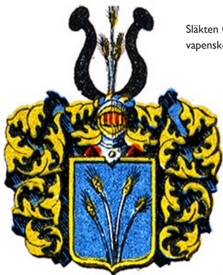
Släkten Gyllenax vapensköld.

Under de följande åren skulle Gårdsby säteri vandra genom flera olika ägare. För merparten framstår gårdsinnehavet som en ekonomisk placering. Med ett par undantag var ägarna inte bosatta på gården.