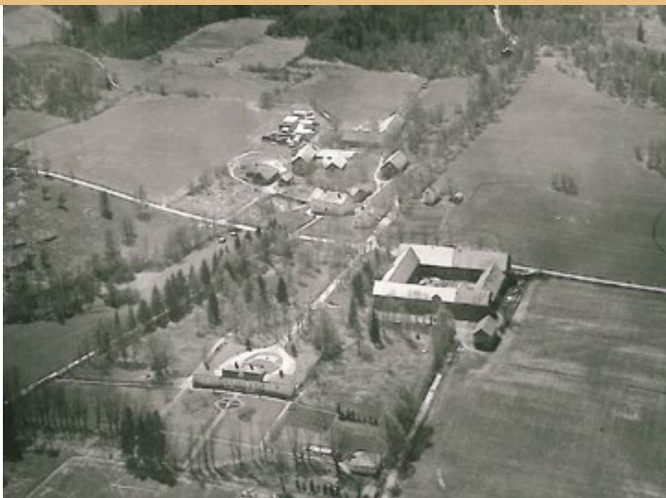
Flygfoto över Gårdsby säteri från 1933.

och omvandlade verksamheten till ett aktiebolag. Jan var ansvarig för jordbruket och Mikael för skogsbruket medan Peder valde ett arbete utanför gården. Inom jordbruket satsade man mycket på mjölkproduktionen. Man renoverade ladugården 1965 och var då en av de första svenska ladugårdar som fick så kallat spaltgolv. Det är en typ av golv med stavar, vanligen av betong, mellan vilka djurens gödsel kan trampas ner till ett underliggande golv. Det underlättar naturligtvis renhållningen i ladugården och gör att djuren inte behöver stå i gödseln. Man satsade också på avel för att få bra bättre mjölkkor som kunde producera mera. Man kom att inrikta sig på rasen Holstein som är en svart-vit mjölkkras. Genom kontakter med Kanada importerade man tjursperma och började föda upp kalvar för eget bruk men även för försäljning. Det blev ett viktigt komplement till mjölkproduktionen, som under de senaste decennierna varit en ekonomisk berg- och dalbana för Sveriges bönder. Importen av tjursperma och de kontakter man hade med Kanada lade grunden för företaget