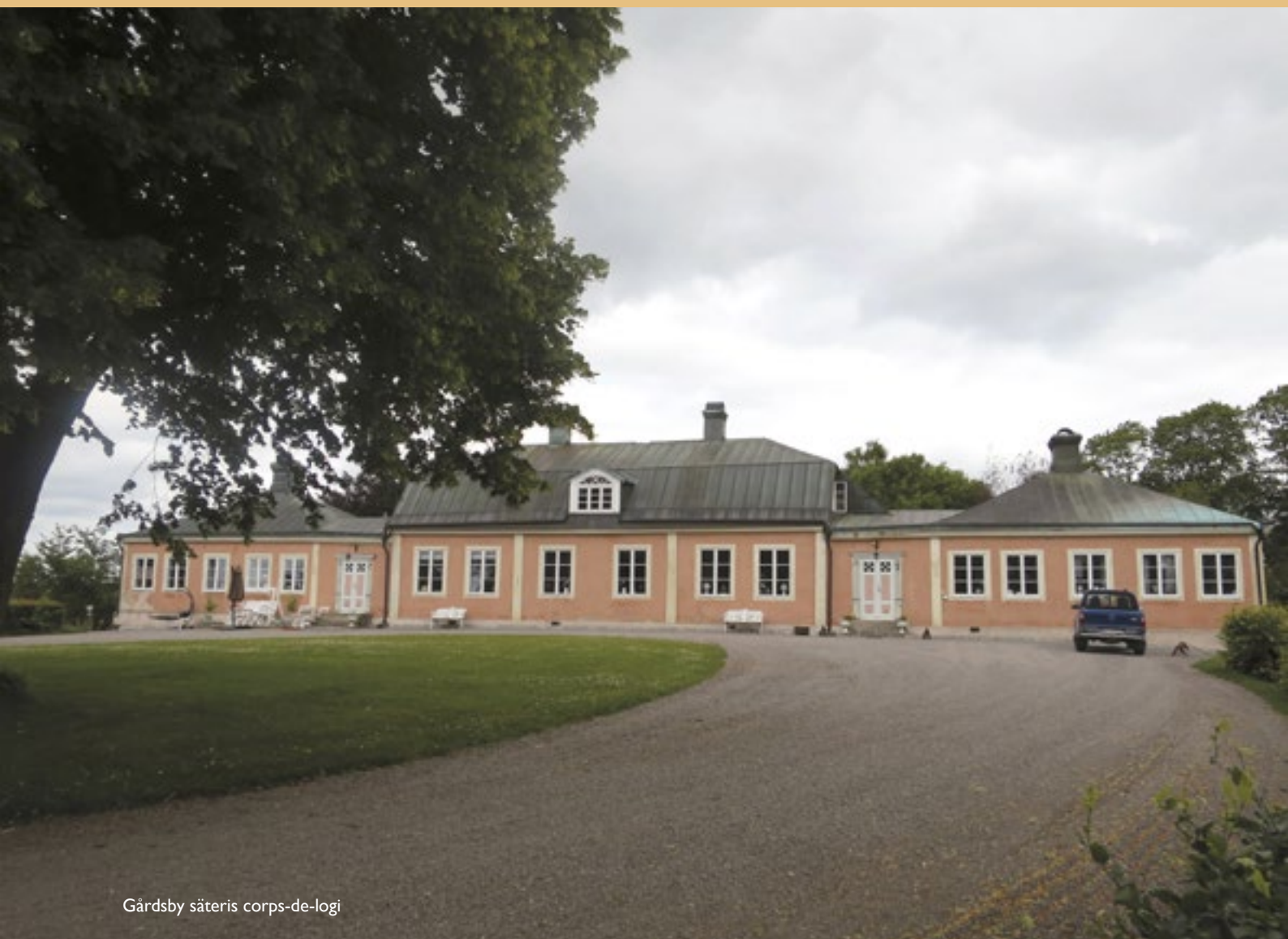
Gårdsby säteris corps-de-logi

vägen gick rakt upp till gården från Smedtorpet. Den gamla hade slingrat sig fram. I trädgården planterades 500 fruktträd av olika sorter.