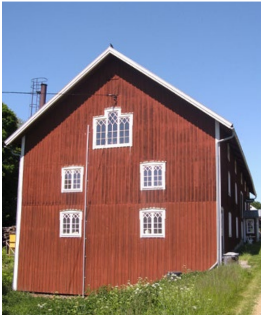
Såg och spannmålmagasin