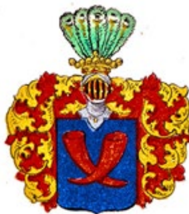
Slakten Kyles vapensköld.