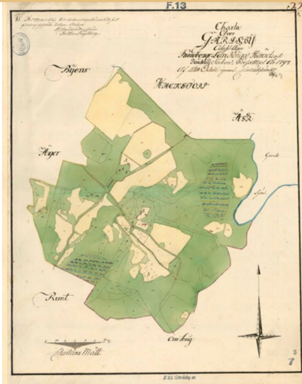
"Charta öfver Gårdsby Odahl ägor" från 1797. Kartan låg till grund för storskiftet. På kartan ser man Karl Wilhelm Rappes nya stora ladugårdsbyggnad samt Gasslandavägens gamla stäckning öster om corps-de-logiet.