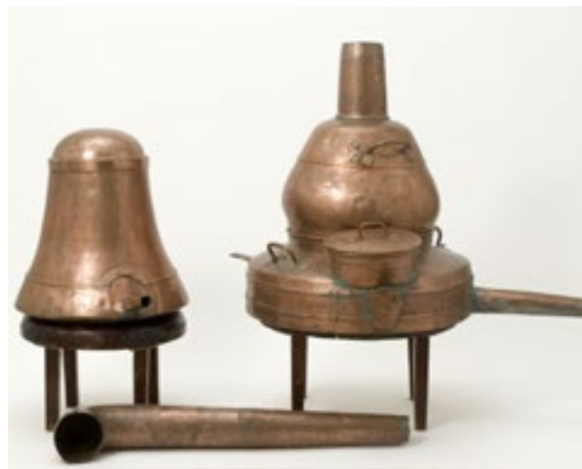
Brännvinspanna av koppar med kontrollstämpl. Detta är ett exempel på en mindre brännvinspanna än den som fanns på Gårdsby säteri.

en tryckpump och flera st rörledningar (som på några ställen genomgående väggarna) allt af ny koppar hwartill även hörer en mängd kranar och skrufvar af metall, nödige för driften af Brännvinsredskap i 3dje klassen med Ånga”. Den beskrivna anläggningen värderades till 888 riksdaler banco. Hela byggnaden med utrustning värderades till 2678 riksdaler banco, vilket med dagens penningvärde motsvarar drygt 300 000 kr. Den nya verksamheten var brandfarlig, men man konstaterar i handlingen att den låg på behörigt av stånd från såväl ladugården som huvudbyggnaden.