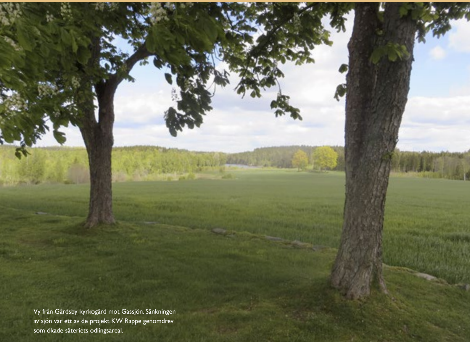
Vy från Gårdsby kyrkogård mot Gassjön. Sänkning av sjön var ett av de projekt KW Rappe genomdrev som ökade säteriets odlingsareal.

med en meter och huset byggdes till med en våning. Fönstren i det gamla huset förstörades enligt det tidiga 1800-talets smak, som krävde ljus och rymd. Två nya flyglar med en takhöjd på 2,8 meter byggdes på var sida av huvudbyggnaden så att byggnaden blev totalt 50 meter lång. Hela huvudbyggnaden byggdes och inreddes i gustaviansk stil. Gårdsplanen