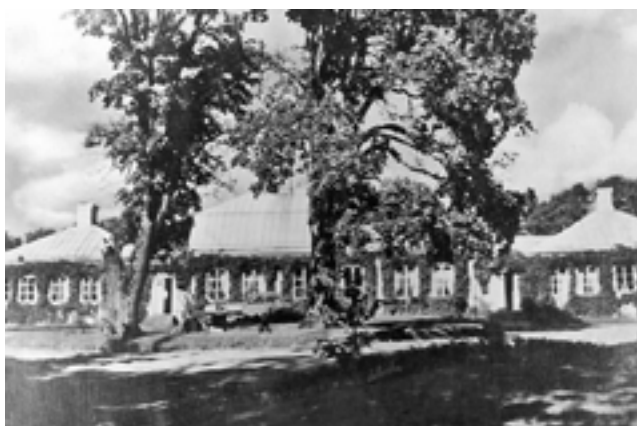
Gårdsby säteris corps-de-logi på 1930-talet