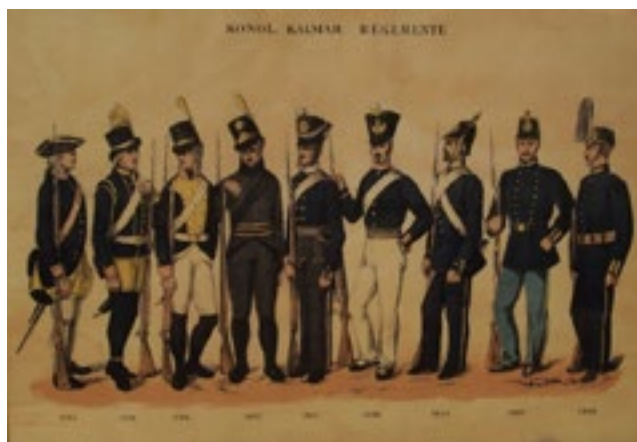
Flera medlemmar av familjen Rappe var militärer och tillhörde Kalmar regemente. Här ser man regementets uniformer från 1765 till 1888.