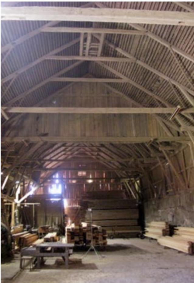
Den stora trösklogen har ett mäktigt valv. Till höger i bilden ser man några av de luckor genom vilka potatis lastades in för vinterförvaring.