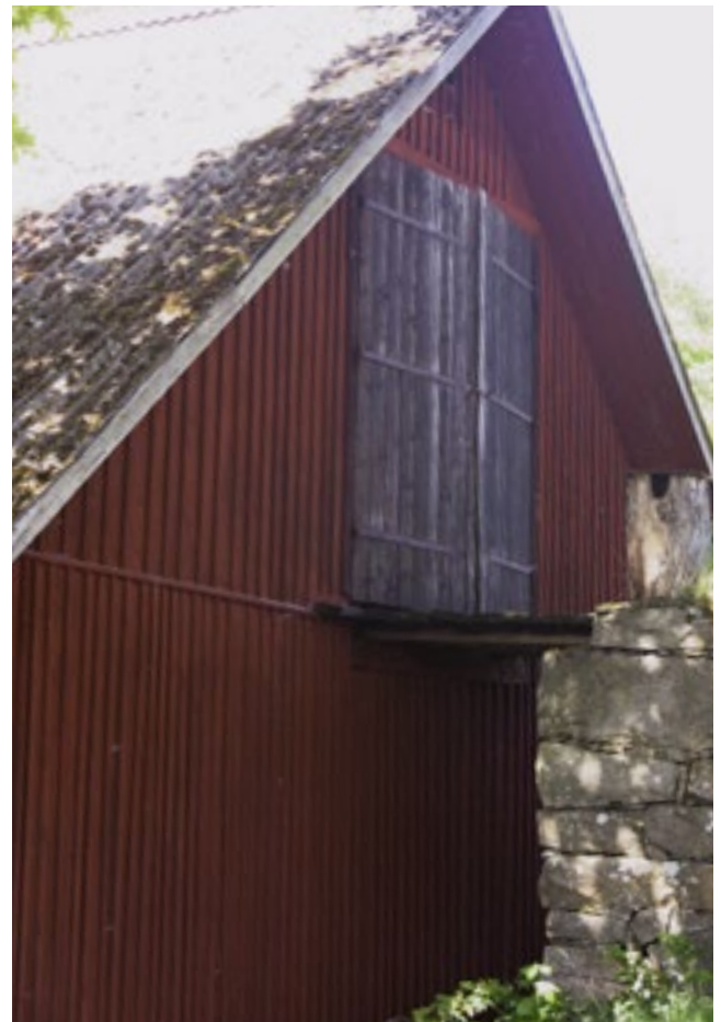
Genom hela trösklogen gick en körbana. Från körbanan kastades spannmålskärvar ner till tröskverket. Här en av körbanans ingångar till trösklogen.