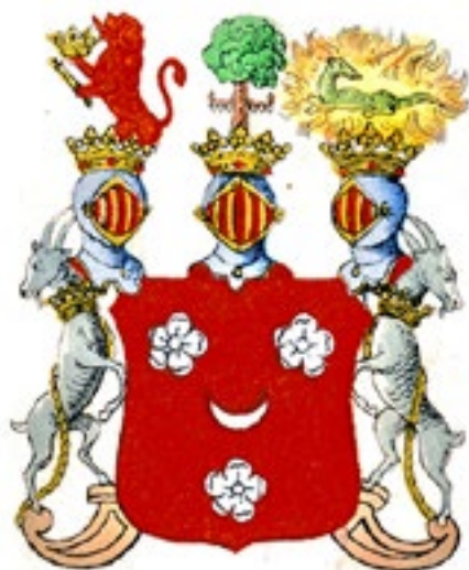
Släkten Hamiltons vapensköld

Gustaf Hamilton gjorde också en satsning på en av dåti-