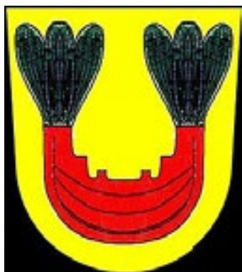
Slakten Bondes vapensköld