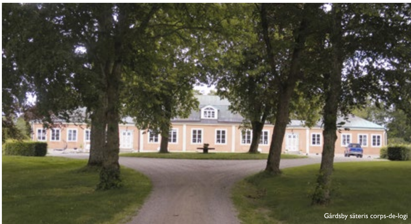
Gårdsby säteris corps-de-logi