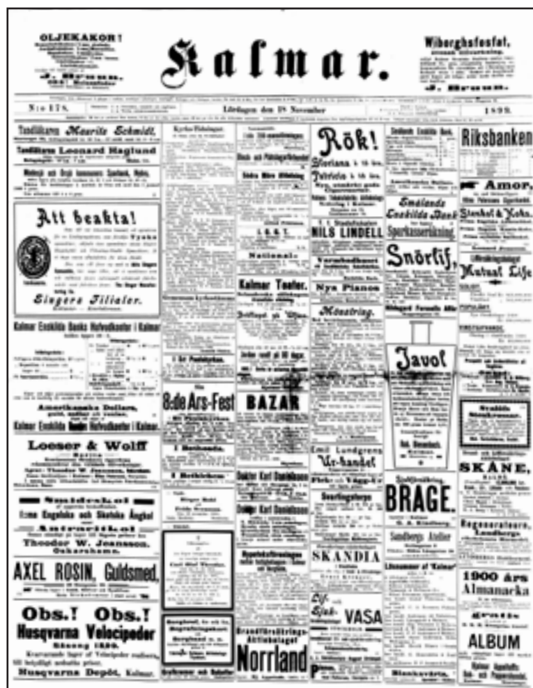
Utsnitt ur tidningen Kalmar lördagen den 18 november 1899.