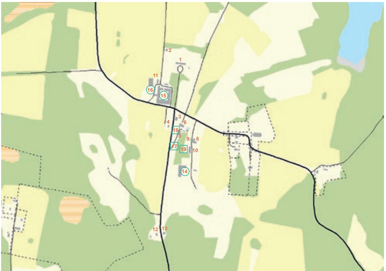
Karta över Gärdby säteris byggnader. De numrerade byggnaderna ingår i byggnadsminnet. Siffror inom blå ring visar befintliga byggnader som inte ingår i byggnadsminnet och siffror inom blå fyrkant visar ungefärligt läge för byggnader som rivits under 1900-talet.