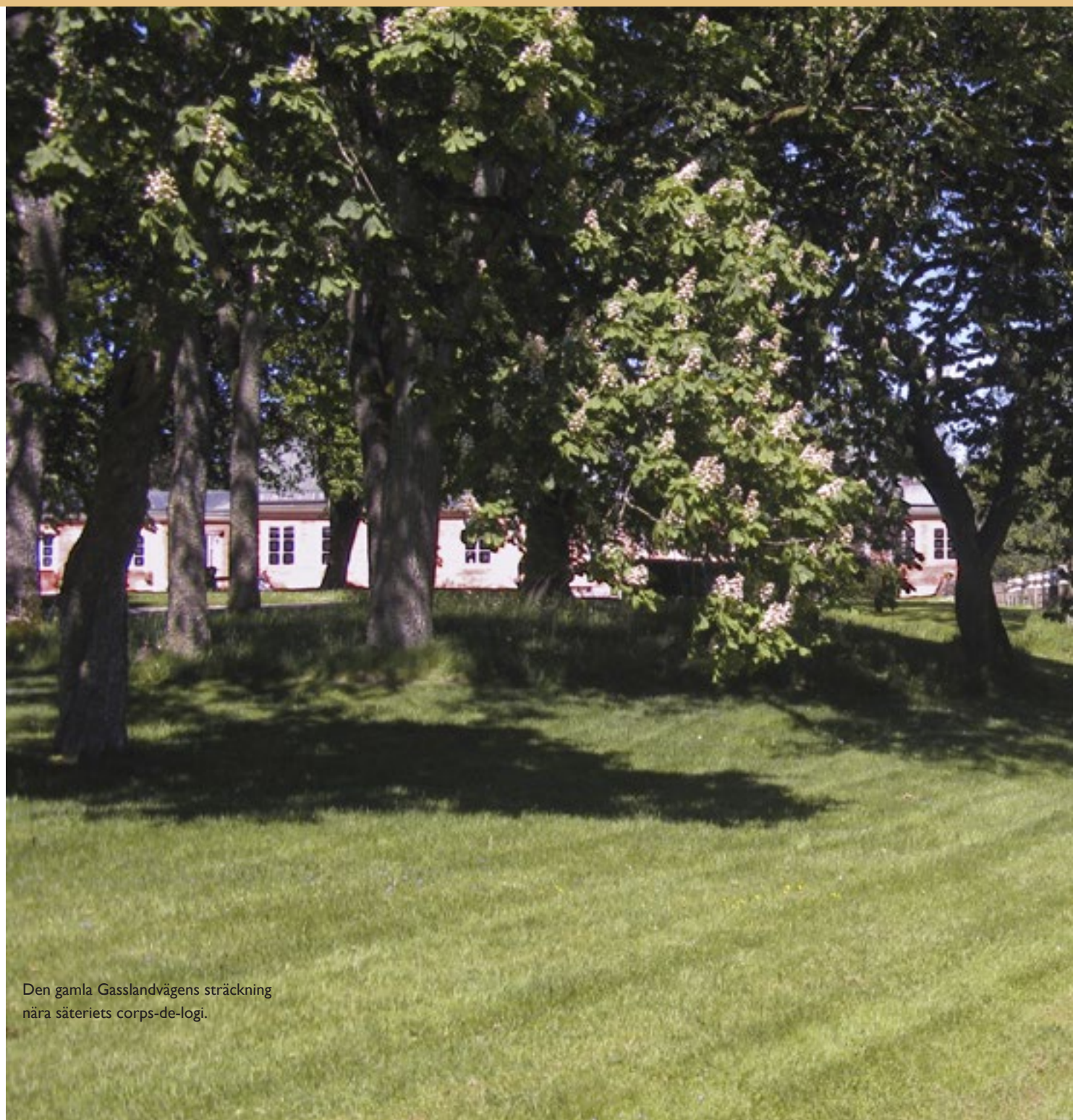
Den gamla Gasslandvägens sträckning nära säteriets corps-de-logi.