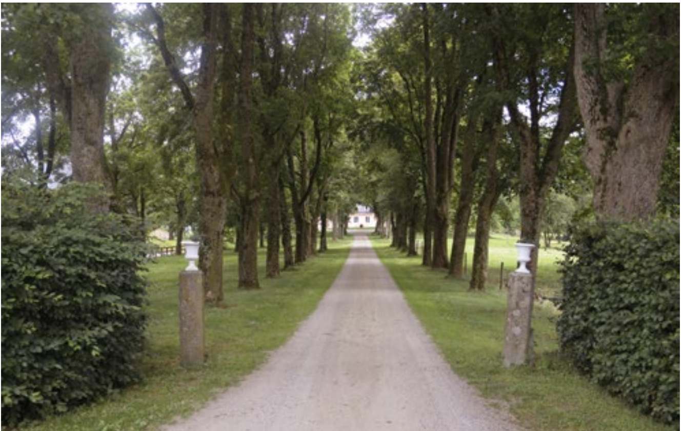
Allén fram till Gårdsby säteris corps-de-logi.

stormaktstiden från slutet av 1500-talet till början av 1700-talet, kan man tydligt se hur jordbrukets produktion sjunker när stora delar av den manliga befolkningen befinner sig på krigståg. Man klarade då att upprätthålla den produktion som krävdes för gårdens behov men allt som kunde ge gården extra