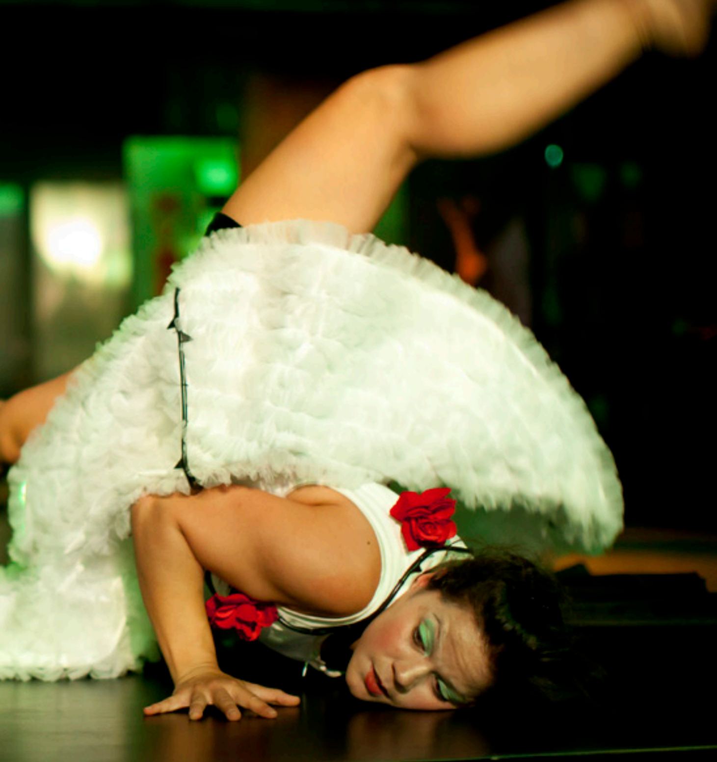
Möten på samma arena skapar förutsättningar för samsyn, förståelse och vidare diskussioner. Med glashyttan i Kosta som scen möts cirkusartister, glasblåsare och glasartister i föreställningen Fragile Fairytale.