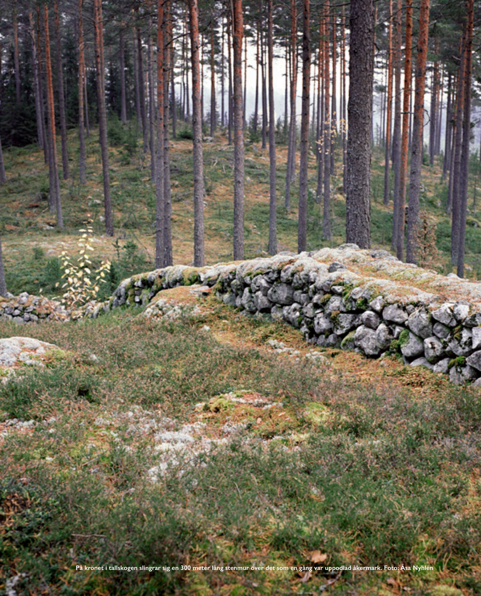
På krönet i tallskogen slingrar sig en 300 meter lång stenmur över det som en gång var uppodlad åkermark.