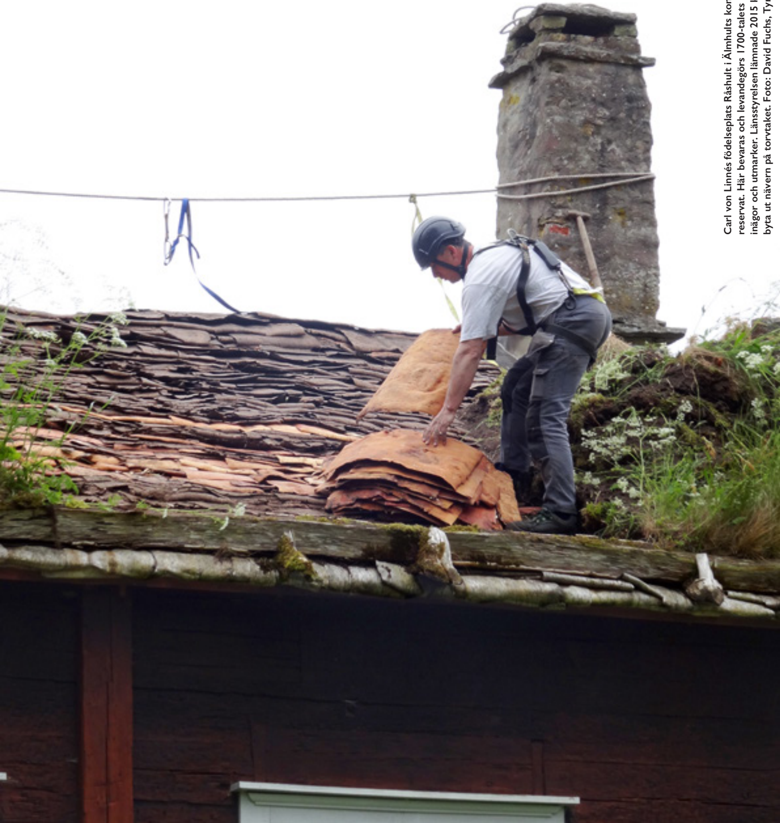
Carl von Linnés födelseplats Råshult i Älmhults kommun är länets enda kulturreservat. Här bevaras och levandegörs 1700-talets landskap med gårdsmiljö, inägor och utmarker. Länsstyrelsen lämnade 2015 kulturmiljöbidrag för att byta ut nävern på torvtaket.