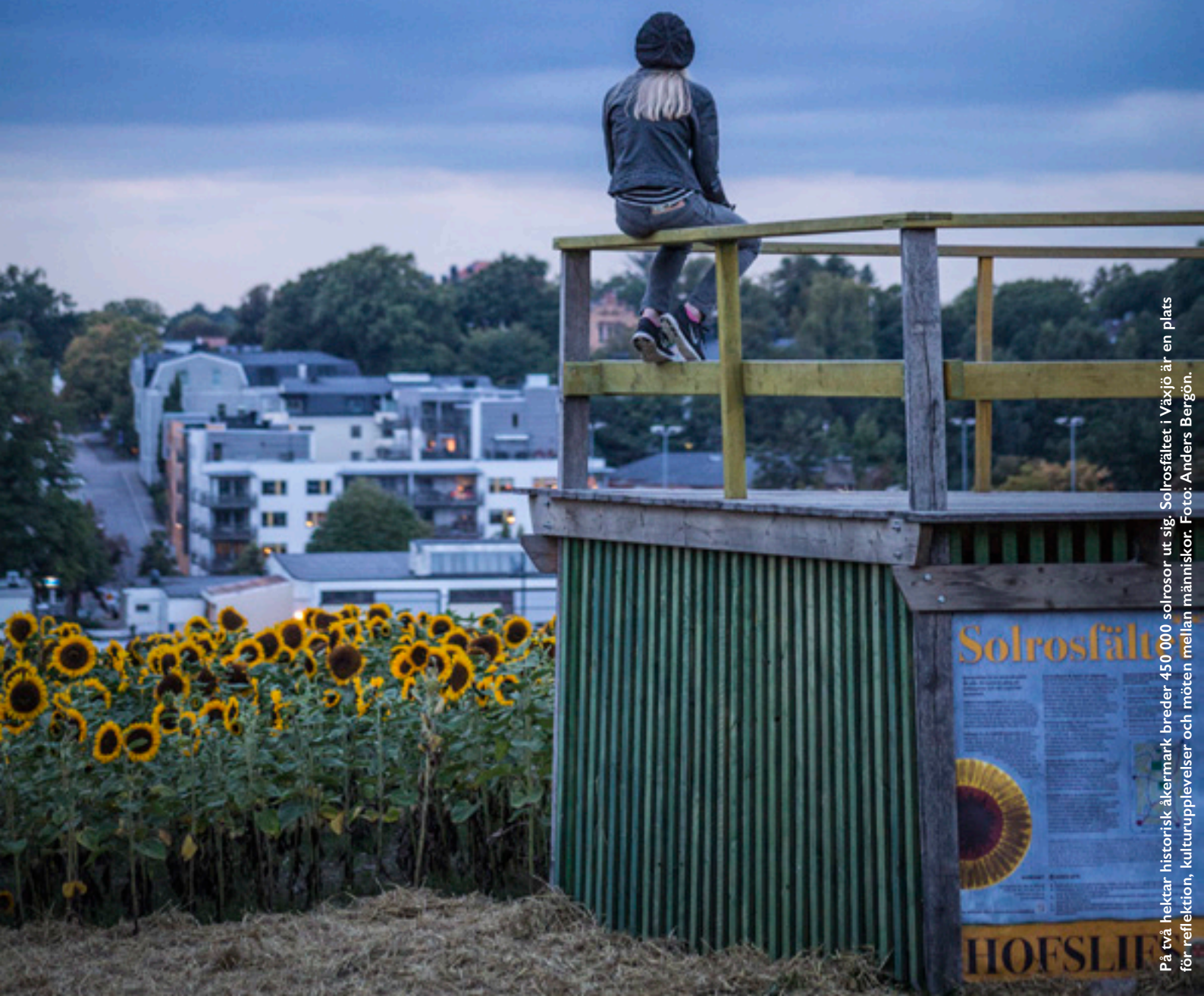
På två hektar historisk åkermark breder 450 000 solrosor ut sig. Solrosfältet i Växjö är en plats för reflektion, kulturupplevelser och möten mellan människor.