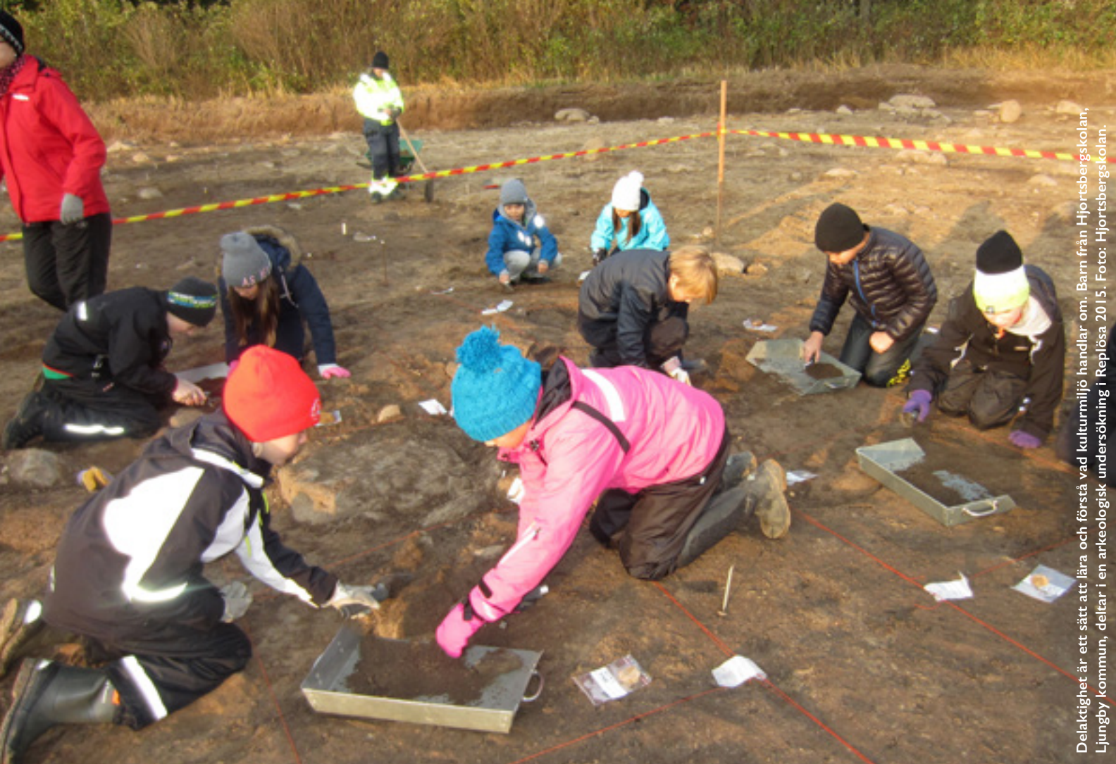
Delaktighet är ett sätt att lära och förstå vad kulturmiljö handlar om. Barn från Hjortsbergskolan, Ljungby kommun, deltar i en arkeologisk undersökning i Replösa 2015.