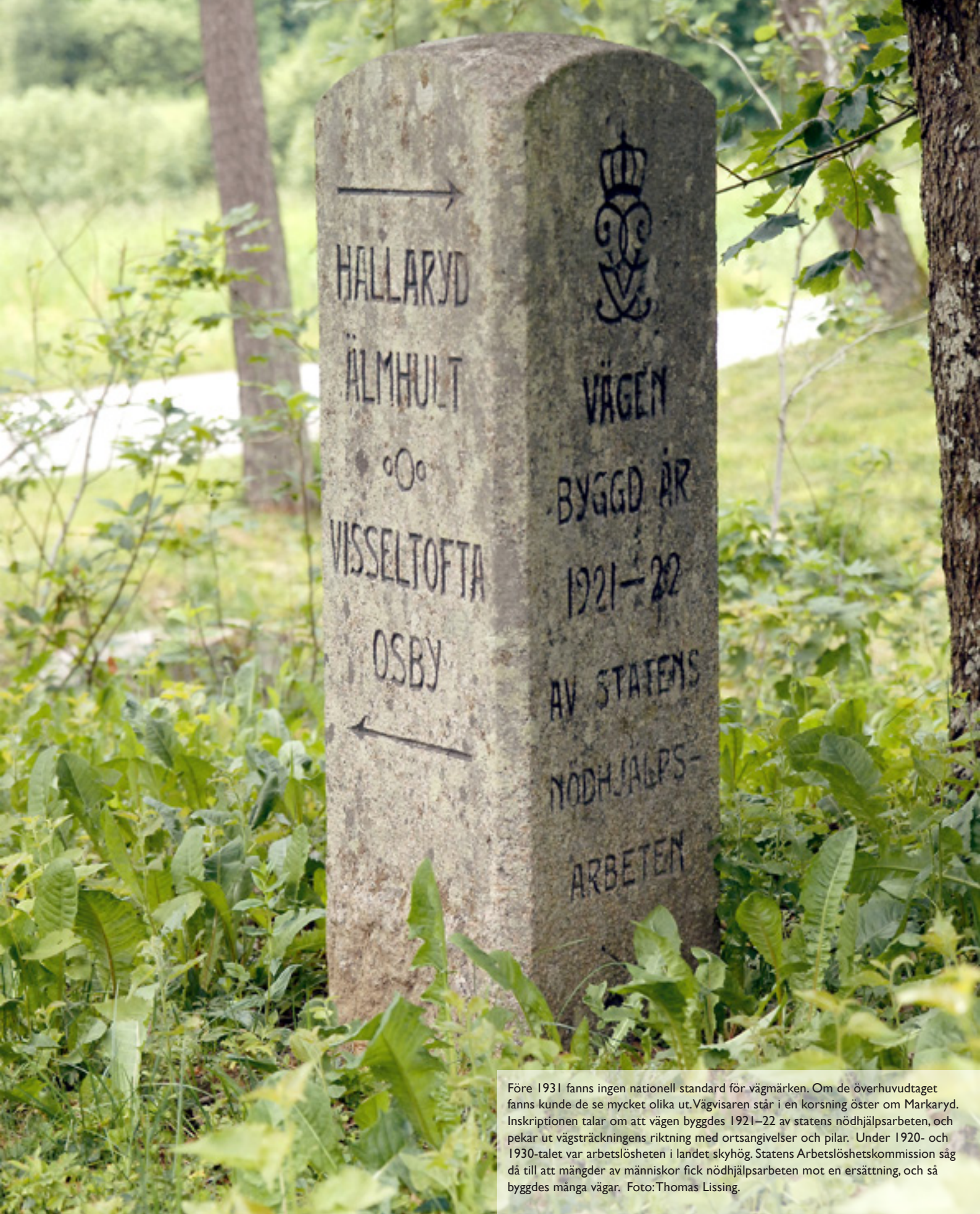
Före 1931 fanns ingen nationell standard för vägmärken. Om de överhuvudtaget fanns kunde de se mycket olika ut. Vägvisaren står i en korsning öster om Markaryd. Inskriptionen talar om att vägen byggdes 1921–22 av statens nödhjälpsarbeten, och pekar ut vägsträckningens riktning med ortsangivelser och pilar. Under 1920- och 1930-talet var arbetslösheten i landet skyhögt. Statens Arbetslöshetskommission såg då till att mängder av människor fick nödhjälpsarbeten mot en ersättning, och så byggdes många vägar.