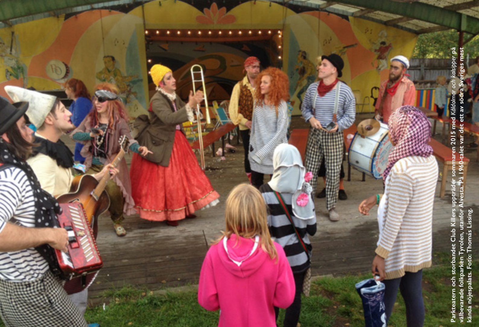
Parkteatern och storbandet Club Killers uppträder sommaren 2015 med Kåldalmar och kalsnipper på välbevarade folkparken Tyrolen, utanför Alvesta. På 1960-talet var det ett av södra Sveriges mest kända nöjespalats.