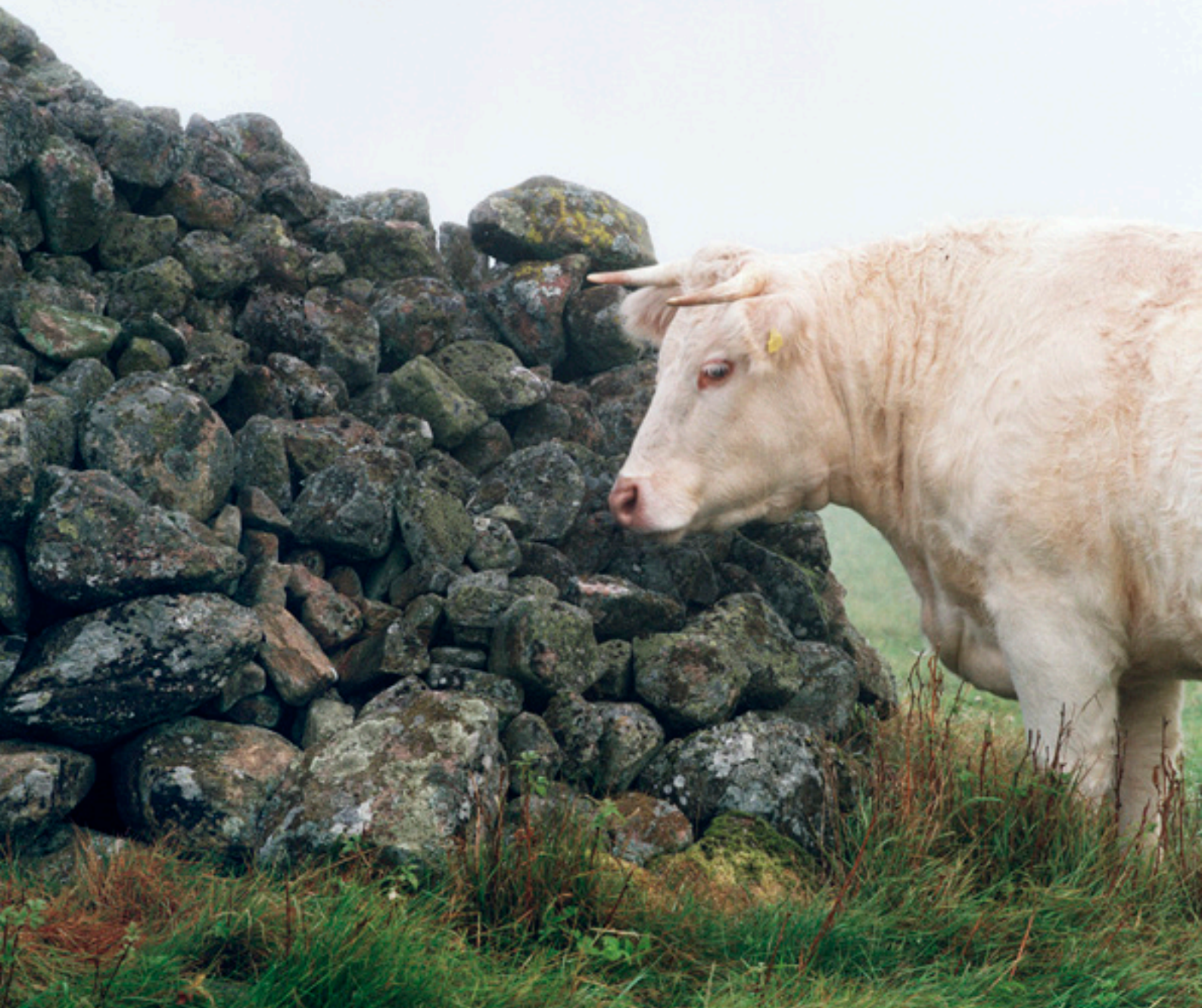
I Hörda, Berga socken i Ljungby kommun, finns några av Smålands mest imponerande och vällagda odlingsrösen.