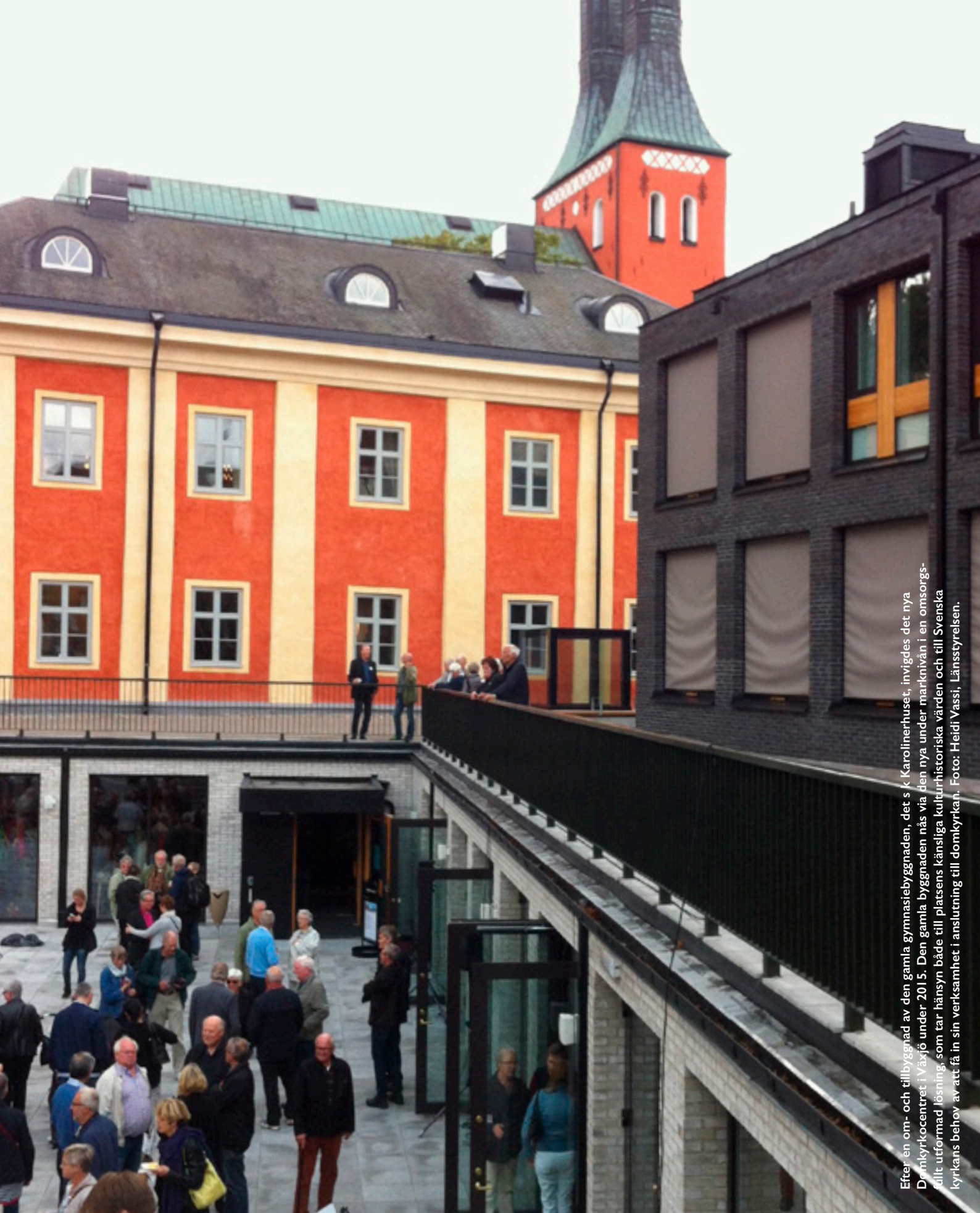
Efter en om- och tillbyggnad av den gamla gymnasiabyggnaden, det så kallade Karolinerhuset, invigdes det nya Domkyrkocentret i Växjö under 2015. Den gamla byggnaden nås via den nya undermarknivån i en omsorgsfullt utformad lösning, som tar hänsyn både till platsens känsliga kulturhistoriska värden och till Svenska kyrkans behov av att få in sin verksamhet i anslutning till domkyrkan.