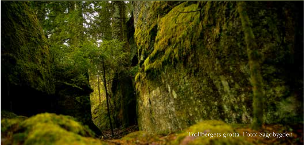
Trollbergets grotta.