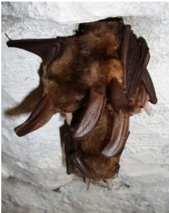
Bild 4 Brunlångöra – långa öron, i dvala viker de ned dem under vingarna.

Den vanligaste arten i hus som vi stöter på är dock dvärgpipistrell. Dessa bildar de största kolonierna och är den art som oftast ger upphov till klagomål. Nya rön visar att den inte går att artbestämma i handen och att den kan förväxlas även på jaktlätet.