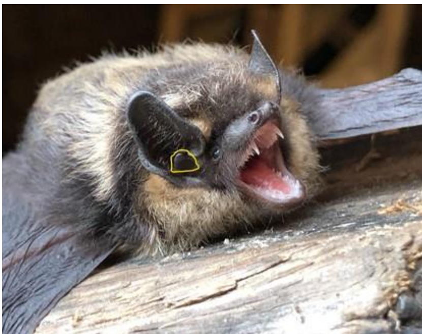
Bild 1. Tragus är en viktig karaktär för artbestämning, se gul markering (nordfladdermus).

De arter vi hittills fått in uppgifter på i hus är nordfladdermus, gråskimlig fladdermus, brunlångöra. Dessa tre arter går normalt lätt att artbestämma utifrån följande bildexempel.