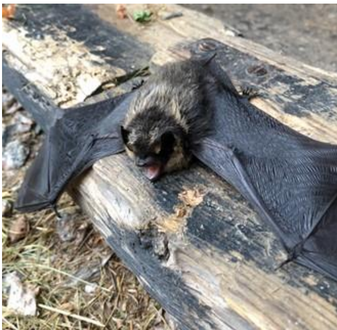
Bild 2 Nordfladdermus – lejongul rygg, svart nacke, lejongul på hjässan.

De arter vi hittills fått in uppgifter på i hus är nordfladdermus, gråskimlig fladdermus, brunlångöra. Dessa tre arter går normalt lätt att artbestämma utifrån följande bildexempel.