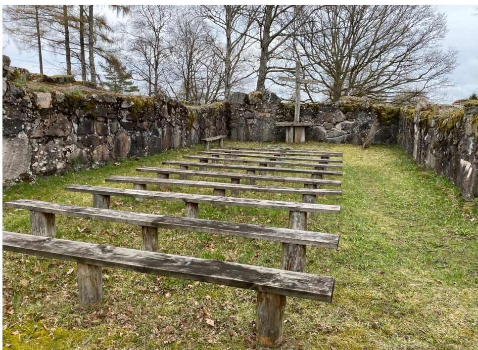
Hallsjö Ödekyrkogård, Ljungby kommun.