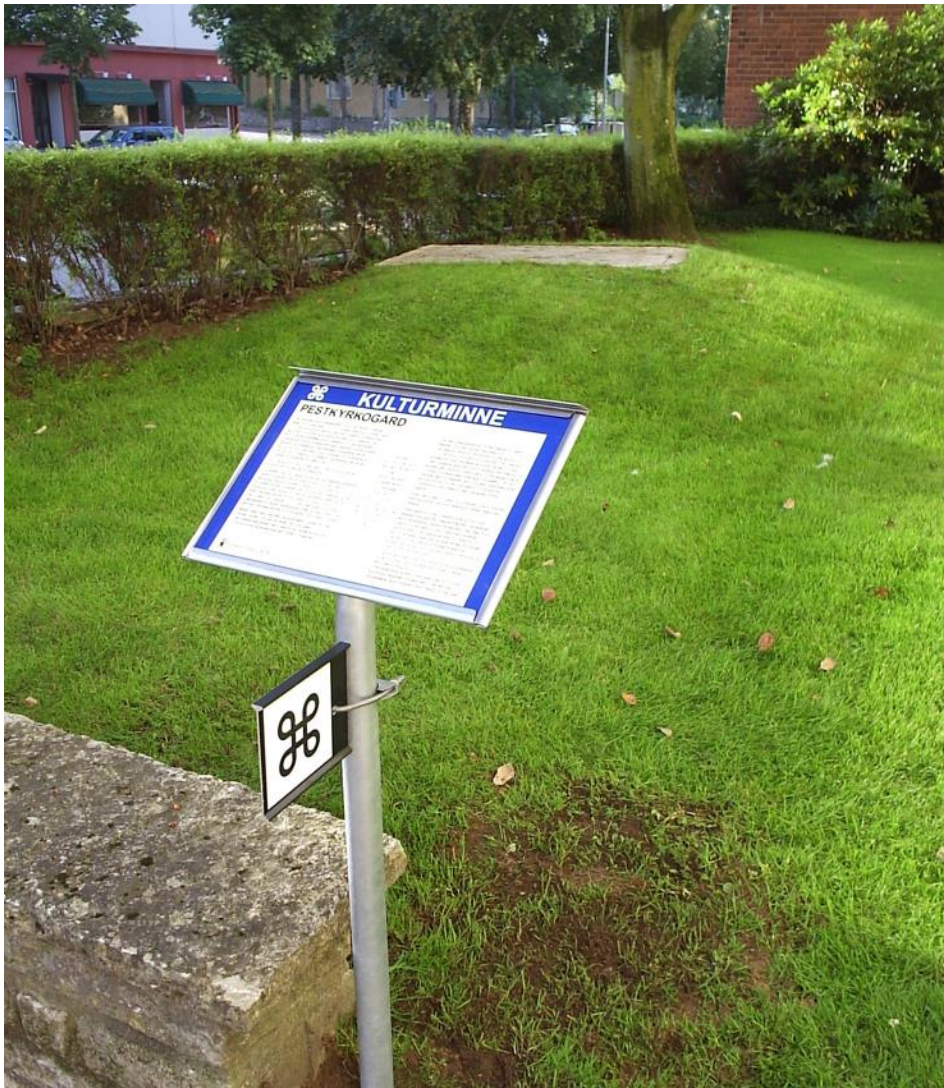
Skyltade pestkyrkogård i centrala Växjö.

Inom det kommunala kulturmiljöarbetet har Länsstyrelsen anordnat dialogmöten med alla kommuner och där har samtal om fornlämningar lyfts som möjligt utvecklingsområde.