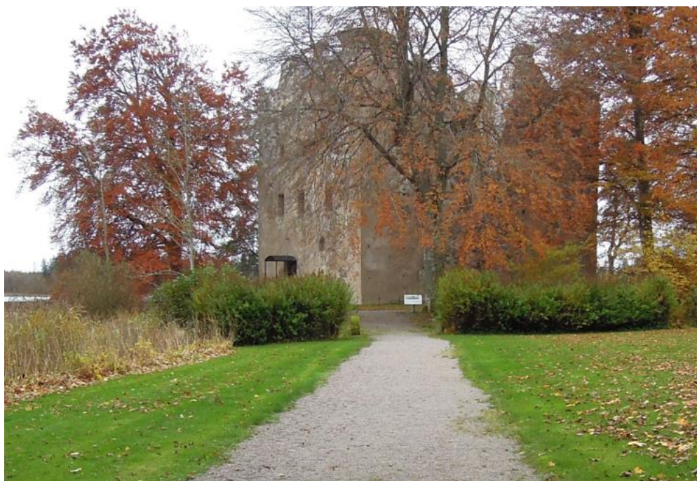
Bergkvara slottsruin, Växjö kommun. Stigen och skyltningen är tillgänglighetsanpassade.

Tillgänglighet definition: Tillgänglighet handlar om hur samhället utformas. Ett tillgängligt samhälle är utformat så att så många som möjligt kan använda och ta del av det. Det handlar om att kunna ta del av den fysiska miljön och kunna ta sig runt i samhället. Det innebär också att få tillgång till information och kommunikation samt att kunna använda produkter och tjänster. Digital teknik kan öka möjligheten för personer oavsett ålder, kön eller funktionsförmåga, att ta del av samhällsutbudet. Genom detta kan fler bli delaktiga och inkluderade.