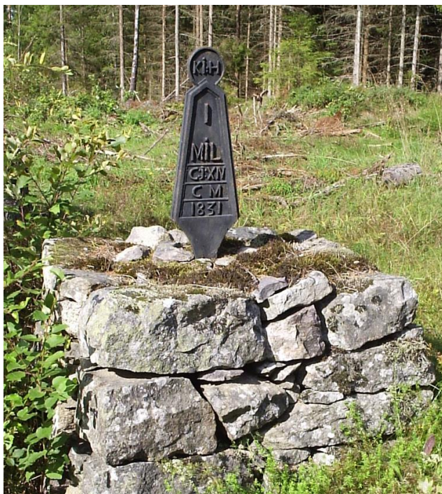
Milstolpe, Tingsryds kommun.