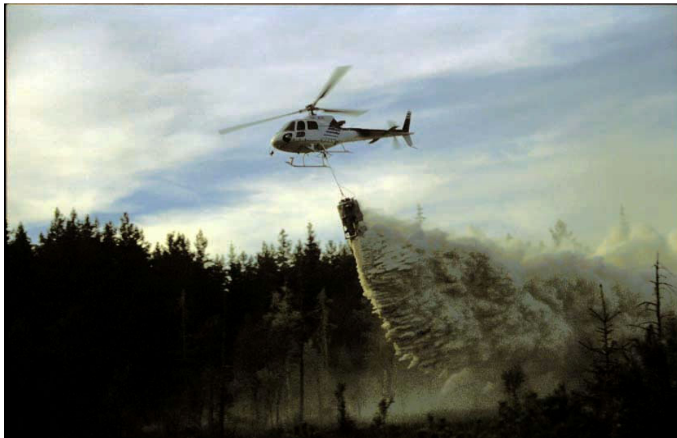
Figur 1. Utan en väl utbyggd kalkningsverksamhet hade många sjöar och vattendrag varit försurade i Jönköpings län. Helikopteralkning är en effektiv metod.

doserarna, vars syfte var att kalka både sjöar och vattendrag kom 1981 i Gislaveds och 1984 i Vetlanda kommun. Våtmarkskalkningen som är till för både sjöar och vattendrag startade 1985 i exempelvis Brusaåns källflöden i Eksjö kommun. Fullt utbyggd var kalkningsverksamheten i slutet av åttiotalet och har i stort sett haft samma omfattning sedan dess. Denna verksamhet har idag kommit att bli en mycket värdefull och välbehövad del av den aktiva naturvården i länet (figur 1).