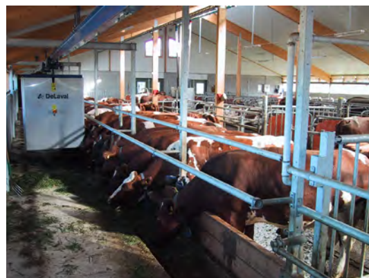
Energianvändningen i mjölkproduktionen kan variera stort.

Ett inspirationsbildspel finns på Greppa Näringen, www.greppa.nu , där man som lantbrukare eller odlare kan få tips om vilka åtgärder som ger mest klirr i kassan.