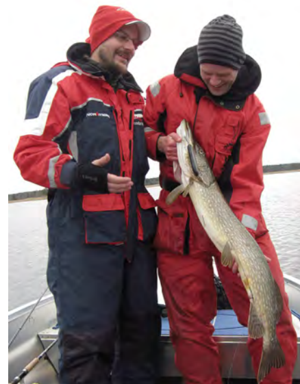
Gäddan är en eftertraktad fisk bland svenska och utländska sportfiskare.

kevävårdsområde, är mycket nöjd med slutresultatet: