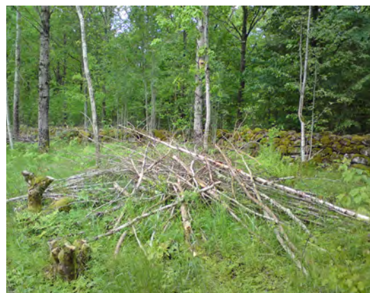
Mindre träd som ska sparas kan skyddas från bete genom att en hög av avverkningsris läggs runtom.

Man kan anlägga bryn av flera anledningar. Det kan vara för att gynna