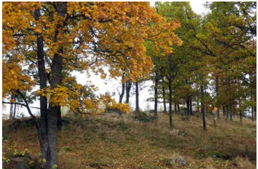
Trädbärande betesmark med mycket ek.

Att vårt landskap ser ut som det gör i dag, att marker fortsatt hålls öppna, att nya marker restaureras fram samt att framtidstro och vilja finns att utveckla företag så att landsbygden fortsätter leva är mycket tack vare just dig och ditt hårda arbete. Du gör en enorm skillnad och du behövs, så var stolt över dig själv! ■