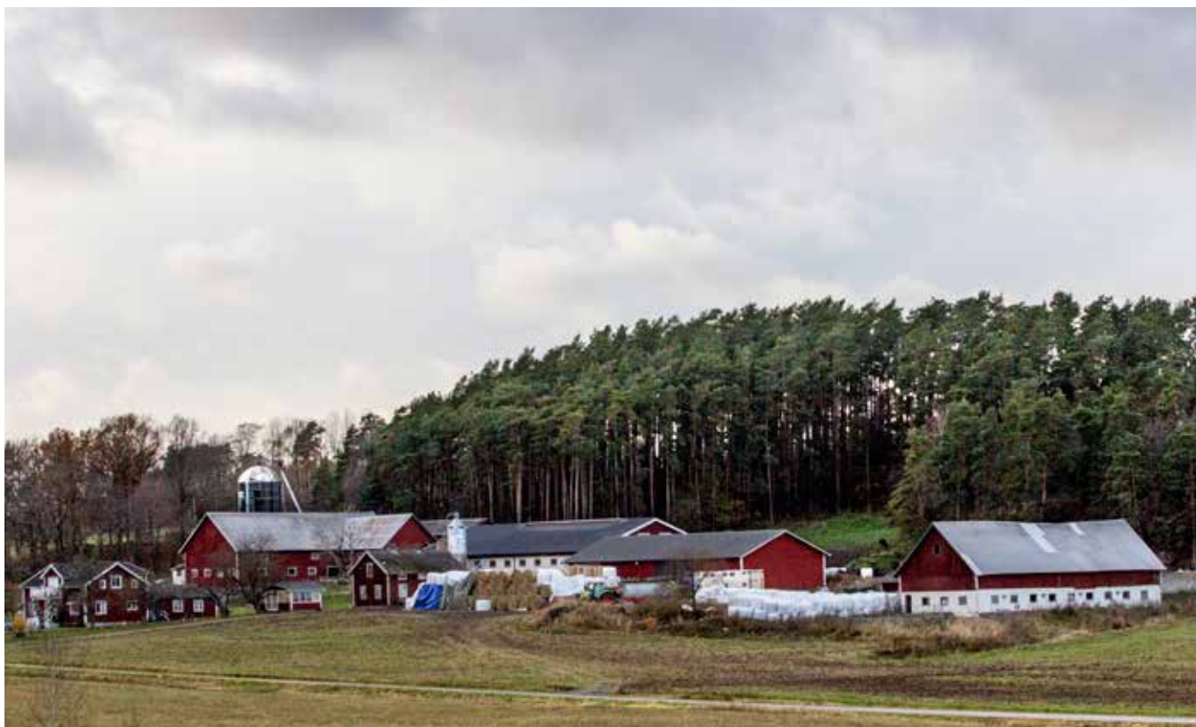
Gården utanför Skärstad ligger vackert mellan träd och öppna fält.

uppvuxen i en storstad är det kanske svårt att förstå vad som lockar med ett liv i den här miljön och där man måste mjölka korna vare sig det är julafton eller en vanlig tisdag.