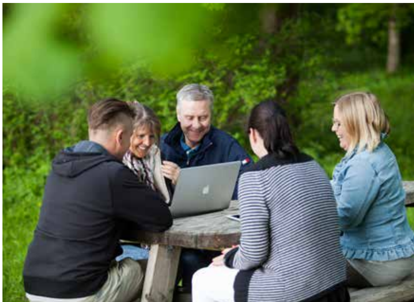
Snabbt internet är en förutsättning för att landsbygden ska fortsätta att utvecklas.

tunn fiberkabel kan du nå tidningar, företag, göra din åsikt hörd och prata med dina vänner. Även myndigheter och kommuner har stor nytta av att invånarna har tillgång till internet. Kultur och evenemang kan enkelt spridas, kommuner kan filma möten så att alla kan ta del av dem, hälsovården kan ge bättre trygghetslarm och använda ny teknik för att hjälpa äldre och sjuka, du kan nå din egen patientjournal eller en närståendes journal om det behövs och du får tillgång till myndigheters information dygnet runt.