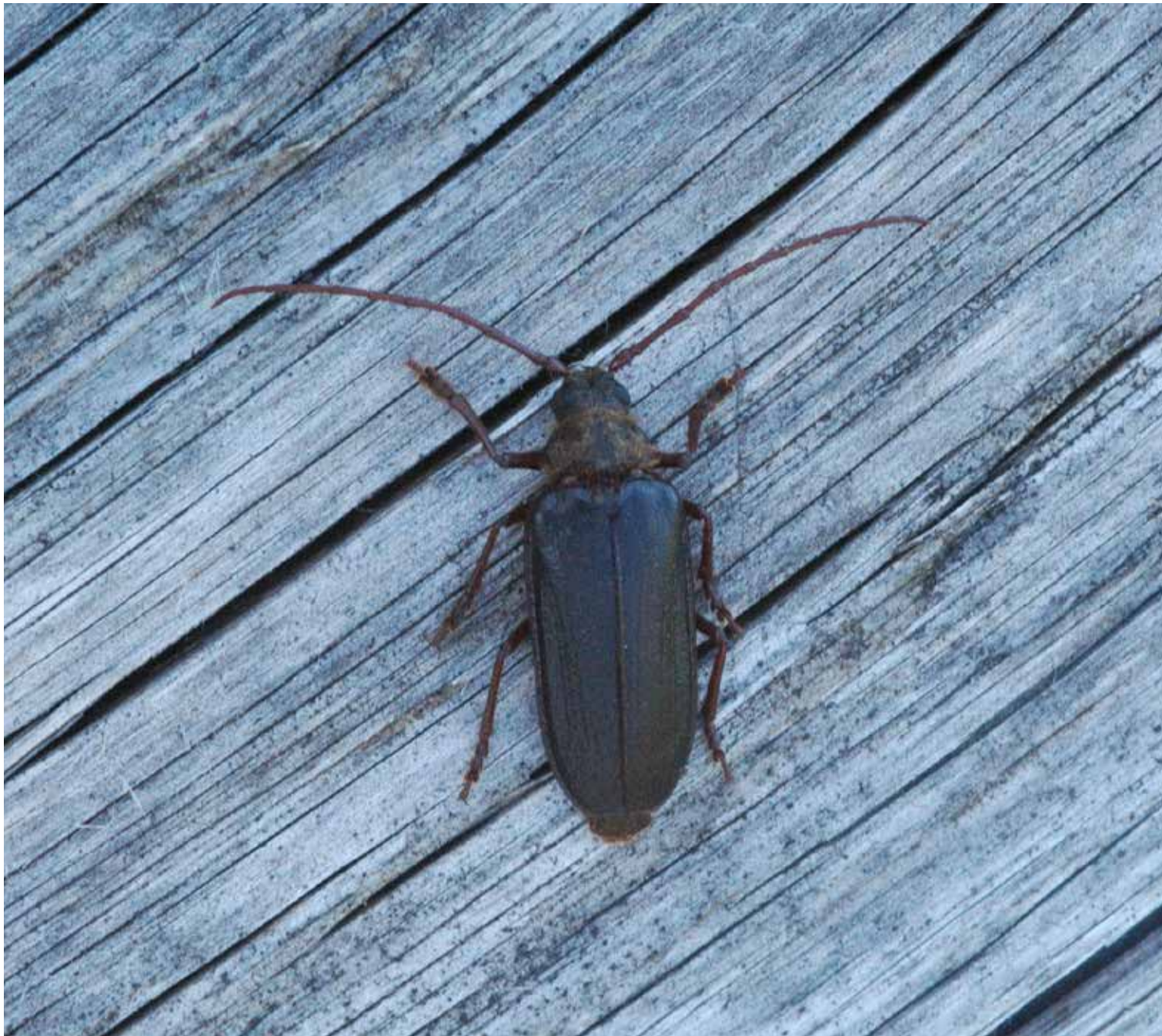
Raggbock, en av de vedlevande skalbaggar.

riset transporteras ut innan vedinsekterna svärmar på våren. Börja huggningen efter 1 augusti och avsluta utkörningen senast 15 april nästkommande år.