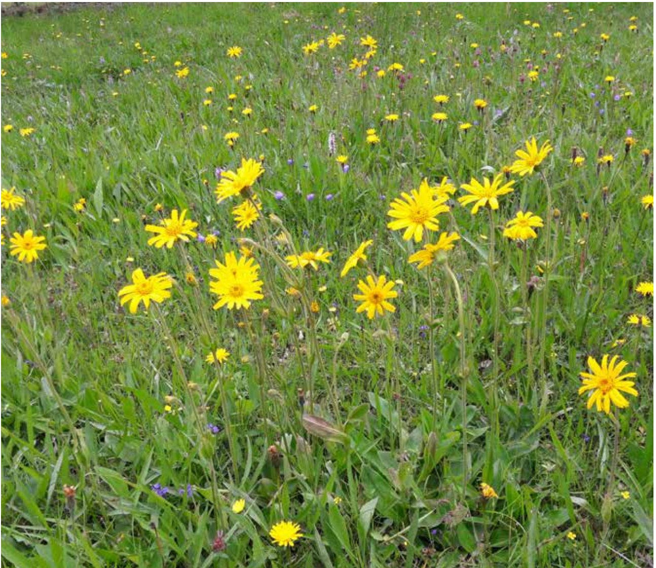
Slätteräng med svinrot, jungfrulin och fläckigt nyckelblomster.

logiska mångfalden eller ha andra sociala eller ekonomiska skadliga effekter inom EU. Det ska kanske tilläggas att arter som finns naturligt inom EU inte kommer med på en gemensam lista. Det gäller till exempel spansk skogssnigel eller vattenlevande arter som svartmunnad smörbult och vandrarmussla som naturligt lever i Svarta Havet men tagit sig hit och gör stor skada. En arts taxonomi, det vill säga släktskap, ska också vara klar. Blomsterlupin är inte samma sak i Sverige som i Nederländerna och innan arten utretts kommer den inte med på EU:s lista trots att den hotar att slå ut värdefull vägkantsflora i Sverige. Den gemensamma listan utgör så att säga en minsta gemensam nämnare och är ett resultat av många