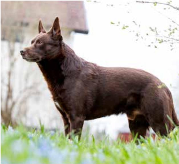
Många som bor på landet har hund för sällskap och som arbetskamrat.