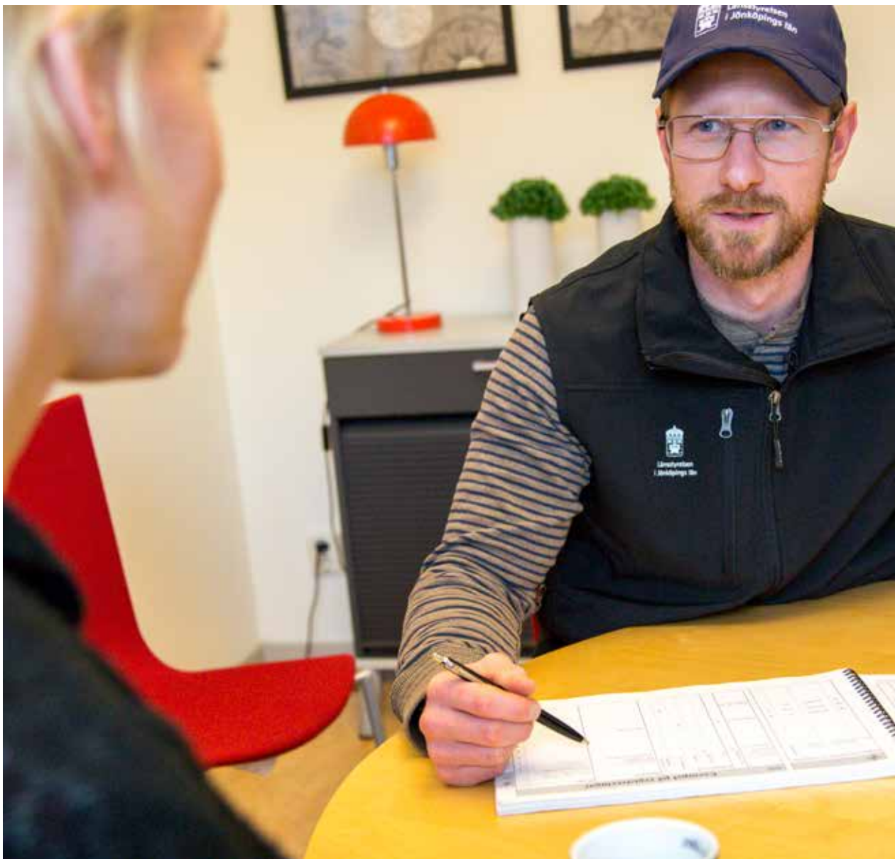
De flesta ersättningar kräver att lantbrukaren dokumenterar sina uppgifter.

i vissa fall avdrag och sanktioner för att det inte finns någon dokumentation. Vi kommer i fortsättningen inte att prioritera några kontrollföretag i kommande utbetalningar där vi inte får tillgång till erforderlig dokumentation vid kontrolltillfället.