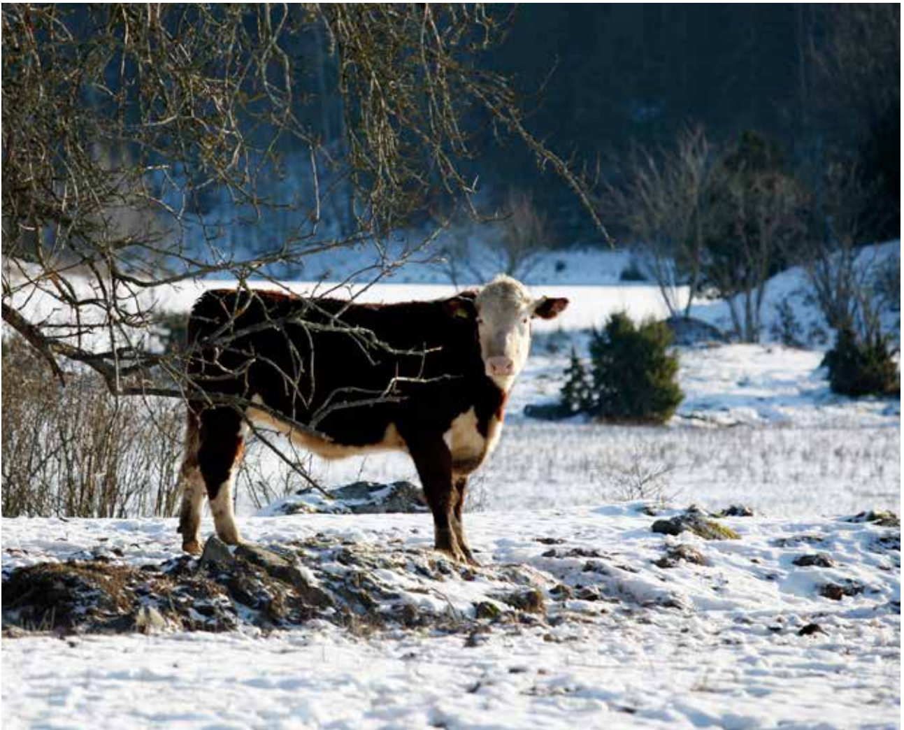
Djur som hålls utomhus ska ha tillgång till en ligghall med ren och torr ströbädd

det finns plats till. Överbeläggning leder ofta till smutsiga liggytor och smutsiga djur.