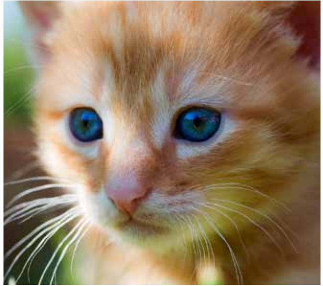
En kattunge ska inte lämna mamman innan den fyllt tolv veckor.

D u gör klokt i att välja hundvalp från en seriös uppfödare som endast säljer valpar som är vaccinerade, avmaskade och veterinärbesiktade, då minskar risken för att du köper dig problem. Hundvalpar får lämna sin mamma när de fyllt åtta veckor