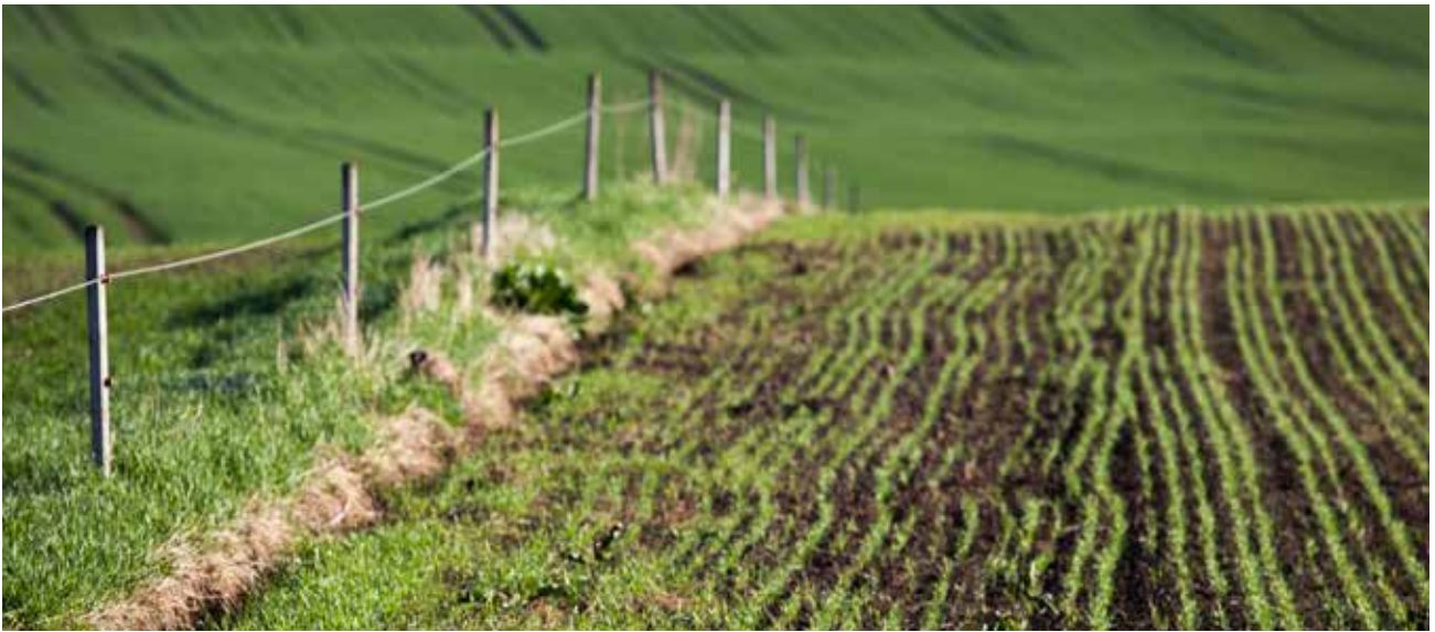
Jordbruksmark ska brukas aktivt.