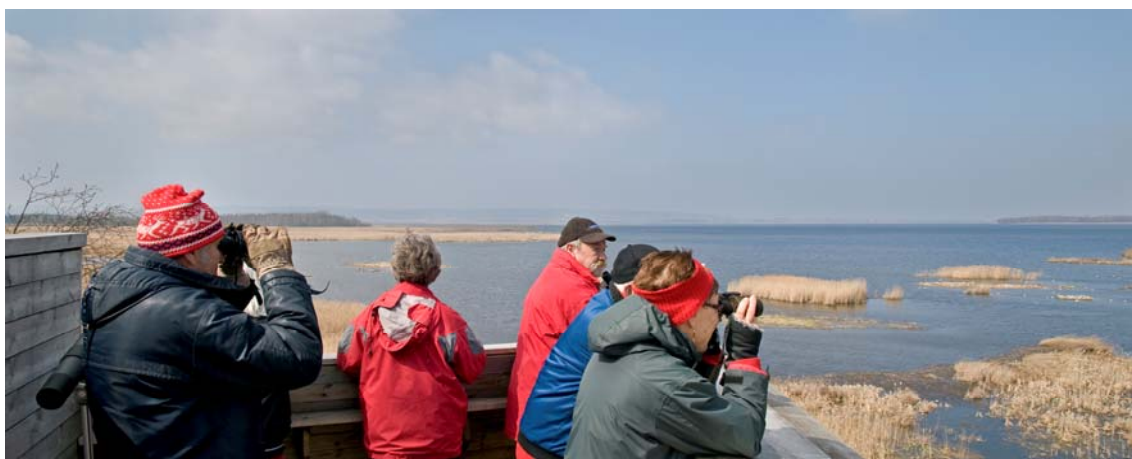
Strandmiljön är viktig för så väl det rörliga friluftslivet som fågellivet.

Inriktningen för varje område bör anges och motiveras. Av översiktsplanen/tillägget bör det också framgå ungefär vilka åtgärder som är tänkta inom respektive område. Översiktsplanen bör också redovisa hur exploateringen av respektive LIS-område kan förväntas bidra till utveckling av landsbygden; positiva sysselsättningseffekter eller ett utökat serviceutbud.