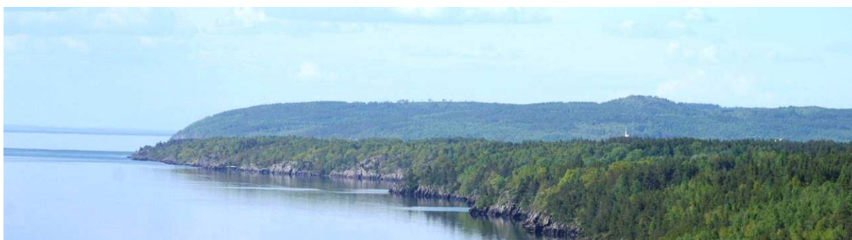
Utsikt över Omberg.