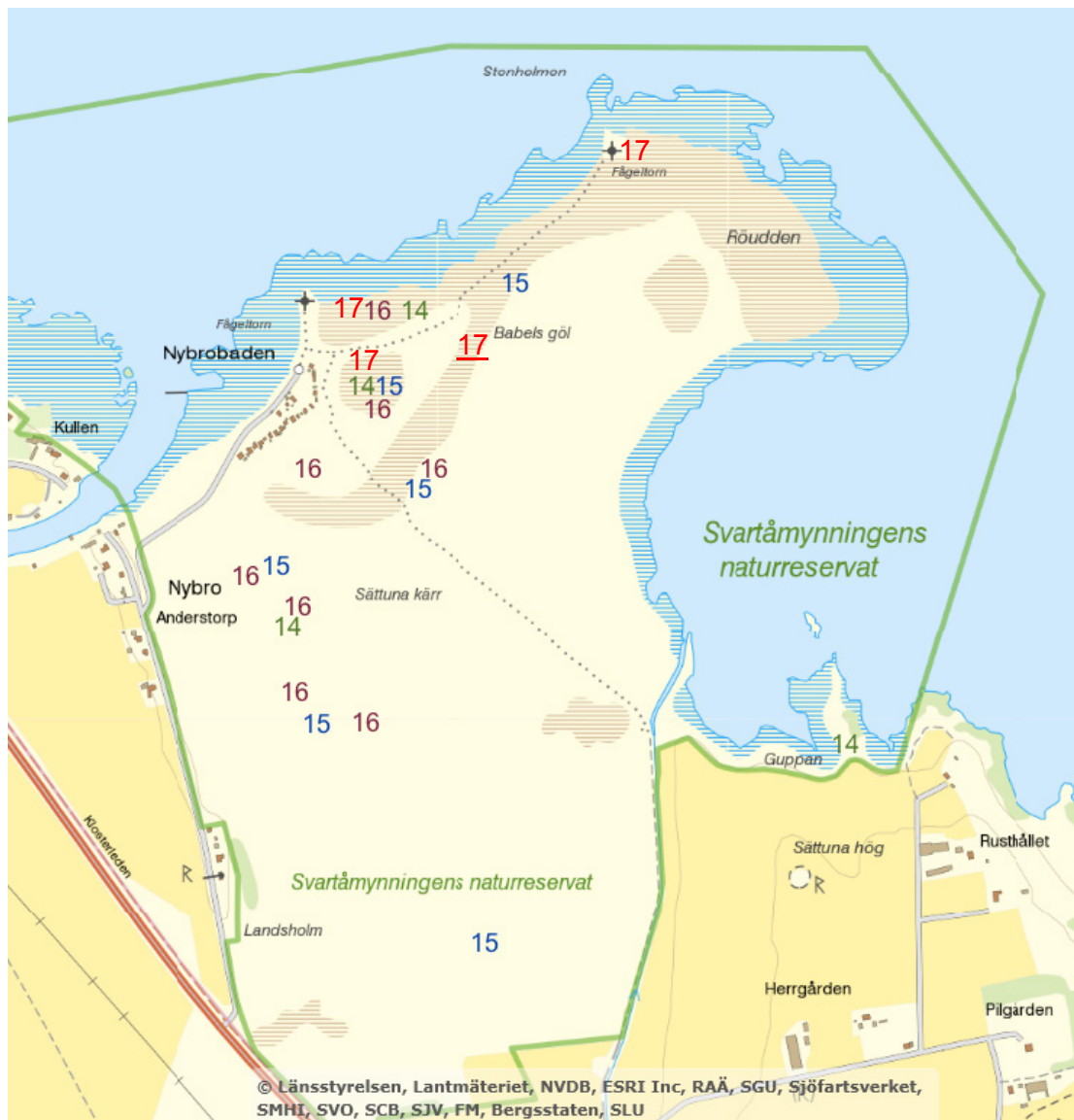
Häckningsplatser för 2014 - 2017 med fyra, sex, åtta och fyra häckande par respektive säsong. Paret med konstaterad häckning 2017 understruken.