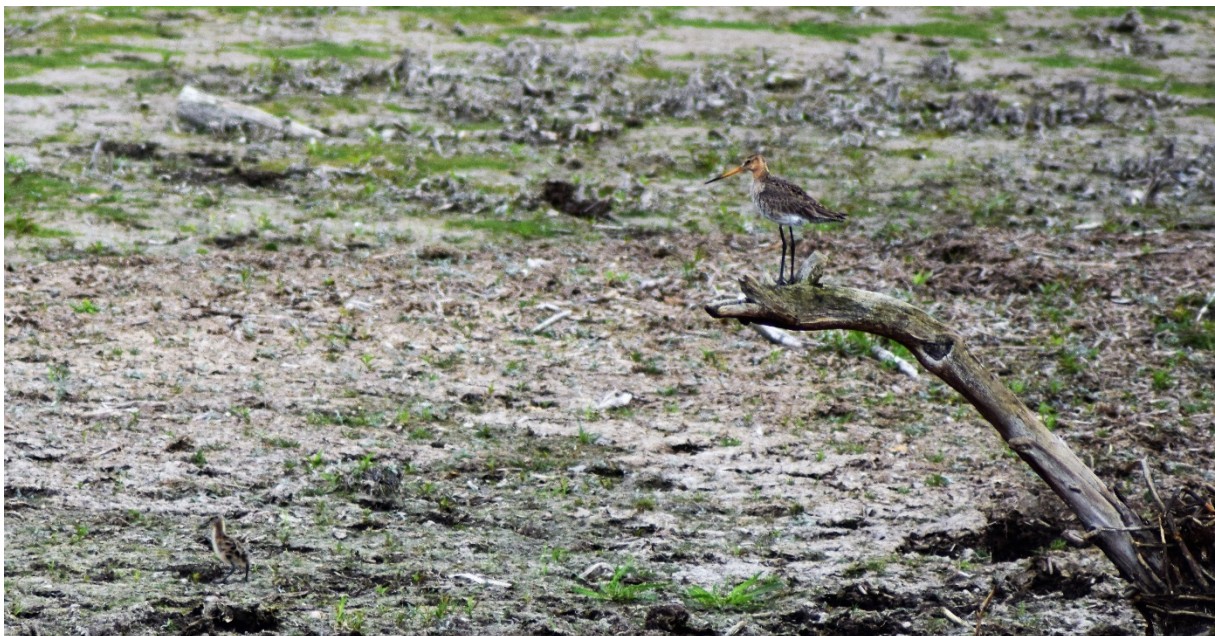
Fotot visar en nykläckt unge (neder vänster i bild) av Rödspov med en övervakande förälder (sittande på grenen).

Paret nedanför plattformen i Nybro försvann sen från sitt revir och var helt borta från reviret 8.6. Så nu fanns det bara 1 par kvar, paret vid Babels Göl. Min inventering var nu begränsad till Nybro och då framförallt SO om sommarstugorna. Jag visste ju att det inte fanns några andra revirhävdande rödspovar i reservatet. Den 14.6 inträffade något roligt! Jag stod vid plattformen i Nybro och fick då se 1 pulli (årsunge/nyligen kläckt) rödspov med sin mamma strax hitom Babels Göl! Och efter ytterligare 10 minuter sågs 2 pulli med sina föräldrar! Enligt mig själv så var ungarna ca 1 vecka gamla.