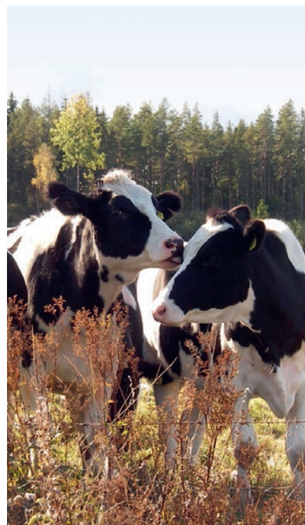
Hindrande stängsel och djur på bete kan göra arbetet med underhåll av ett vattendrag svårare.