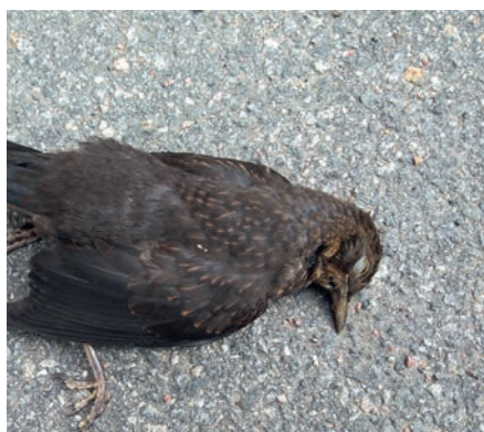
Usutuvirus påträffat i Östergötland sid. 18