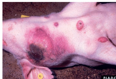
Gris som avlidit i afrikansk svinpest. Bilden visar blödningar i huden.