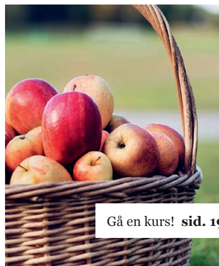
Gå en kurs! sid. 19