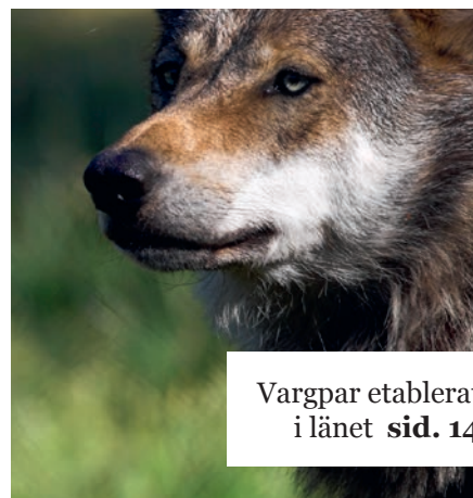
Vargpar etablerat i länet sid. 14