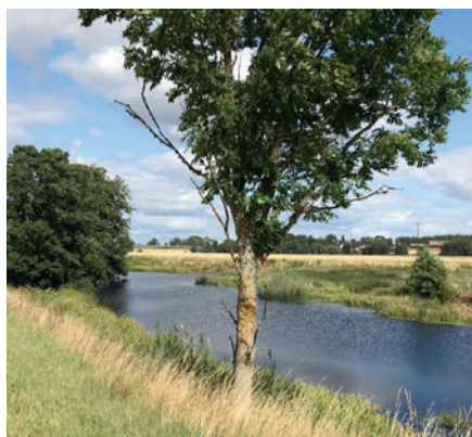
Från igenväxning till öppet vattendrag sid. 6