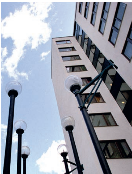
Dagvatten från samhällen och vatten från hårdgjorda ytor kan påverka ett vattendrag.