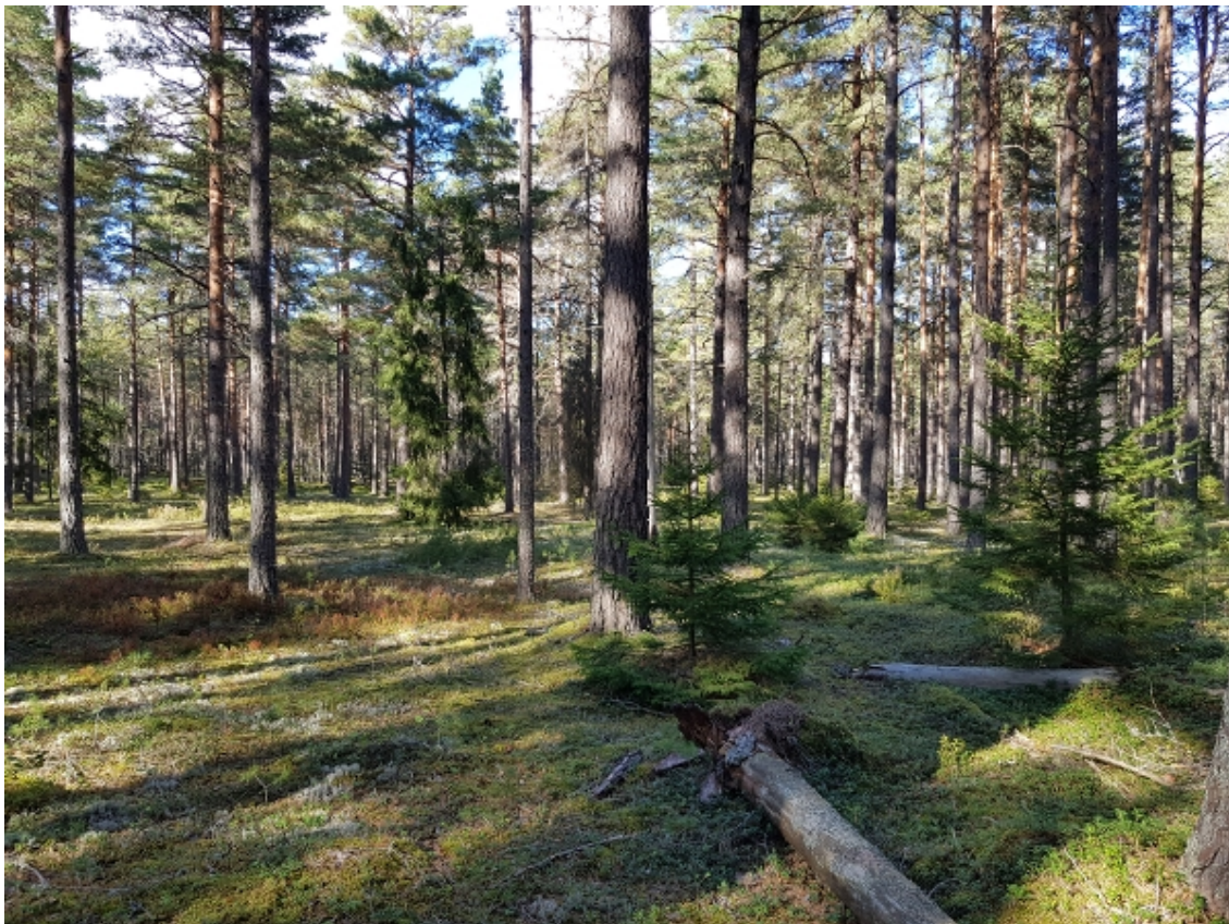
Knärot, grönpyrola, motaggsvamp och lakritsmusseron är exempel på arter som trivs i sandbarrskogar.