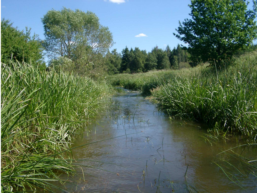
Figur 4. Sävjaån. Bilden visar lokalen vid Spångtorp. Här påträffades spetsig målarmussla, vandrarmussla och allmän dammussla

6639704 1614500 Spetsig målarmussla, vandrarmussla och allmän dammussla 50 m Medel Beläget på strömsträckan vid Spångtorp. Strömmande vatten över ler-, sand- och grusbotten. Beväxt med säv. Se Figur 4. 17 exemplar av spetsig målarmussla samt ett 30-tal vandrarmusslor. Tre skal och tre levande allmänna dammusslor.