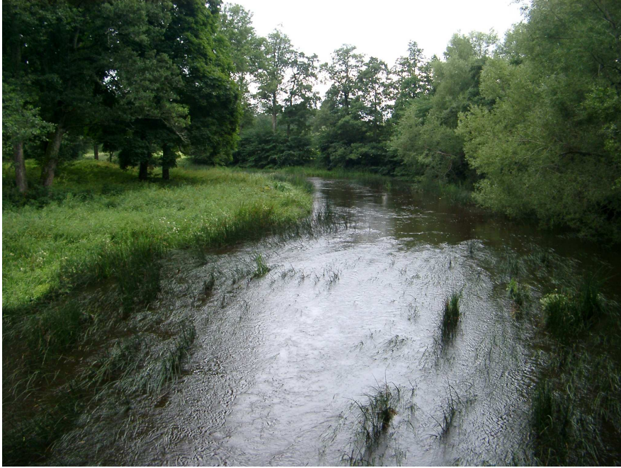
Figur 3. Tämnrån vid Västland. Här påträffades spetsig målarmussla och flat dammussla.