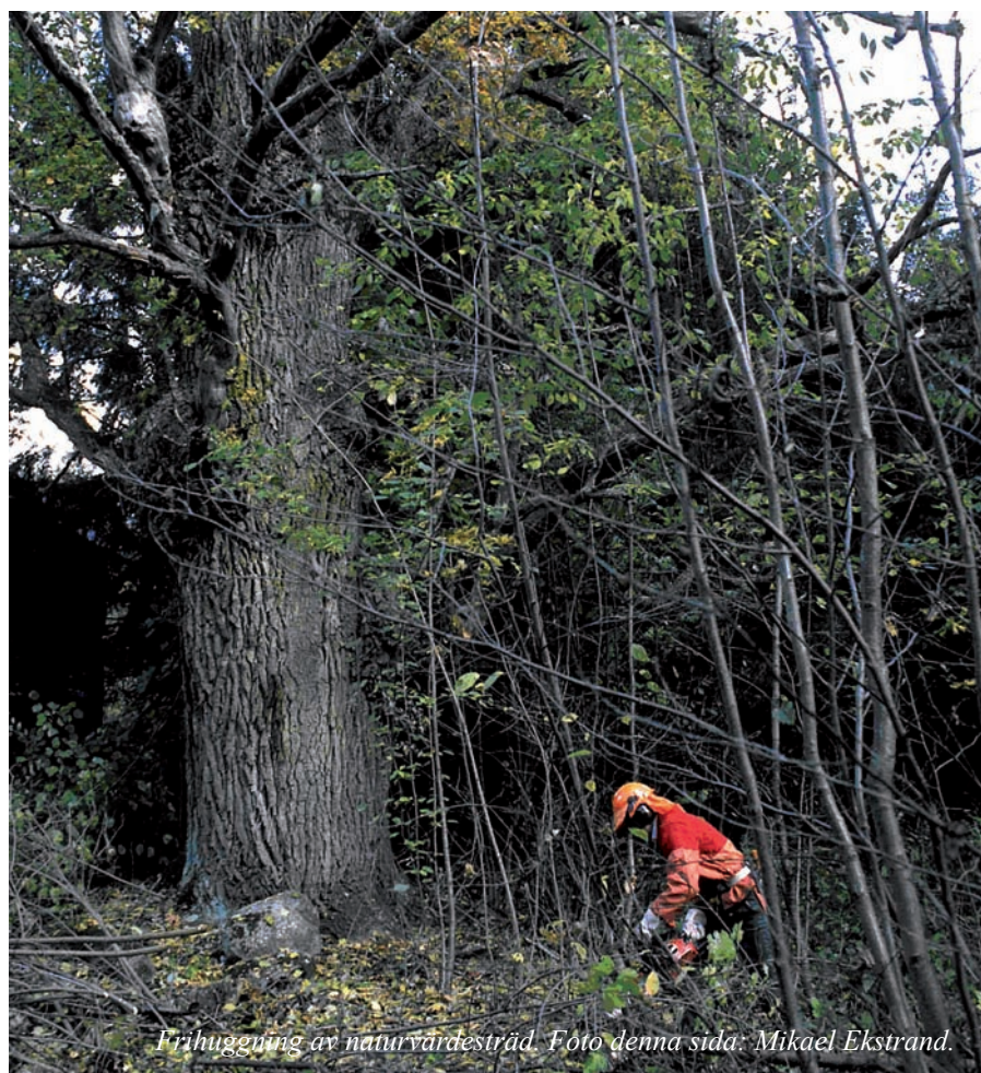
Frihuggning av naturvärdesträd.

Helena Ringblom, Skogsstyrelsen, 018-27 88 28