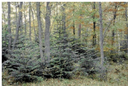
Röj/gallra fram ädellövskog

Väljer du att plantera ädla lövträd så kan du söka stöd för markberedning, stängsling inklusive stängselmaterial och plantering inklusive plantkostnad. Stödet kan beviljas med högst 30 000 kr/ha. Observera att det ska vara mark där det inte funnits ädellövskog tidigare. Har du en blandskog där ädla lövträd ingår kan du få stöd med högst 60 % av kostnaden för att röja/gallra fram ädellövträden.