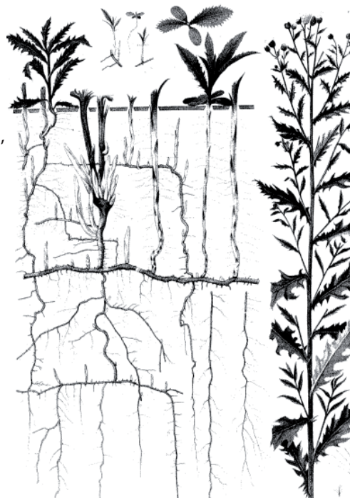
Tistelns kraftiga rotsystem ger den konkurrensfördel gentemot ettåriga grödor. Källa: Korsmos ogräsplanscher.

Fenoxysyror och flera andra herbicider är effektiva mot tisteln. Vid glyfosatbehandling på stubben på hösten är det viktigt att vänta 2-4