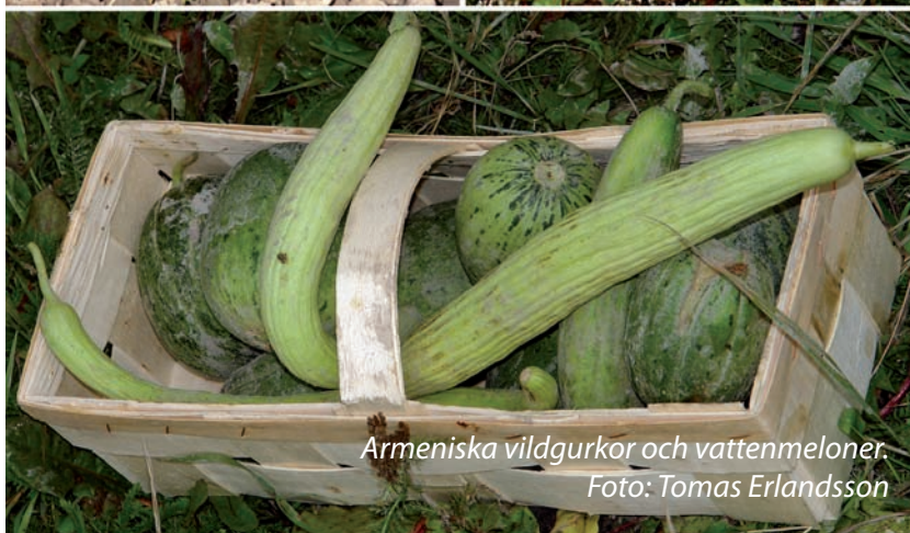
Armeniska vildgurkor och vattenmeloner.