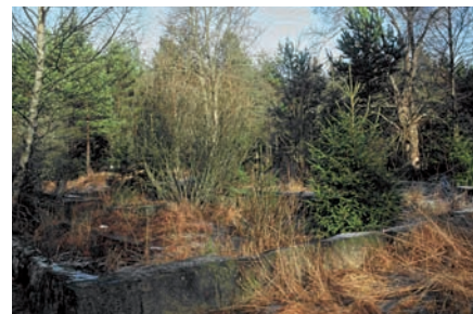
Frihugga och rensa kulturmiljö