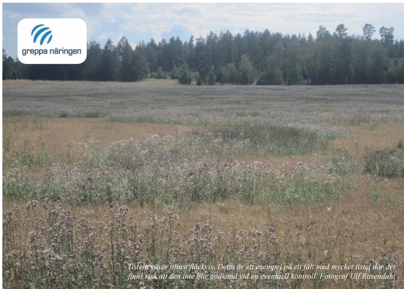
Tisteln växer oftast fläckvis. Detta är ett exempel på ett fält med mycket tistel där det finns risk att den inte blir godkänd vid en eventuell kontroll.