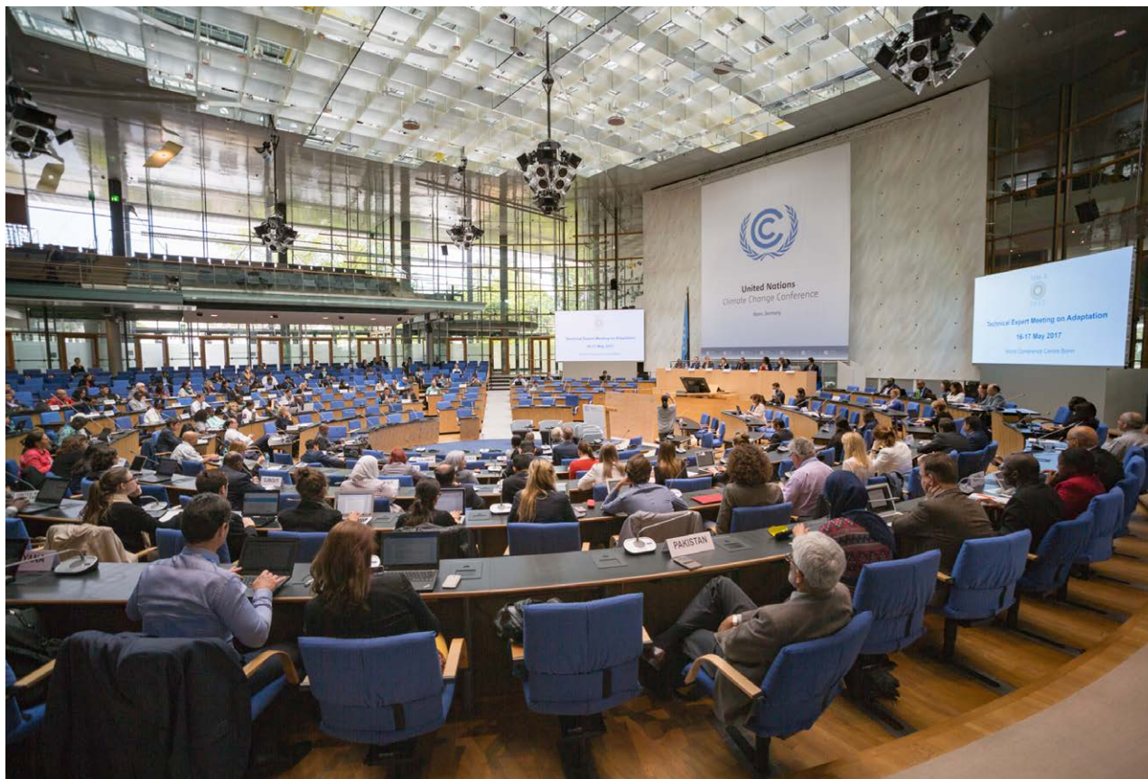
COP 23 – UN Climate Change Conference November 2017.

mer en mer grundläggande analys av detta komma i IPCCs Assessment Report 8. Tills vidare, för att inte behöva riskera att krympa budgeten senare, har vi därför valt att ha kvar AR6 som utgångspunkt vid beräkning av budgetar och utsläppsminskningstakt. Det skulle då potentiellt innebära att utsläppsminskningstakten i denna rapport ökar sannolikheten för att nå betydligt under för 2,0 gradersmålet och att nå 1,5 gradersmålet.