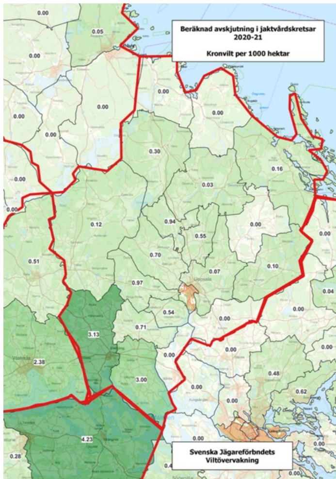
Figur 1. Svenska Jägareförbundets karta visar avskjutning av kronhjort per 1000 ha i de lokala kretsarna. Det ger en bild av var tätheterna av kronhjort är som störst.