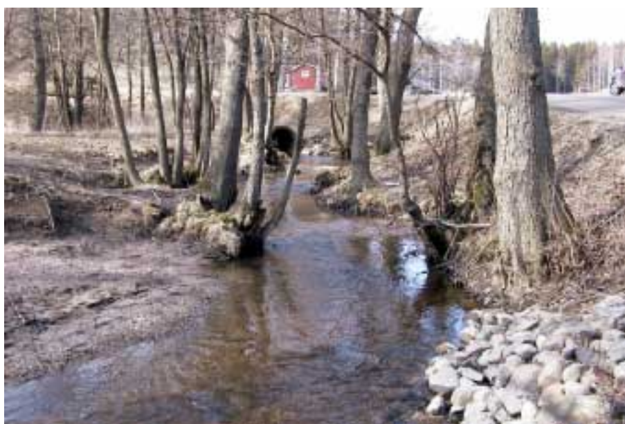
Provpunkt 4 Åvaån vid Åvagård.

En undersökning av bottenfaunan i tre sjöar och ett vattendrag