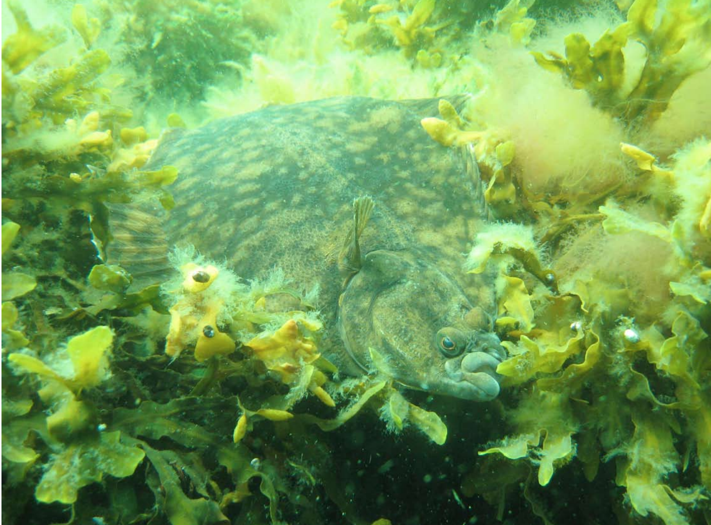
Skrubbskädda / flundra.

Du kan beställa fler faktablad från Länsstyrelsens naturvårdsenhet, tfn 08-785 40 00 Faktabladet finns också som pdf på vår webbplats, www.lansstyrelsen.se/stockholm