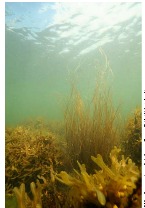
Blåstång och snärjtång.