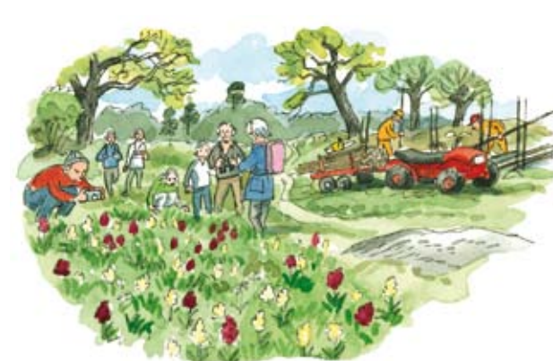
Slätterbalk och fyrhjulning har nu ersatt lie, häst och en del av bondens oändliga slit. Målet är att bevara ett artrikt, äldre odlingslandskap.

Blomsterprakten är häpnadsväckande. Under våren är markerna översållade med gullvivor och i fuktiga partier av Långängen växer rosa majvivor. Några andra blommor i ”Ängsöbuketten” är höskallra, kungsängslilja, ramslök och vårärt. Tänk bara på att du inte får plocka dem!