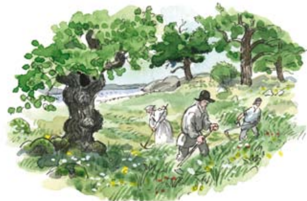
Slätter har under århundraden format Ängsös vackra landskap och örtrika blomsterängar.

Slätter har troligen bedrivits på Ängsö sedan medeltiden. Då bestod Ängsö av två mindre öar och i det grunda sundet mellan öarna skördades vass. Men landhöjningen innebar att vassen ersattes av gräs- och örter, och vid slutet av 1700-talet förenades öarna till en ö.