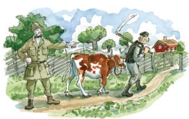
När Ängsö blev nationalpark fick torparen inte längre slå ängarna. Det blev inledningen till en av Sveriges största naturvårdsskandaler.