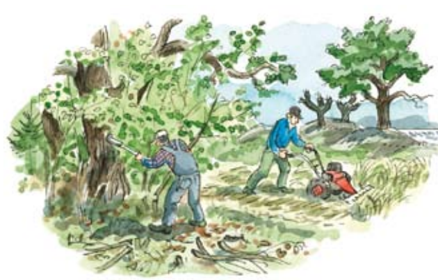
När skötseln upphörde växte markerna igen. Återställning av det gamla kulturlandskapet krävde mycket arbete.

Först 1943 skrevs ett åtgärdsförslag för Ängsö som resulterade i omfattande röjningar, lieslätter och bete. Men efter några år flyttade den dåvarande bonden med sina djur från ön och markerna blev åter utan skötsel. På 1950-talet anställdes en tillsynsman, markerna röjdes, slåttern återupptogs och betesdjur kom åter till ön. Ekonomibygnaderna byggdes ut och rustades upp.