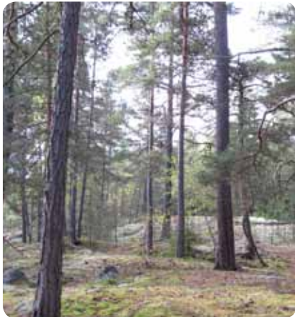
Gammal hällmarkstallskog är en av många naturtyper som finns i området.