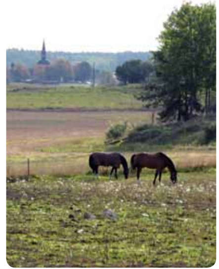
Markerna på Lovön har brukats i flera tusen år.

Reservatsbildningen av området ska i första hand skapa möjligheter till ett omsorgsfullt fortsatt brukande av landskapet. Det kan innebära att du som äger eller förvaltar mark kan få råd och stöd att utföra vissa skötselåtgärder som kan hjälpa till att förhöja de värden som redan finns – som att tydliggöra fornlämningar eller öka förutsättningar för den biologiska mångfalden.