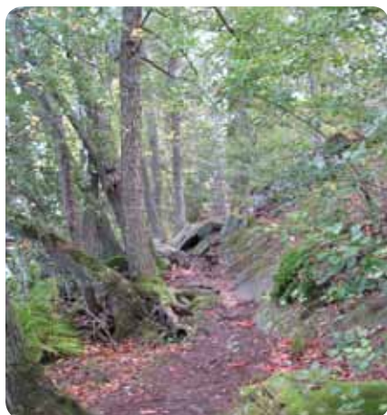
Kärnsön är ett populärt mål för friluftslivet.