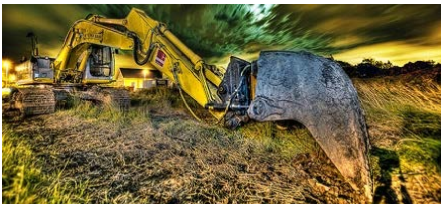
En rapport från Statskontoret visar på brister i kommunernas markanvisningar.