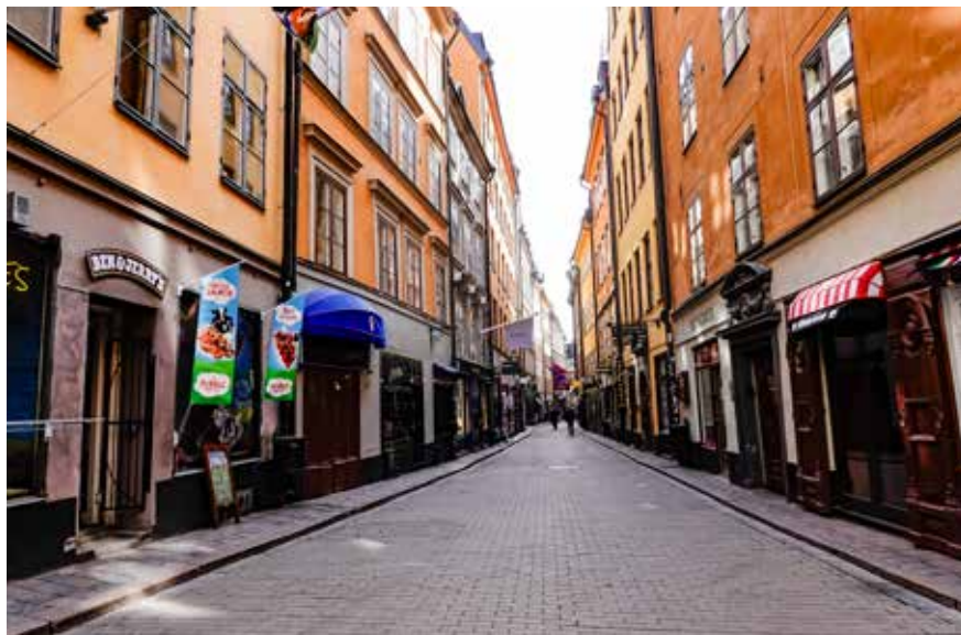
De annars folkfyllda gatorna i Gamla stan ekade tomma, bilden visar Västerlånggatan i slutet på mars 2020.