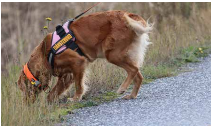
Golden retrievern Tezla är en av landets tio besiktningshundar.