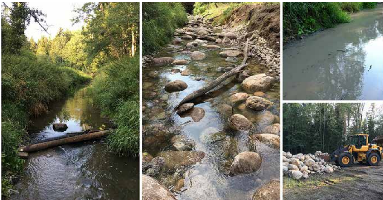
Restaurering av Vitsån, bilden i mitten visar slutresultatet.

uppskattningsvis 1,5–2 miljoner människor som årligen ägnar sig åt sportfiske i någon form. Även om inte alla dessa anlitar fiskeguider är potentialen och det ekonomiska värdet stort, och det ökar över tid.