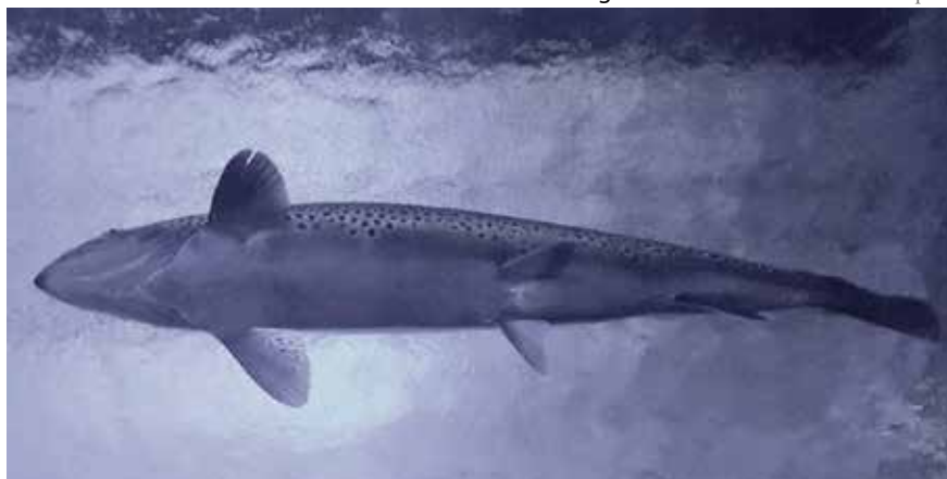
Havsöring underifrån.

Det är stora ekonomiska värden som genereras av fisketurismen. Hur stora de är undersöks i projektet. Omkring tio miljoner sportfiskare finns i Östersjöregionen, bara i Sverige är det