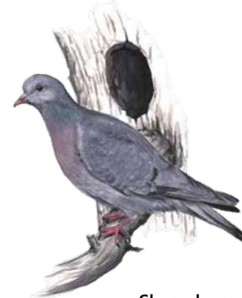
Skogsduva Columba oenas