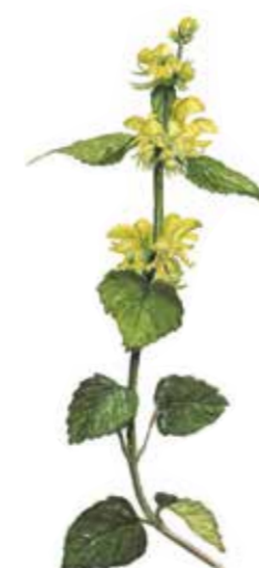
Gulplister Lamiastrum galeobdolon