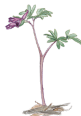
Smånunneört Corydalis intermedia