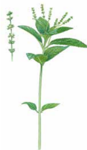
Skogsbingel Mercurialis perennis