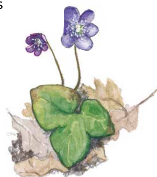
Blåsippan får hjälp av myror att sprida fröna. Hepatica nobilis Liverleaf Gewöhnliches Leberblümchen

De gamla ängarnas träd har idag återerövat marken och slutit sig till en frodig ädellövskog. Här finns träd som är 250 år gamla, som innehåller en hel värld av svampar och småkryp. På skrovliga stammar växer ovanliga lavar som bokvärtlav och stiftklotterlav. I asksumpskogens näringsrika mylla växer vätters och gullpudra. Våren är sippornas tid. De blommar i vitt, gult och blått innan trädens blad slår ut.