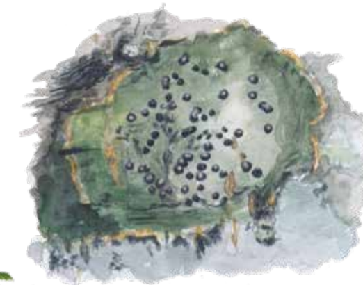
Bokvärtlav Pyrenula nitida A pox lichen Glänzende Kernflechte