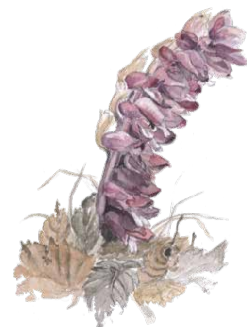
Vättersen har inget klorofyll utan snyltar på hasselns eller alens sockerförråd. Lathraea squamaria Toothwort Gewöhnliche Schuppenwurz