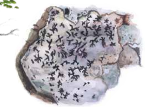
Stiftklotterlav och bokvärtlav är två ovanliga lavar som växer på de gamla bokarna i reservatet. Opegrapha vermicellifera A lichen Wurmfrüchtige Zeichenflechte

I årtusenden har vi människor brukat marken här – i slänterna ner mot Ringsjön. Förr bredde trädklädda ängar ut sig i landskapet men idag har skogen slutit sig och används för hundpromenader och picknick. Reservatet är en del av Fulltofta strövområde, så det finns gott om stigar att utforska i omgivningarna. I kanten av reservatet finns St Magnhilds källa, väl värd ett besök, med historier om både mördare och helgon.